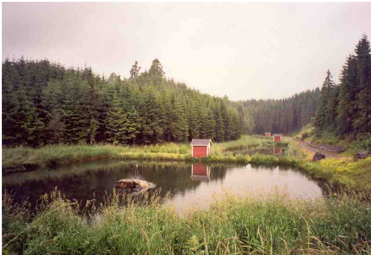
Bilde 1: Etterpoleringsanlegget i Skjønhaug med rislefiltere og tre rensedammer.