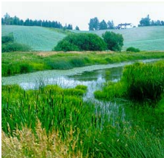
Bilde 4: Våtmark i jordbrukslandskap.

Dersom ubehandlet avløpsvann blir sluppet direkte ut i resipienten, vil vannkvaliteten bli dårlig. Nitrogen og karbon vil også brytes ned i bekker og elver på samme måte som i våtmarker og dermed bidra til utslipp av klimagasser. De positive effektene av konstruerte våtmarker når det gjelder vannkvalitet vurderes derfor som viktigere enn de negative effektene av drivhusgassutslippene.