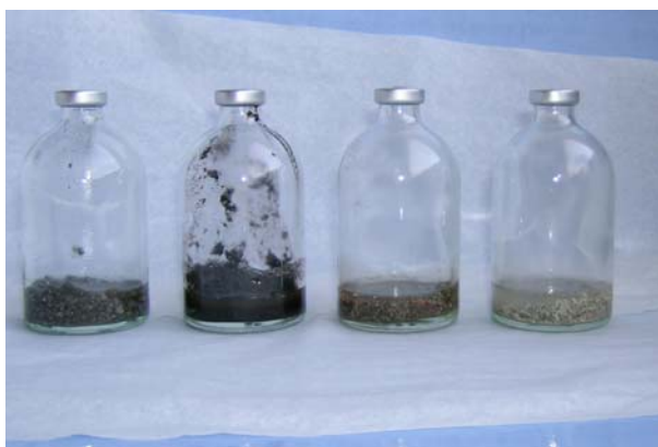
Bilde 3: Flasker brukt i laboratorieforsøket, fra venstre lettklinker, torv, sand og skjellsand.

Forsøkene omfattet ulike filtermaterialer brukt i filterbedanlegg og konstruerte våtmarker. Det ble tilsatt ulike oksygen- og nitratkonsentrasjoner. Følgende filtermaterialer ble brukt: skjellsand, lettklinker (leca), sand og torv. Filtermateriale og kommunalt avløpsvann med NO 3 - ble tilsatt små flasker (se bilde 3) som ble gjort anaerobe. Gassutviklingen inni flaskene ble målt på en gasskromatograf.