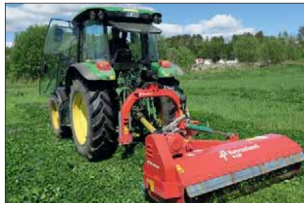
Bilde 2. Første avpussingen i forsøksfeltet på Landvik, Grimstad, 24. mai 2017.