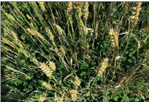
Bilde 1. Tynn dekkvekst av Demonstrant vårhete gav gode forhold for kvitkløverplantene i bunnen av bestandet i såingsåret 17. august 2016.

I samsvar med dekningsprosentene om høsten var det bare små og usikre forskjeller i høsta TS-avling