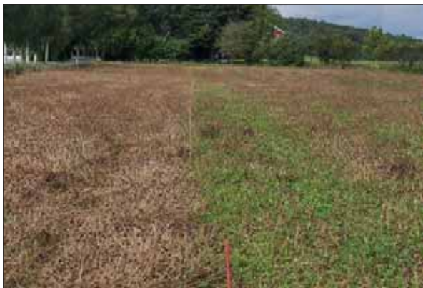
Bilde 2. Før siste nedsviing 17. august var det mindre synlig gjenvekst av grønne blad på rutene som var tidlig svidd med MCPA (ledd 5, t.v.) enn på rutene som bare var sprøytet med Reglone (ledd 2, t.h.).

Gjennomsnittlig frøavling var 15,9 kg/daa, noe som er litt i underkant av femårsmiddelet for 'Litago' i den praktiske frøavlen. Frøspillet som gikk tapt under treskinga var i gjennomsnitt 2,3 kg/daa. Avlingspotensialet på den aktuelle høstetdagen var med andre ord 18,2 kg/daa.