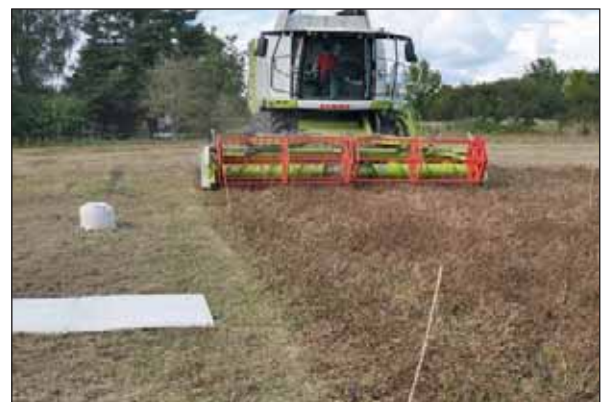
Bilde 1. Tresking av ei rute som var sprøytet både med MCPA og Reglone (ledd 5) den 21. august 2017. Til venstre vises oppfangerplata som ble kastet inn under treskeren mens den kjørte framover i enga for å registrere frøspill.

På alle rutene ble frøspillet vurdert. Dette ble gjort ved å samle opp halmen fra hele skjærebredden