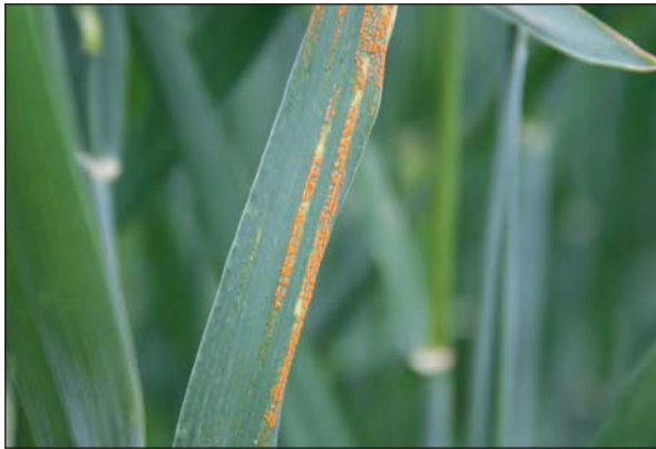
Bilde 1. Gulrust i hvete.

i slutten av juni. Gulrustobservasjoner i 2016 fra vanlige forsøksfelt er derfor relativt begrensa. Men i tillegg til vanlige avkastningsfelt ble sjukdommen også registrert i spesielle sjukdomsobservasjonsfelt. Disse er sådd et par uker etter vanlig såtid for å få større smittetrykk av bladsjukdommer som gulrust og mjøldogg.