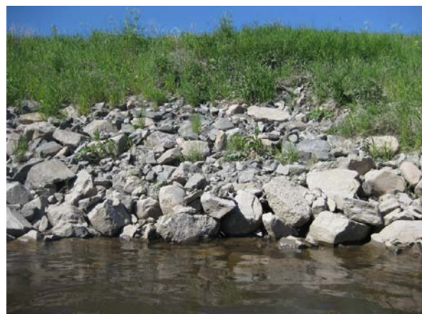
Mekanisk forbygning benyttes gjerne i utsatte skråninger, for å beskytte hus og infrastruktur. Her er det brukt sprengstein, som kan lekke næringsstoffet nitrogen og som derfor kan gi uønsket algevekst i vannet.

er, eller hvor lenge utlekkingen foregår. Vi vet per i dag ikke hvor omfattende dette problemet er, eller hvor lenge utlekkingen foregår.