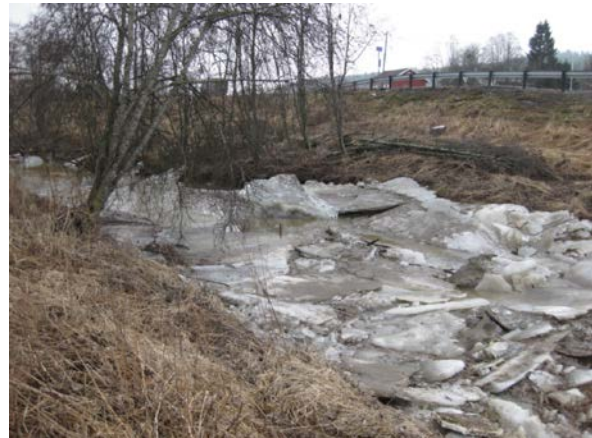
Ved isgang vil trestammer og -røtter beskytte bankene mot graving.