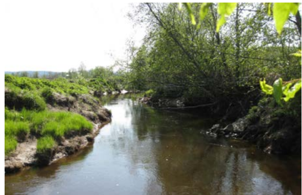
Trær langs vassdrag kan tette dreneringssystemer og skape utfordringer for matproduksjon

bekker, elver, fangdammer eller innsjø. I 2017 gjennomførte vi spørreundersøkelser blant grunneierne om erfaringene fra prosjektet. Resultatene er i sin helhet referert i [4].