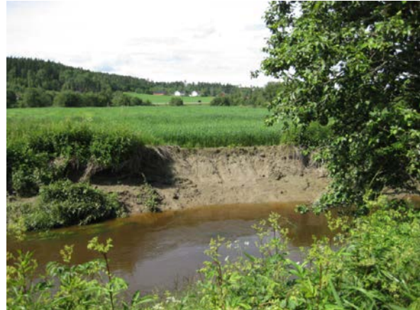
Målinger langs Haldenvassdraget viste at elvebanker uten trær hadde 5-10 ganger større jordtap enn banker med trær.

Mange benytter sprengstein til erosjonssikring, men da er det viktig å være klar over at steinene kan lekke nitrogen, som er et viktig næringsstoff for alger. Vi vet per i dag ikke hvor omfattende dette problemet