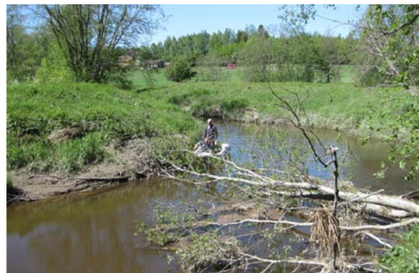
Trevelt over elva kan være irriterende for båtlivet, men er gullverdt for fisk og annet liv i elva.

Vassdrag er mye brukt til friluftaktiviteter, som bading, fiske, båtliv, kano- og kajakkpadling. Dessuten legges ofte stier og turveier langs elver og innsjøer, siden utsikten til vann og muligheten til å oppdage vannlevende organismer som fisk, fugl, amfibier og små pattedyr kan øke opplevelsesverdien av turen. For friluftslivet langs og i elver er det ofte viktig med tilgang til vannstrengen og fri ferdsel i vannet. Da kan det være ønskelig å 'renske' bort en del trær og busker som har falt ned, og å rydde turveier langs vannet. Når vassdrag skjøttes med tanke på friluftsliv er det imidlertid viktig å huske at dyrelivet – både på land og i vann – påvirkes kraftig når kantvegetasjonen fjernes. Turstier som anlegges langs jordbruksvassdrag kan også virke som effektive transportveier for vann, jord og næringsstoffer – fra åker via sti til vann. Et kompromiss er å la stien svinge innom elva stedvis, men ikke kontinuerlig.