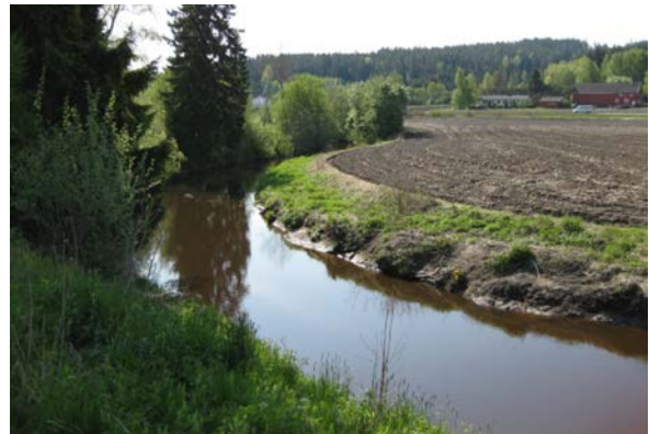
Jorda langs kanten av elver er ofte næringsrik, og derfor god matjord