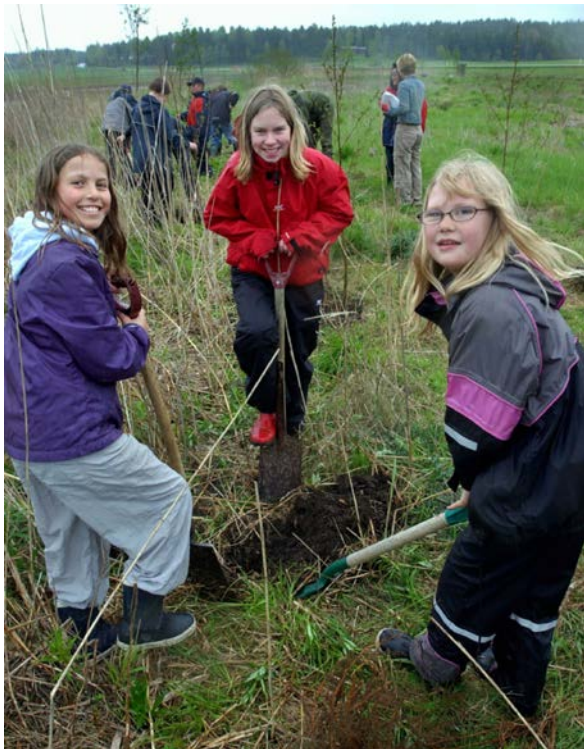
I Våler kommune i Østfold ble det arrangert treplantingsdugnader. Her er planter skolebarn trær ved Augerød.

Ulempene som ble rapportert, omfattet først og fremst at det kunne være farlig å fjerne trær som hadde falt, eller sto i fare for å falle, i elva. Dette gjaldt særlig i de større vassdragene. Noe redusert areal til matjord, trær som tok utsikt, og kvister på jordet var andre negative faktorer som ble nevnt. Kun noen få mente at ødelagt drenering var et problem, dette fordi de selv hadde plantet trærne og dermed unngikk de å plante over dreneringssystemene. Tilsvarende var skygge på åker ubetydelig, noe som igjen kan ha sammenheng med at grunneierne plantet slik at dette ikke ble et problem. Det hadde heller ikke vært problemer med økt omfang av skadedyr, ugras eller plantesykdommer.