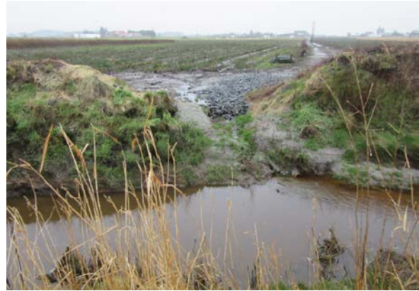
For å sikre en stabil matproduksjon blir det stadig viktigere å lede vannet bort fra åkerareal, men samtidig må vannforekomstene ivaretas. Her kunne derfor vannet fra åkeren med fordel først blitt ledet inn i en buffersone.

Hva så med bønder som selv har plantet ut trær langs med vassdrag? I Våler kommune i Østfold ble det i perioden 2001-2006 plantet om lag 10 000 trær, mesteparten av disse ble plantet i vannkanten; langs