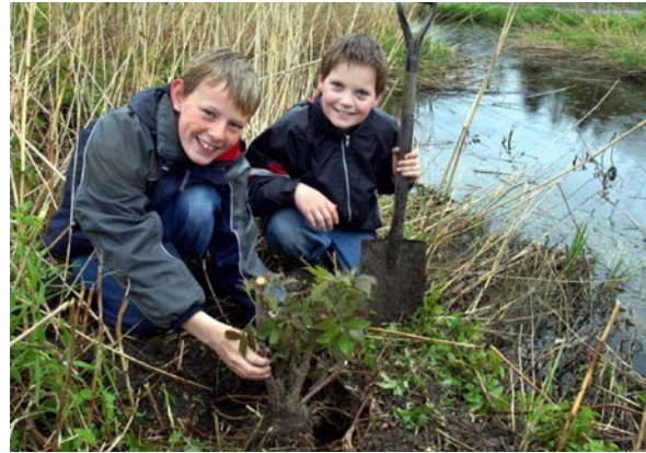
Skoleelever planter trær i vannkanten.

Erfaringene er altså vidt forskjellig avhengig av om bonden selv har bestemt hvor trærne skal stå, eller om trærne har vokst fritt. Det må også tas høyde for at bønder som selv planter trær i utgangspunktet ikke er negative til dette. I Våler spilte nok motiverende arbeid fra kommunens side en viktig rolle for å få bønder til å bli med på treplantingsprosjektet.