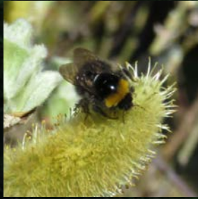
Kantvegetasjon er bra for humle og andre pollinerende insekter