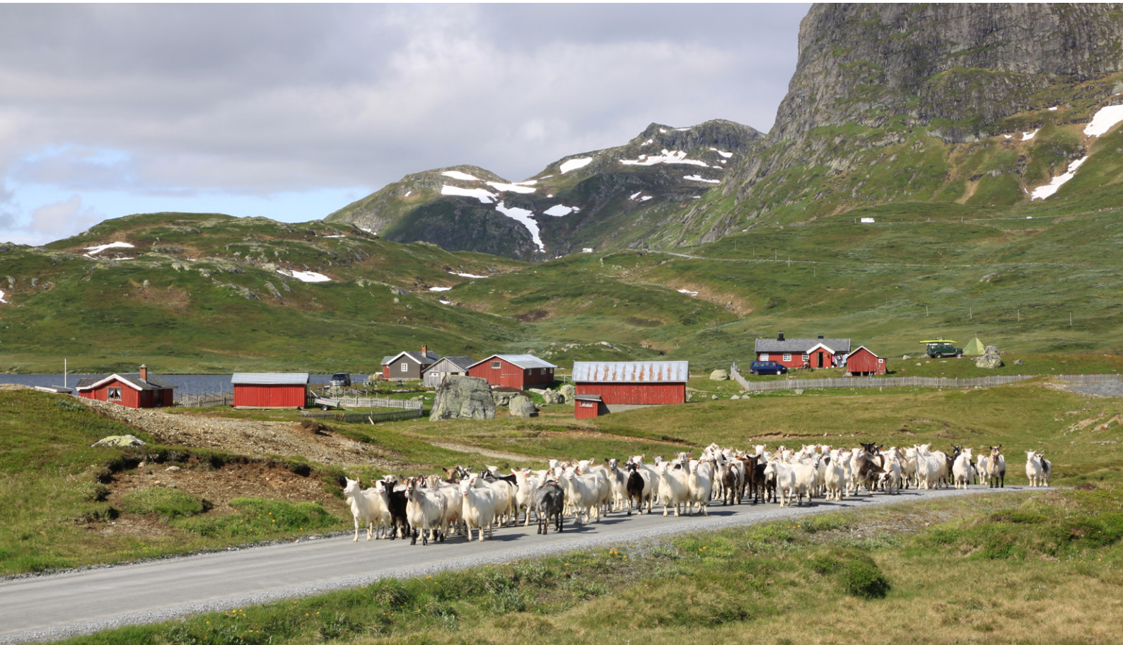
Geiter på støl i Øystre Slidre. Oppland er vårt største seterfylke, og huser 39 prosent av landets aktive setre.