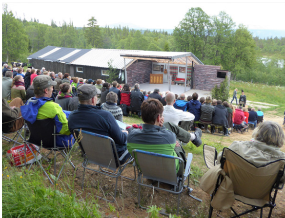
I Svarthammarlia i Tylldalen, Tynset i Hedmark, er det satt opp opera på setra hver sommer siden 2010. I 2014 sto Figaros bryllup på plakaten.