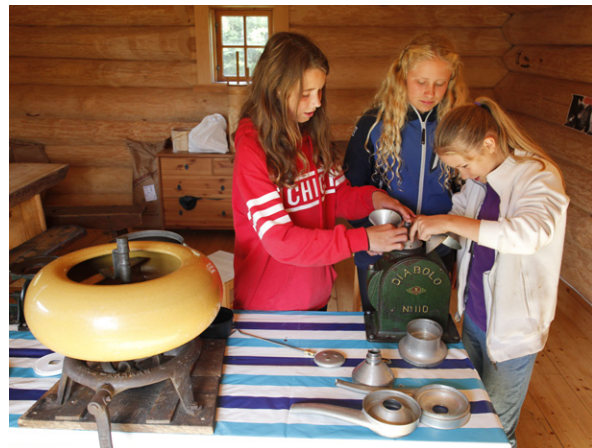
4H-setre finnes det en håndfull av rundt i landet. Her er det kursdeltagere på Nordgardsetra som monterer separator. Lardal i Vestfold 2014.