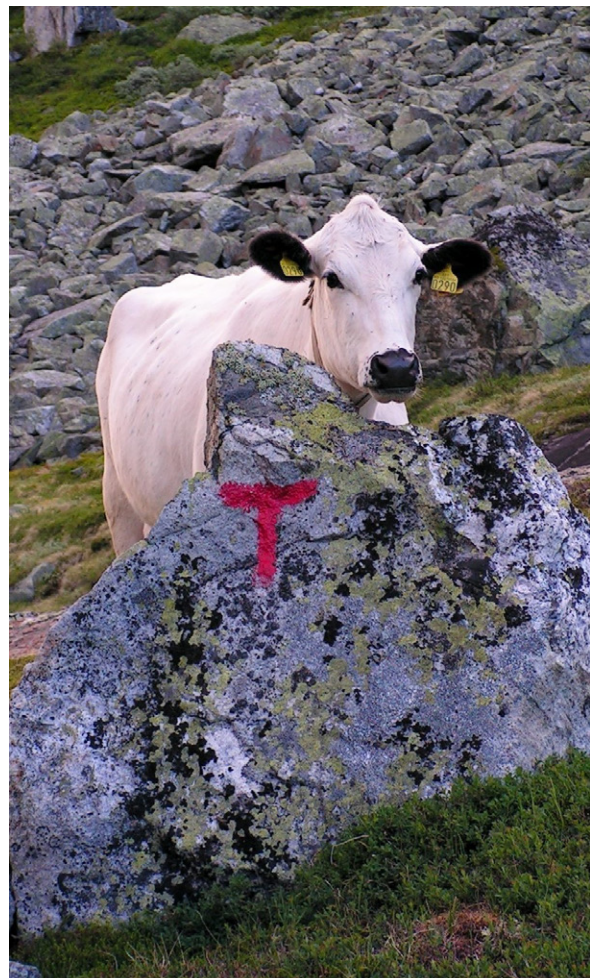
Seterlandskapet med særegne bygningsmiljøer, åpent beitelandskap, gamle stier og grusveier egnet til sykling, har mye å by på for turfolk. Treffer man på beitedyr, får turen en ekstra dimensjon.

sauesanking. Her tilbringer folk fritid og hit tar de med gjester. Det arrangeres fellesturer, byggedager og konserter. Seterlandskapet oppleves som vakkert og trivelig og har høy status også i reiselivssammenheng.