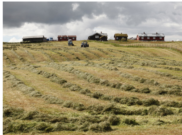
Grasavlingen på setervollen er fortsatt viktig for mange gårdsbruk. Nord-Aurdal i Oppland.

Modernisert melkeproduksjon kan også bety endringer i setermiljøene. Eldre seterfjøs må kanskje byttes ut og setertun og setervoller utvides for å få kapasitet til å ta imot større besetninger og plasskrevende teknisk utstyr.