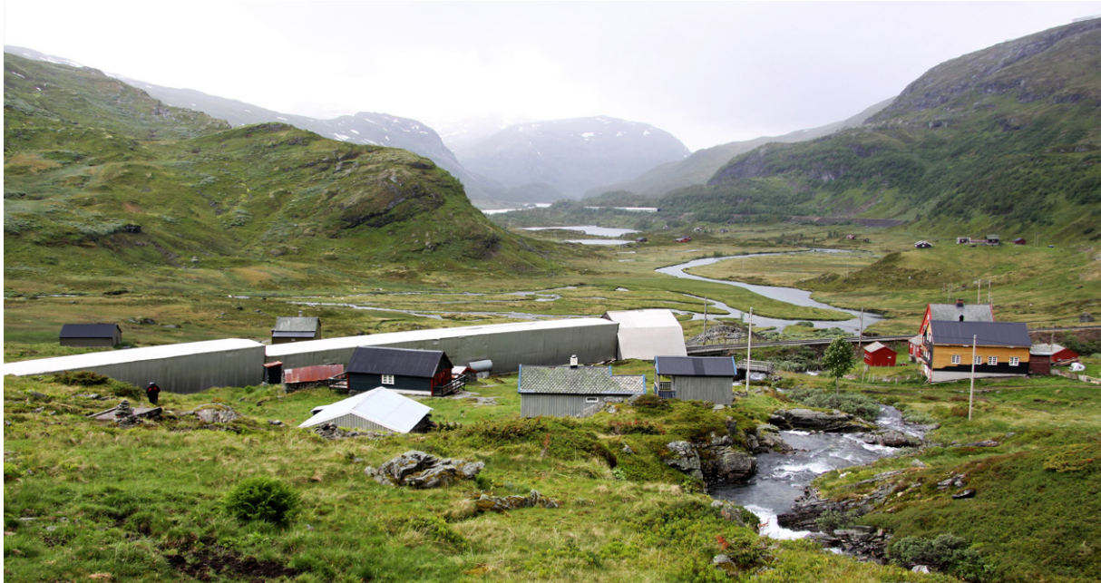
Ny bruk av utmarka har innvirkning på seterbruk og landskap. Bildet viser Gravhalstunnelen på Bergensbanen som kommer ut mellom stølshus på Vetle Upsete. Her holdt de siste stølsbrukerne på til utpå 1990-tallet.