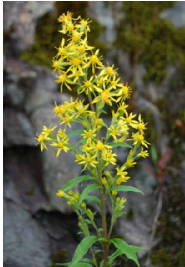
Både hvitmaure (t.v.) og gullris (t.h.) pollineres av insekter.

Ideelt sett bør frøblandinga ikke bare være norsk, men den bør også ha mest mulig lokalt opphav og slik sett være tilpassa forholda på vokseplassen. Vi snakker gjerne om 'stedegent frø', men det er ofte litt 'ullent' hva stedegenhets-begrepet innebærer. NIBIO oppformerer frø av en rekke naturengarter. Målet vårt er å oppformere regionale og mest mulig artsrike frøblandingar som blomstrer gjennom hele sesongen. Fra sesongen 2021 håper vi å kunne tilby regionale frøblandingar for Midt-Norge.