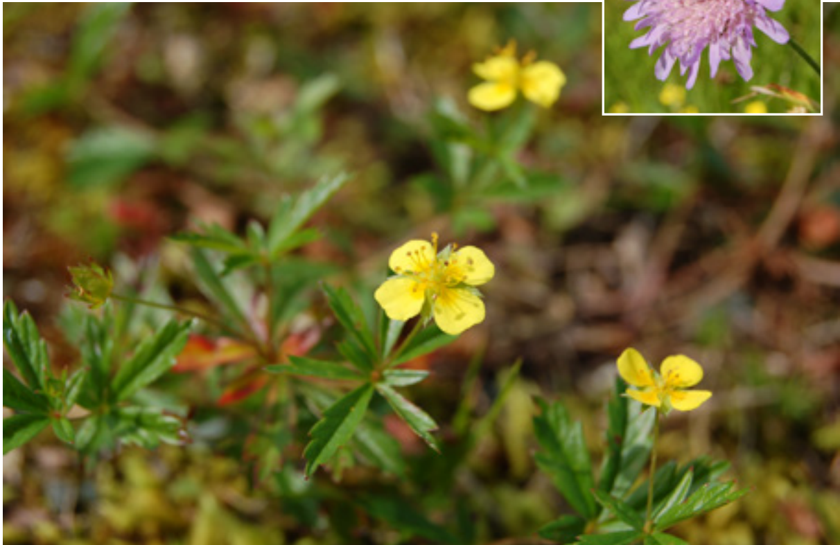
Tepperot og rødknapp (innfelt) er vanlige arter i de midtnorske slåttemarkene.