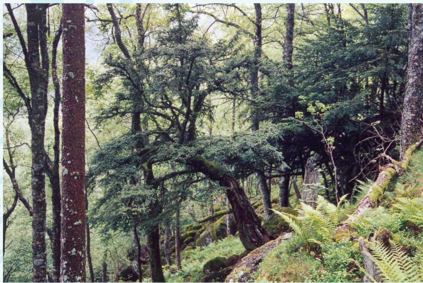
Barlind vokser ofte enkeltvis og i bratt terreng. Trærne har en litt trolsk, uregelmessig vekst og er oftest buskformete eller flerstammete.

Pollenanalyse. Noen planter har særpreget pollen. Pollen som avsettes i myrer og tjern kan beholde formen i flere tusen år. Ved å analysere prøver fra slike daterte avsetninger, kan man si noe om hva som har vokst der tidligere.