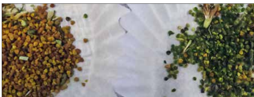
Bilde 4. Frø av umodne hoder, høstet 6. juli, som enten ble tresket samme dag som de ble høstet (grønne frø, til høyre) eller tre dagers ettermodning av hodene ved romtemperatur (gule frø, til venstre). Bilde tatt 10. juli 2018.

1 Spireevne = normale spirer + friske uspirte frø + inntil 40 harde frø