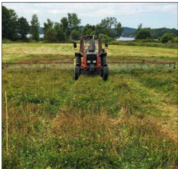
Bilde 2. Nedsviing av hvitkløverfeltet på Landvik 17. juli 2018.

det som var planlagt. Det raske modningsforløpet førte til at alle de tre behandlingene med MCPA (ledd 2-4) ble utført i løpet av ei uke (figur 1).