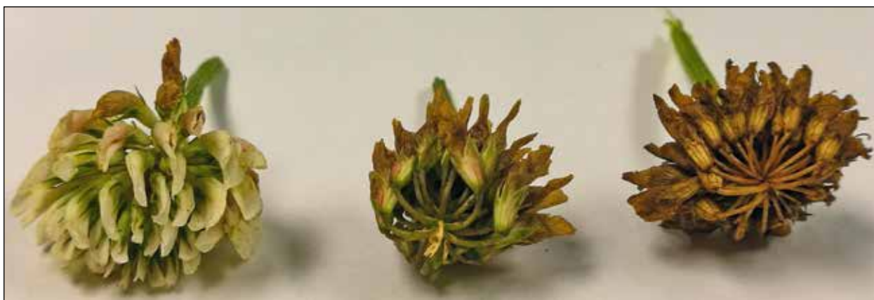
Bilde 1. Blomsterhode i full blomst (til venstre), samt nedvisna frøhoder, vurdert som enten umodent med grønne småstilker (midten) eller som modent med inntørka, brune småstilker (til høyre).

Ved hver sprøyting med MCPA ble det samla inn 100 naturlig nedvisna frøhoder med det til enhver tid gjeldende forhold mellom umodne og modne hoder (tabell 1). Dette ble gjort for å se nærmere på fargen til frøene, samt for å bestemme tusenfrøvekt og spireevnen hos grønne, gule, brune og svarte frø. De innsamla frøhodene ble tresket for hånd og frøene rensket, kategorisert etter farge og analysert for spiring og tusenfrøvekt i frølaboratoriet ved NIBIO Landvik.