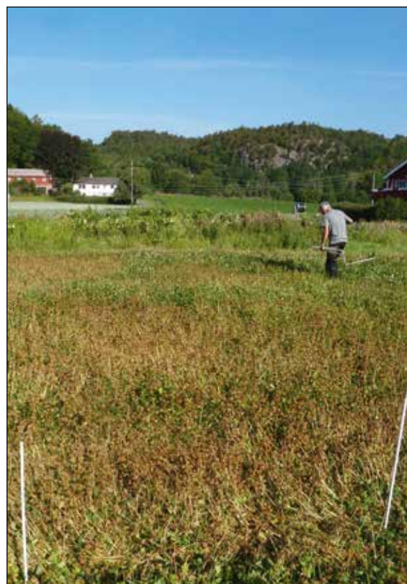
Bilde 3. Usprøyta rute (ledd 1) (t.v.) og rute sprøyta med MCPA den 6. juli (ledd 2) (t.h.). Bilde tatt 16. juli (dagen før sprøyting med Reglone).

Det at kløveren på rutene med sein eller ingen MCPA-sprøyting (ledd 1 og 4) fikk lov til å beholde bladverket intakt lenger enn på rutene som ble sprøyta tidlig (ledd 2 og 3) var tydeligvis gunstig med tanke på innlagringa i frøet, og dermed på avlingsnivået. De tyngste frøene ble da også høstet i ledd 1 og