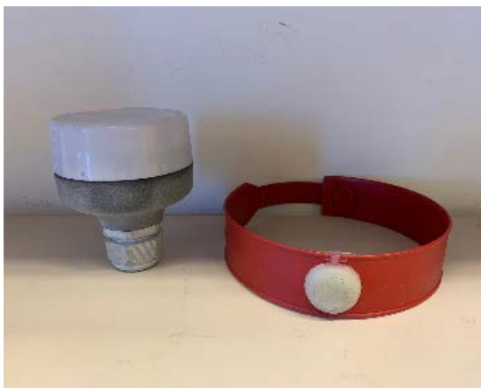
Sáddenrusttet (gurut bealde) ja vuostáiváldi (olgeš bealde).

Eurohpás lea elliidvuojáhallamat lassánan dan mañemus 40 jagis. Dasa lassín leat dat váttisvuohtan čálgoservodaga elliide ja olbmuide, mii mielddisbukta maid stuora servodatekonomalaš goluid. Dál eai gávdno makkárge teknologalaš čovdosat mat sáhttet hehttet dakkár oktiibeaškkeheamiid, earenoamážiid guovluin gos leat garra, ártkalaš dálvedálkkádagat. Dutkit leat dál hutkan ja geahččaladdan smávva energijaseastevaš rádiosáddenrusttegiid, mat leat čebabáttiid sisa heivehuvvon, ja mas lea dakkár