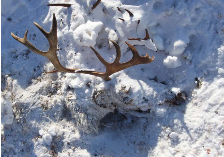
Boazu maid boraspire lea goddán.

https://www.nibio.no/prosjekter/sis-rein-drift?locationfilter=true .