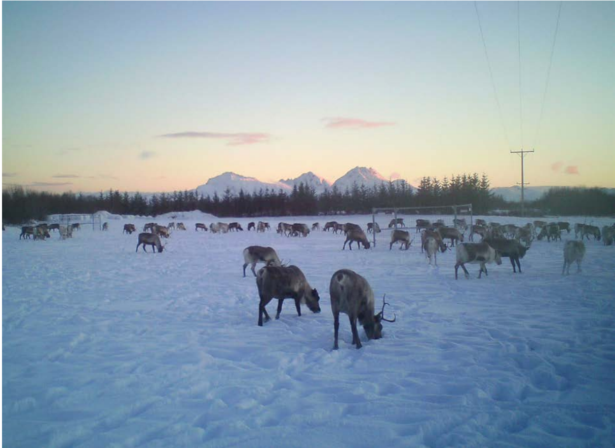
Bohccot mat guhton gittiin.

sáddet signálaid vuostáiváldi ovttaid mii lea darvehuvvon dronai gitta, vai galgá sáhttit gávdnat ja lohkat ovttaskas bohccuid ja čorragiid mat leat meahcis dahje gárddis. Mii jáhkkit maid ahte lea vejolaš ráhkadit dakkár neahttaaplikašuvnna mii sáhtta dovdat ja lohkat bohccuid stuora ealus dronagovaid ja goansta jierpmi vuodul. Mii leat ožžon dan ipmárdusa ahte ealáhusa, eiseváldiid ja dutkiid bealis hirmadit beroštit dás ja mii leat ohcan ruhtadeami iešguđetlágan proševttaide.