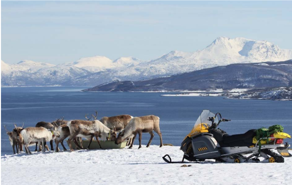
Bohccuid lassibiebman.