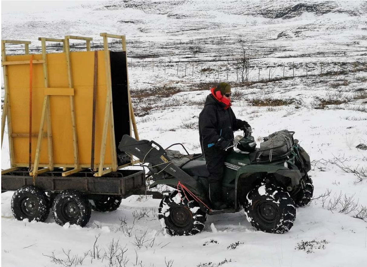
Gálvvuid fievrredeami ATV vuojániin luonddus.