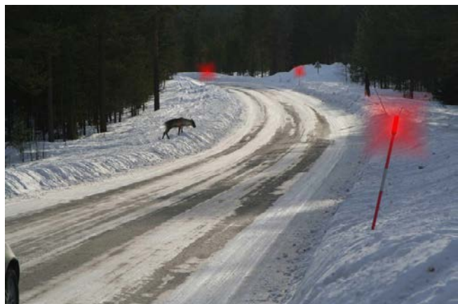
Ravkičuovga ravkigohtá go boazu lahkona geainnu. Animašuvdna: Johannes Karlsson