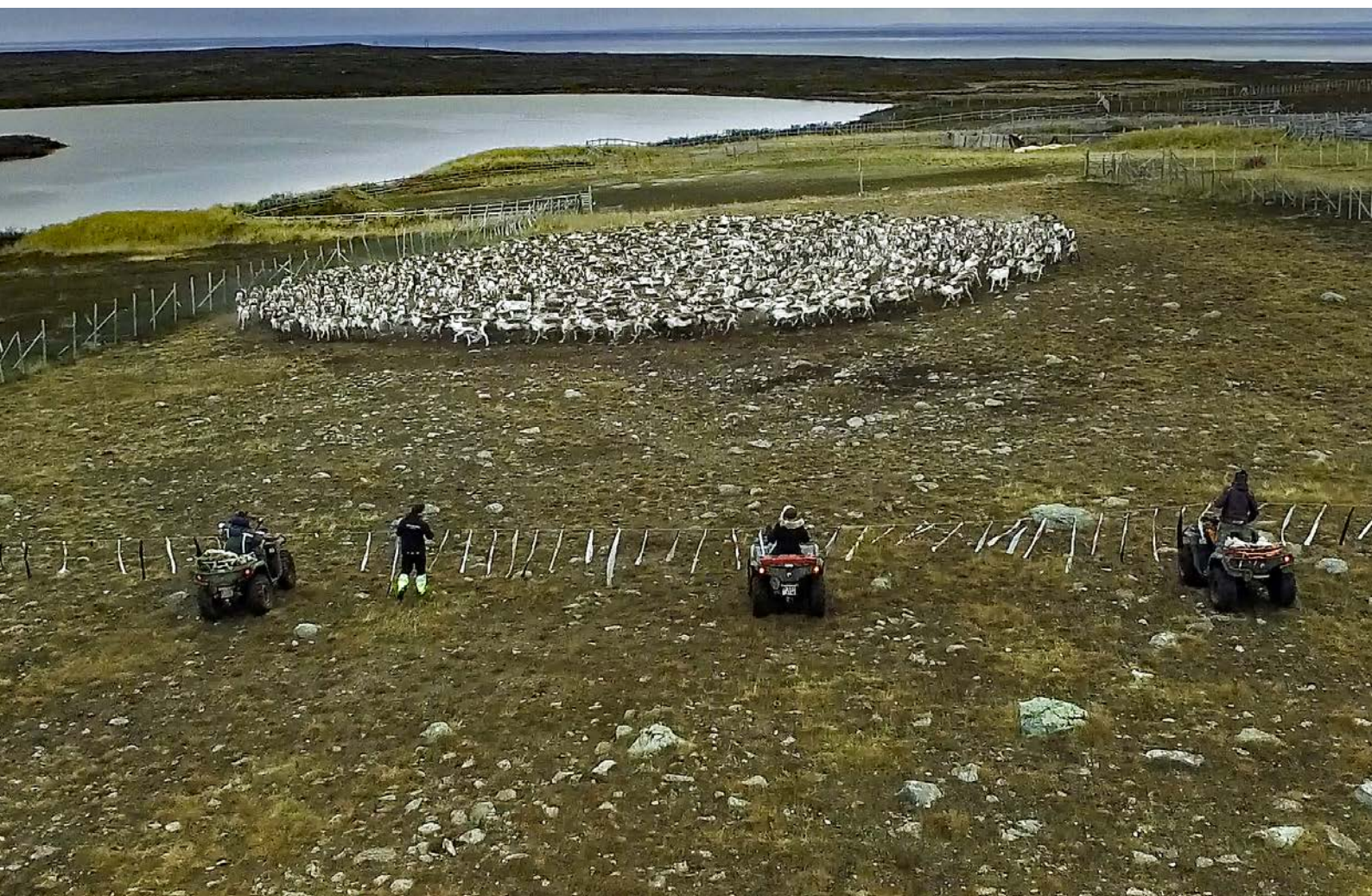
Bohccot gárddis.