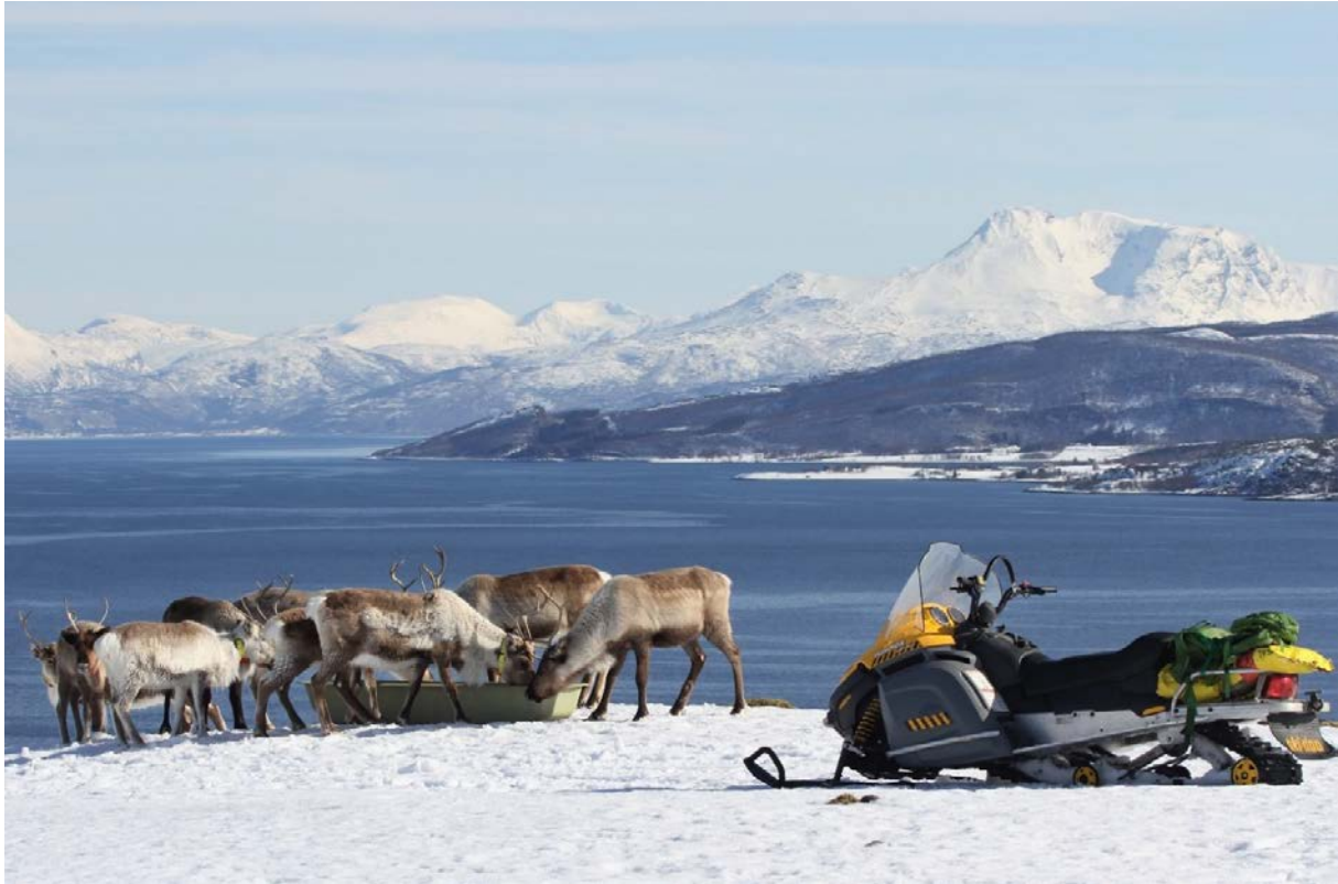
Lissiebïepmehtimmie bovtseste.