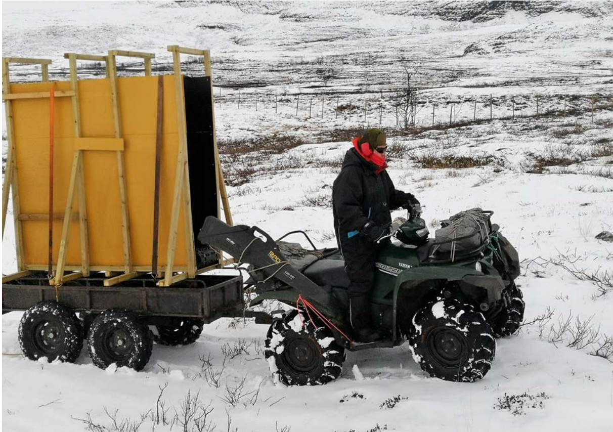
Foeresjimmie dalhketijstie ATV:ine.

takseeredh, mij aalkoelisnie lij evtiesovveme sjäärhtese, bovtse sjehtedidh jis edtja dam vielie nuhtjedh.