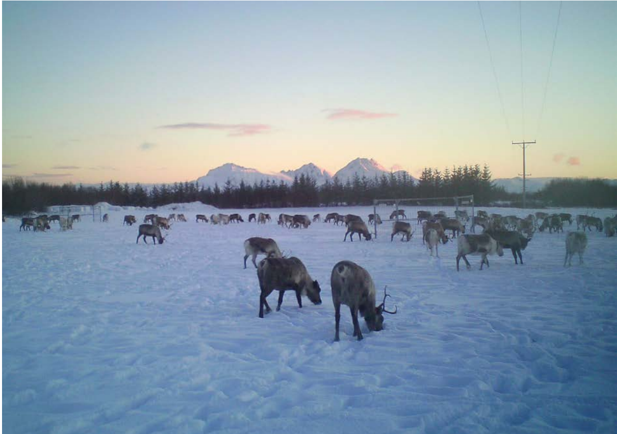
Bovtsh ientjesne gáatoeminie.

tjoeje jñh filmekamera. Akte baahkeohtsije kamera jñh sjejhme kamera ektesne maehetieh viehkine árrodh gosse edtja bovtsh gaavnedh jñh ryöknedh. Drööne maahta náhtojne árrodh gosse edtja bovtsh ryöknedh mearan tjöönghkeminié, jallh aerviedidh man gellie miesieh mah leah báateme dej jaepieboelhki gosse ij edtjh krievviem sturredh. Báetijen aejkien v.g. radiofrekvensidentifikasjovne (RFID)-seedtjijh sán maehetieh signaalh seedtedh akten dáastove-ektievoetese mij dabran aktene dröönesne juktie maehetedh gaavnedh jñh ryöknedh sáemies kreekh jallh dáehkieh kreekijste eatnamisnie jallh giedtesne. Mijjiej aaj viénhtebe nuepie lea nedteapplikasjovnem evtiedidh mij maahta bovtsh damtijidh jñh ryöknedh stoerre krievvine viehkine drööneguvvijste jñh káansteles jearmijesvoeteste. Mijjiej vuejnebe akte stoerre iedtje báatsoen, áejvieladtji jñh dotkiji luvnie jñh mijjiej beetnehvierhtiej bíjre syökeme ovmessie prosjektide.