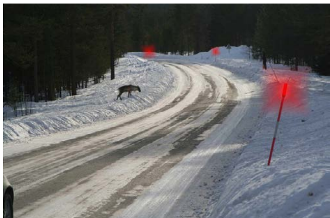
Bïeljelimmietjoevkese aalka gïjkedh gosse bovtsh geajnose geatskeneminie.