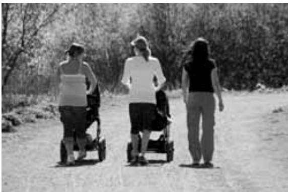
Foto 1. Respondentene i undersøkelsen var tilfeldig forbipasserende på 9 forskjellige lokaliteter fordelt på de tre studieområdene Østensjøvannet, Østmarka og Styri-marka. Østensjøvannet, Oslo.

Det er valgt å bruke kjønn og alder som viktige demografiske parametre i fremstillingen (Tabell 2). Alder og kjønn er blant de parametrene som i størst mulig grad forklarer spekteret av friluftslivets bruk og opplevelser i populasjonen (Odden 2008), men også mange andre faktorer som utdanning, sivil stand, yrke og bosted er viktig for å beskrive mangfoldet av brukerne i området. Det er samlet inn bakgrunnsvariable på utdanning, hvor langt unna friluftsområde de bor, hvor ofte de besøker skogene og om de var medlem av en eller annen frivillig organisasjon. Disse parametrene presenteres ikke systematisk i rapporten, men kommer frem der det er nødvendig underveis i resultatdelen. Det ble i tillegg til dette samlet inn informasjon om alder og kjønn for de som ikke stoppet, for å se etter evt. opplagte skjevheter i materialet. Bortfallstudiet av 17 personer er for lite til å si noe eksplisitt om bortfallet.