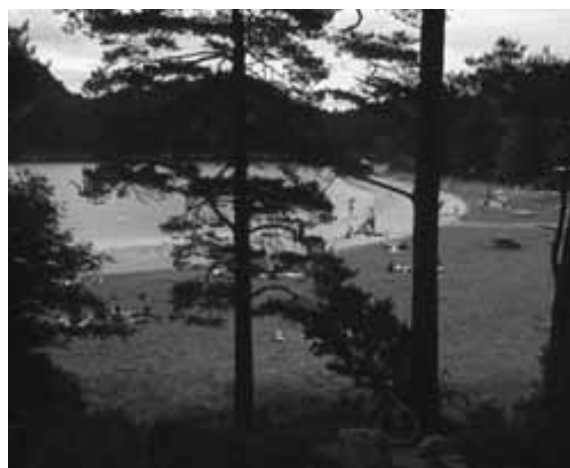
Foto 10. Viktige møteplasser i skogen kan være åpne sletter eller som i dette tilfelle en badeplass. Ofte vil ungdom i større grad benytte seg av disse områdene på kveldstid. Illustrasjonsfoto.

Noen fellestrekk ved intervjuvarene, sortert på aldersgrupper, er vist i tabell 3. Man må være varsom med å generalisere på dette grunnlaget, men det kan brukes som et idégrunnlag for oppfølgende representative spørreundersøkelser. Nasjonale brukerundersøkelser viser at alder gir sterk predikasjon på hvilke aktiviteter som gjøres i skogen og hva de besøkende ønsker av ressursen skog i sitt nærmiljø (Odden 2008). Barn er jo ikke representert i undersøkelsen, men siden familier med barn er intervjuet, kan man få en indikasjon på hvordan barn og barnefamilier bruker naturarealene. Likeledes er ungdom underrepresentert i materialet, av den enkle grunn at det var få ungdommer som passerte ute i skogen. Derfor er definisjonen av ungdom utvidet til å omfatte den yngre generasjon med alder fra 15 år og opp til 30 år. I den andre enden av aldersskalaen er de eldste flittige brukere av marka, noe som også er i tråd med nasjonal trender (Odden 2008).