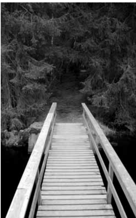
Foto 2. Tilgang og tilgjengelighet i skog ble av respondentene vurdert å være god innenfor studieområdene, og svært få ønsket flere turveger eller stier, verken i marka eller i naturområder inne i byen. Styrimarka, Eidsvoll.

De aller fleste respondentene hadde tilgang til bil, men bilen var ingen nødvendighet for å komme seg til skogene og svært få av de besøkende i Østmarka og Østensjøvannet brukte bilen for å komme på tur i skogen. Hvis bilen ble brukt var dette særlig i helgene, for å komme seg til de mer sammenhengende markaområder eller til områder med spesielle kvaliteter som for eksempel gode skiløyper om vinteren og bademuligheter om sommeren. Noen ganger satte de seg i bilen og kjørte til nye steder for å få litt variasjon. Respondenter ga inntrykk av at bilen gir en ekstra mulighet i forhold til utøvelse av friluftsliv, men var ingen nødvendighet i studieområdene.