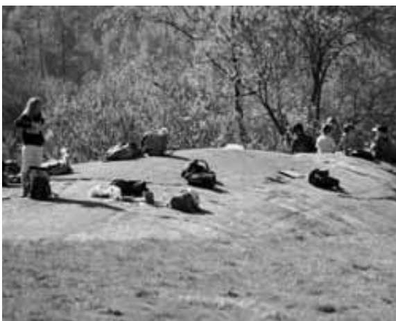
Foto 9. Flere respondenter mente det var viktig å integrere naturen i undervisningen i skoleverket, og de fleste mente at skolen i så måte hadde fått nye oppgaver og var flink til å ivareta naturkontakten i dag. Østensjøvannet, Oslo.

Noen respondenter mente at barna generelt var interesserte og glade for å lære om naturen, og jo tidligere man startet med dette, desto lettere var det å fange interessen. Det å lære om tingene rundt seg ble av mange sett på som en berikelse, spesielt det lokale dyre- og plantelivet. Det å legge forholdene til rette for aktiviteter og steder for barn i skogen ble sett på som viktige tiltak for denne gruppen. Samtidig ble det ytret ønske om ikke å innføre for mange «menneskeskapte» elementer og sterke tilretteleggingstiltak i skogen. Respondenter så at skogen hadde en viktig rolle i lokalsamfunnet. Det er derfor viktig med informasjon til brukerne av skogen, enten dette har form som en plakat om det lokale dyrelivet, eller å bruke lokalkjente som kan fortelle om natur- eller kulturhistorie.