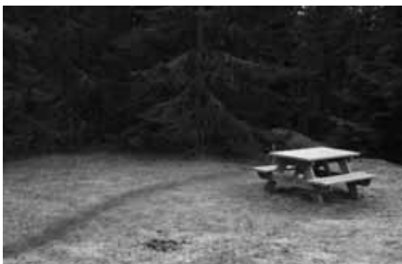
Foto 7. De fleste respondenter hevdet at de ønsket en moderat grad av tilrettelegging. Det ble spesielt etterspurert mer tilrettelegging for at barn og ungdom skal kunne bruke naturen i større grad enn de gjør i dag. I tillegg var det mange som etterspurte godt merkete skogstier med informasjon og kart. Styrmarka, Eidsvoll.

Respondentene likte godt merkete stier, fordi det var enkelt å følge og de trengte ikke bruke mye tid på å lete seg frem i terrenget. Men stiene skulle være stier og ikke utvikle seg til asfalterte sykkelveger eller grusveger. Fokuset for tilrettelegging bør, i følge de respondentene som hadde noe å si om dette, være av naturmaterialer. Diskret bruk av materialer ved skilting og informasjon, så vel som kloppegging, bruer og andre tiltak var viktig. Alle respondentene var fornøyd med både tilgang og tilgjengelighet i skogene. Men selv i godt tilrettelagte skoger skulle det alltid være muligheter for å ta en avstikker ut i større og mer fjerntliggende områder uten sti. Det ble også understreket behovet for godt tilrettelagte stier for barnevogn og rullestol.