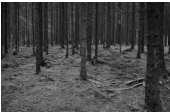
Foto 3. Respondentene kom ofte i løpet av samtalen inn på opplevelsen av å være inne i skogen, som en motsats til åpne områder på kulturmark eller i byen, ofte beskrevet visuelt og gjennom lyd og lukt. Styrimarka, Eidsvoll.

Det ble ofte nevnt opplevelser som er unike for skogene, inkludert lysets virkning gjennom trærne, lyden av trær i vind, ulike fugler og dyr i skogen, og for mange, lukten av jord og mold og fuktighet. En samlet opplevelse av mange elementer ga en helhetsfølelse av lykke og frihet ved å være i skogen. Også muligheten for å være vekke fra sivilisasjonen, var viktig for flere av respondentene. De fikk følelsen av større kontakt med naturen av å være i skogen, følelsen av å være en del av noe større.