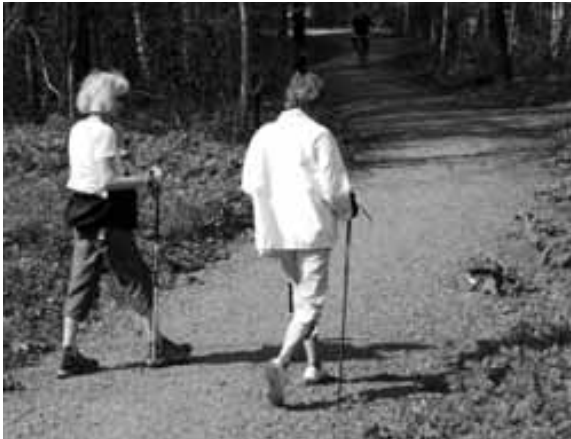
Foto 6. En del kvinner og noen eldre menn føler seg utrygge i skogen på visse steder og til visse tider, og dette påvirker når, hvor og hvordan de bruker skogene. Østensjøvannet, Oslo.

Selv om mange foretrakk å gå alene, omtalte de sikkerhet som et tema for sin bruk av skogen. Noen foretrakk å gå tur sammen med andre, eller i det minste med hunden, fordi de følte seg ukomfortable på egen hånd. De som bor mer landlig eller er oppvokst mer landlig, var mer komfortable med å gå alene i skogene. Blotting var en form for atferd som ofte ble nevnt i forhold til sikkerhet, men i samme åndedrag ble slik atferd betraktet som uskyldig. Det ble også av enkelte respondenter nevnt eksempler på tidligere voldshandlinger, som ble gjennomført for lenge siden, men som fortsatt preger stedet der handlingen skjedde. Menn derimot føler seg generelt helt trygge i skogene, og var i mindre grad preget av følelsesmessige forhold knyttet til opplevelse av frykt og sikkerhet. Det kan virke som om menn foretok mer rasjonelle vurderinger i forhold til frykt, der sannsynligheten for at noe skulle skje er minimale. En annen mulighet kan være at menn snakker mindre om frykt.