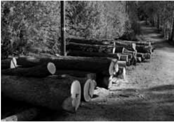
Foto 5. De fleste brukere aksepterer skogbruk som en næringsaktivitet, men mange har formeninger om hvordan driften av skogen bør være for å ta mest mulig hensyn til annen bruk av arealene. Rustadsaga, Oslo Østmark.

Noen påpekte at de hadde sett hogstflater fra fly eller fra kartkilder som Google Earth. Her kunne de på en enkel måte se fragmenteringen av skoglandskapet som følge av hogst og skogkultur. De aller fleste mente at tømmerhogst var nødvendig for å gi inntekter til skogeier og at det hadde ringvirkninger ellers i samfunnet. Fire respondenter pekte på at mekaniseringen i skogbruket var skyld i fragmenteringen, og at store maskiner ga store hogster.