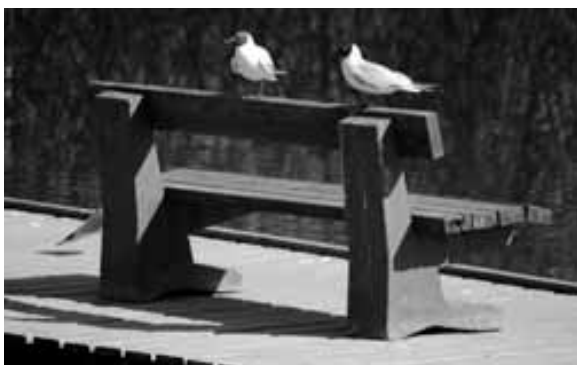
Foto 8. Skogen som en sosial arena har stor betydning for mange av respondentene. Intervjuene viser at mange er vanemennesker og bruker de samme områdene om og om igjen, og overfører tradisjoner til neste generasjon. Østensjøvannet, Oslo.

være forhold knyttet til tilretteleggingstiltak av ulik grad og karakter, samt at vernede skoger ofte blir oppfattet som rotete skoger.