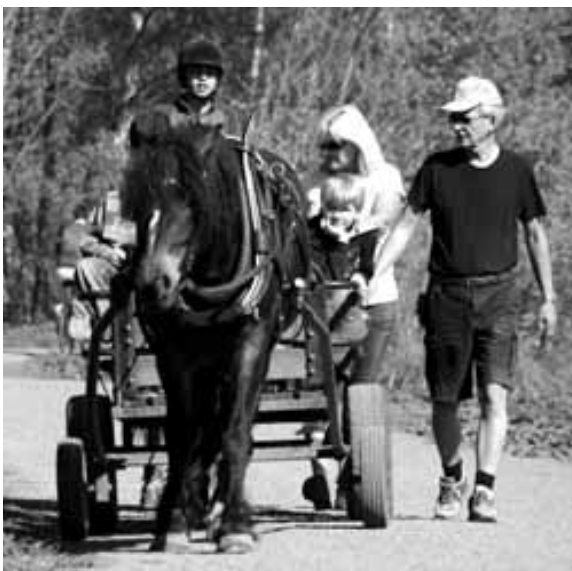
Foto 11. Klassiske studier har vært opptatt av å kartlegge atferden til brukerne, hvem, hva og hvor folk gjør de ulike aktivitetene, mens den viktigste underliggende årsaken til bruken ofte er å finne i folks behov for mental restaurering i form av å hente krefter og komme seg igjen etter stress, sykdom eller atferdsproblemer. Østensjøvannet, Oslo.

minner, konkrete opplevelser og meninger fra steder i skogen, som gir hvert enkelt sted en helt spesiell identitet. Selv om stedets betydning i skog har vært forskningstema (f. eks. begrep som genus loci , place attachment , sense of place , favorite place ) de siste tiårene, er det fortsatt begrenset med kunnskap om stedets betydning for individet (Sack 1992, Patterson & Williams 1998, Cheng m.fl. 2003, Aasetre & Gundersen 2007). Materialet viser at beskrivelser som faller inn under det som kan benevnes som individets velvære , i første rekke er knyttet til en generell opplevelse eller følelse som folk uttrykker når de skildrer hvilken betydning skogen har i deres egne liv. Alt i alt viser undersøkelsen at det er sammensatte verdier forbundet med bruk og opplevelse av skog. De besøkende bruker arealene forskjellig, har forskjellige verdier, men felles for alle er at skogene er viktige, at de bryr seg om dem og ønsker å forbedre og ta vare på dem. Naturmiljøer er ikke bare fysiske lokaliteter for respondentene, men også minner, erfaringer og opplevelser som skaper engasjement og meninger om stedet. Sammenhengen mellom folk og sted er personlig og det er gjennom bruken at folk har tilhørighet til bestemte steder i skogen. Skogens symbolske verdier har derfor ofte en forankring i en estetisk opplevelse av natur, enten dette er positive eller negative erfaringer.