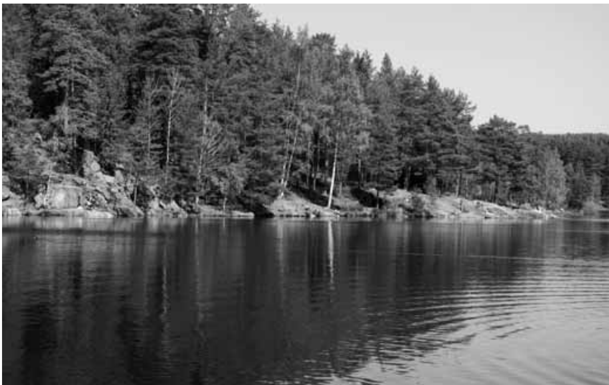
Foto 12. Skogene ble av mange verdsatt for å få et avbrekk fra dageliv og for å kunne trekke seg tilbake fra et ofte stressende arbeidsliv. Bildet viser hvordan folk utnytter plassen langs vannkanten til å finne seg hver sin lille idyll og stillhet ved Nøklevann, Oslo Østmark.

samt høstingsaktiviteter som fiske- og bærtur. Odden (2008) viser videre at de som har vært mye på tur i barndommen ofte fortsetter med dette når de blir voksne. Læringsfaktoren er vesentlig for hvor aktiv friluftsbruker man er. Resultatene fra intervjuene ved Østensjøvannet viser at de fleste voksne vil at barna skal bruke skogene ofte, men at de samtidig ikke ønsker å sende barna til skogen uten at de selv er til stede eller at andre voksne passer på. Selv om man som barn lekte alene i skogen uten tilsyn av voksne, har det altså skjedd en mentalitetsendring siden den gang. Dette handler om forskjellen mellom reell og opplevd sikkerhet. Det har vært kriminelle handlinger i studieområdene som har fått store oppslag i media. Fortetting medfører større befolkningkonsentrasjoner og kan føre til et mer uoversiktlig nærmiljø når det gjelder kriminalitet og trafikk. Odden (2008) peker også på at de unge har et mye større fritidstilbud i dag enn det som var tilfelle på 1970-tallet. Det er vanligere i dag at foreldre er ute i jobb og har mindre tid til å være sammen med barna på dag- og kveldstid. Dette har konsekvenser for barn og ungdoms bruk av natur, der bruken er mer organisert og planlagt i dag enn den var på 1970-tallet. I en slik situasjon blir barnehage og skole spesielt viktige institusjoner for å innarbeide gode friluftsvaner, fordi barn bruker så mye av tiden sin her.