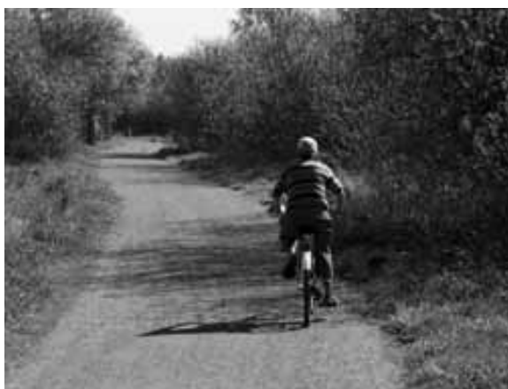
Foto 4. Naturen blir av mange brukt som en viktig treningsarena, og særlig eldre brukere hadde behov for lett tilgang til naturarealer. Bildet viser mannens første ustø sykkeltur etter omfattende hjerteoperasjon.

For noen ble det et rent pliktlop å komme seg ut på tur, og de var ikke så opptatt av selve naturopplevelsen. Det var eksempler blant respondentene at sykdom ble startskuddet for at de begynte å gå tur i skogen. Spesielt var det mange nye brukere blant de eldre, som også fikk bedre tid til å gå tur enn da de arbeidet. Nye eldre brukere tar stadig i bruk skogen, brukere som ikke var så aktive i skogen før de ble syke. Respondentene var stort sett enige i at det er bedre å gå en tur i skogen enn nede i byen. Det var jo også bare de som gikk tur i skogen som ble intervjuet. Det ble også av noen fremhevet forde-