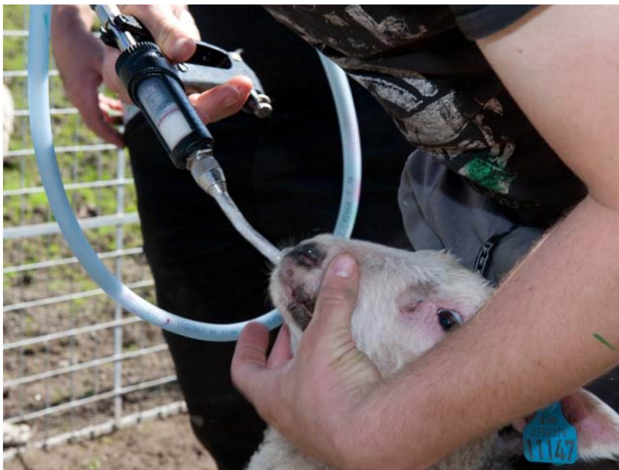
Dei viktigste førebyggjande tiltaka mot parasittangrep på sau er friske dyr, lav dyretetthet, riktig fôring, godt beite, skifte av beite og godt innemiljø. Her vert eit lam med munnskurv behandla mot parasittar.

område der sau har gått året før eller i vinterperioden. Koksidiar kan også opptre innandørs, særleg ved lang innefôringsperiode, og ved fuktige og skitne liggeareal. Symptoma er blodig diarè (svært mørk avføring), uttørring og i verste fall død.