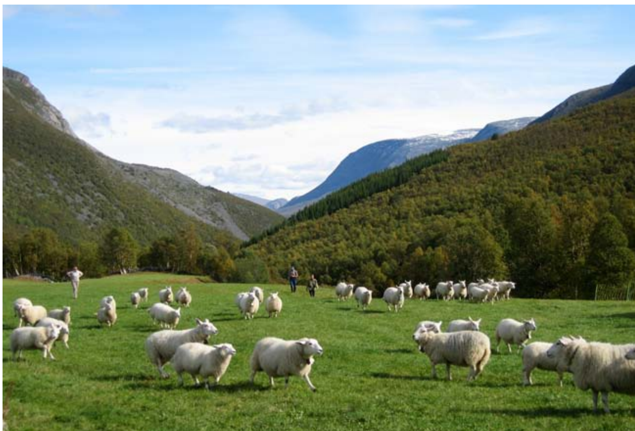
På veg til nye beiteområder.

Kulturbeite kan og nyttas til haustbeite, men dei bør pussast i løpet av sommaren slik at dei ikkje gror igjen til haustbeitinga. Best utnytting av kulturbeite får ein dersom andre dyreslag kan beite det om sommaren.