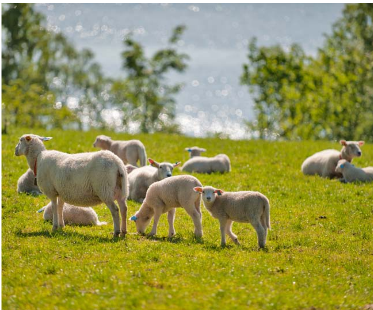
Skifte av beite er eit godt tiltak for å førebyggje parasittangrep.

Du treng ikkje like mange avføringsprøver kvart år, men gjer det eitt eller to år for å få oversikt over parasittmitten i besetninga.