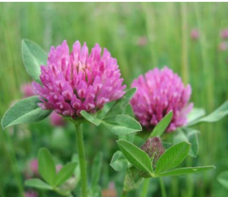
Kløver aukar grasavlingane og proteininnhaldet, og gir god smak på grovfôret.

I praksis viser det seg at graset på mange økologiske sauebruk har negativ PBV, og dette gir problem med lavt proteininnhold i grovfôret. Det er då viktig å syte for nok protein frå andre fôrmidlar.