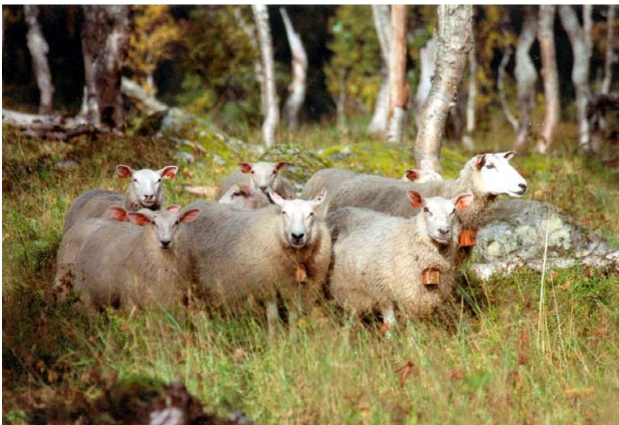
Norsk kvit sau på skogsbeite.

Spælsauen beiter i større grad saman i større flokkar enn dei andre rasane. Dette kan vere ein fordel ved sanking av sau frå fjell og utmark om hausten. Å beite i store flokkar kan også vere ein fordel i rovdyrutsette område. Vaksne søyer veg omlag 70 kg. Dei har gode morsegenskapar, er fruktbare og har mindre variasjon i lammetalet, med ein større del tvillinglam enn hos andre rasar med samme lammetal. Kjøttfyllden er derimot mindre enn hos NKS.