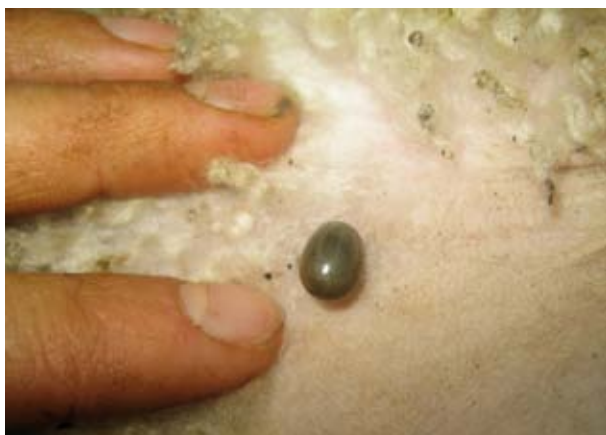
Ein flått har suga seg full av blod.

Sjodogg gir høg feber. Hovudproblemet er at immunforsvaret vert svekka og dermed fare for sekundærinfeksjonar som til dømes blodforgifting og leddbetennelse. Sjuke lam som ikkje døyr, kan få svært låg tilvekst. Drektige søyer kan abortere og vêrar kan bli sterile. Smitte kan skje i heile beiteperioden, både på innmark- og utmarksbeite. Det kan vere store variasjonar i høve til kor det er mykje eller lite flått.