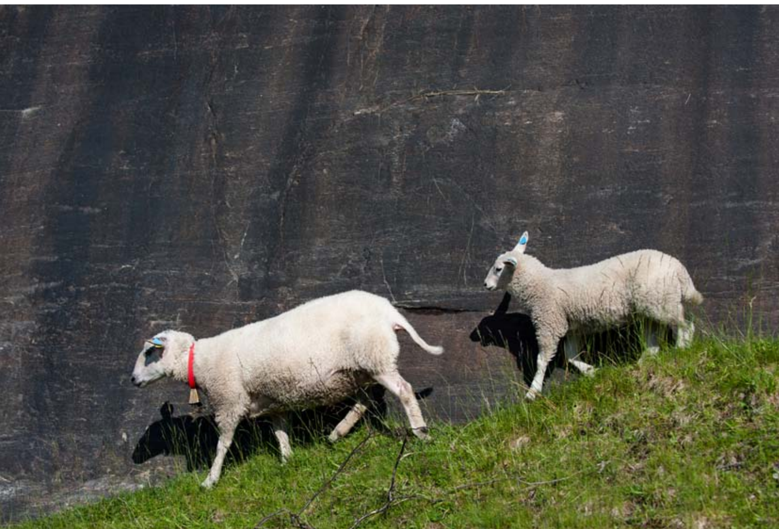
På heimveg.