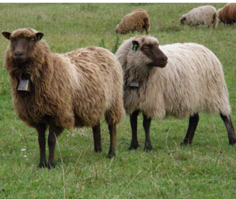
Gamalnorsk spæl.