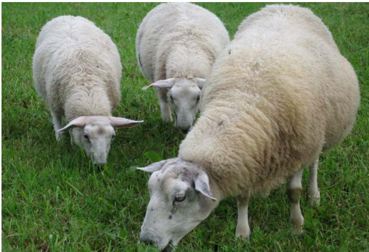
Godt vårbeite er viktig for lammetilveksten.

Godt vårbeite er spesielt viktig for tilveksten på lamma, då det er i denne perioden grunnlaget for god kjøttutvikling på lamma blir lagt. Søyer med lam bør ut på beite så raskt som mogleg og innan to til tre veker etter lamming. Vårbeite skal vera i god vekst når sauen blir sleppt ut, det vil seie at beitegraset er frå 5-7 cm høgt. Ei NKS-søye med to lam vil eta omtrent tre kg tørrstoff på beite. For å dekke dette fôrkravet, bør ein i økologisk drift ha 0,9-1,3 daa vårbeite per søye med to lam som skal beite i to veker. Beitetrykket bør vera slik at grasen på vårbeitet held seg på 5-7 cm gjennom vårbeiteperioden. Ein bør vurdere å bruke fulldyrka eng til vårbeite sjølv om det kan redusere grovfôrproduksjonen