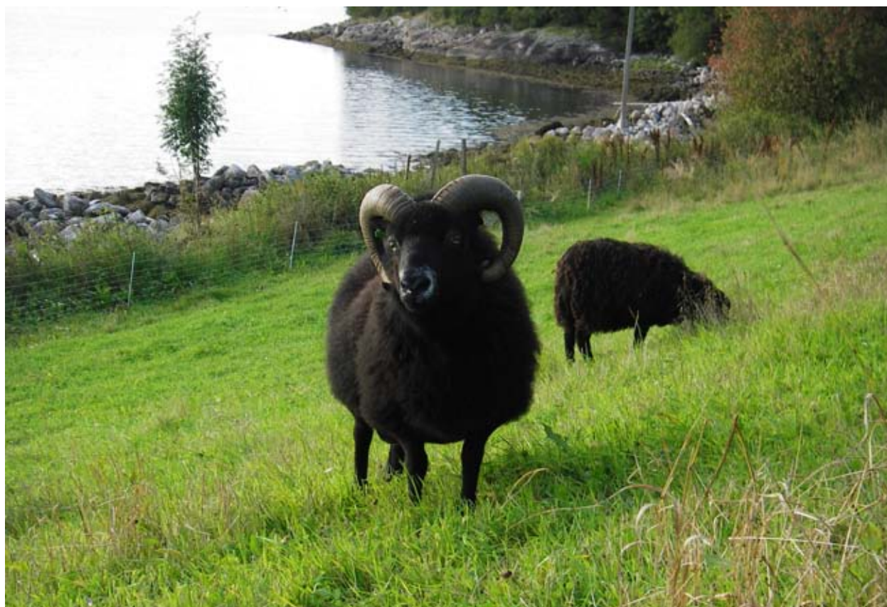
Vær av gammalnorsk sau.

Lamma hentar mesteparten av fôret sitt gjennom mjølk frå mora og beite frå innmark og utmark. Ved fødselen har lammet relativt stor løypemage og lita vom. Lammet treng difor tid til å utvikla vomma og den mikrobielle fordøyelsen. I starten er lammet heilt avhengig av å få høgverdige næringsemne som morsmjølk eller mjølkeerstatning for å få nok næring. Dersom lam i økologiske saueflokke får mjølkeerstatning, blir lammet konvensjonelt (sjå kapittel «Fôring og fôrmidlar»). Lammet må få råmjølk så snart som mogleg og seinast fire til fem timar etter fødselen på grunn av at råmjølka inneheld immunstoff som lammet er avhengig av. Evna til å ta opp immunstoff frå råmjølka avtek raskt etter fødselen.