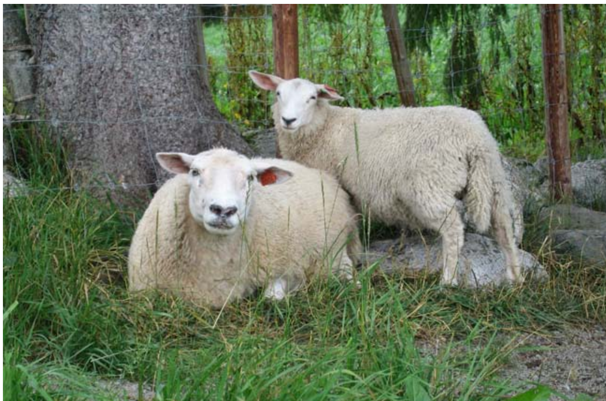
Fôrbehovet til søya aukar mykje dersom lammet skal ha god tilvekst.

Grovfôroptaket vil gå opp etter lamming fordi fostret ikkje tek plass i bukhola og vomma vil utvide seg. Høg produksjon stimulerer også til høgt fôroptak.