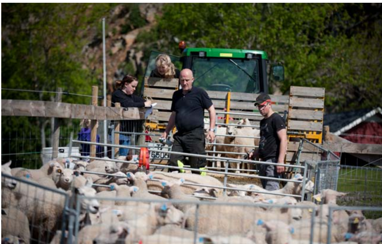
Klargjering til sommerbeite på fjellet.

til vinterfôr. Har ein kulturbeite til disposisjon, er dette eit godt alternativ. Ein treng då 25 % meir areal per søye med lam samanlikna med fulldyrka eng.