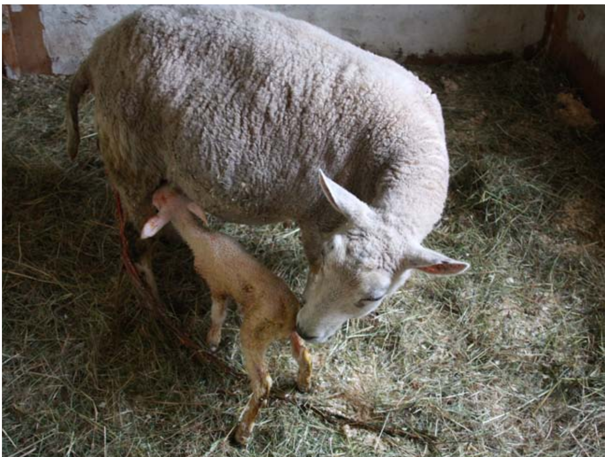
Nyfødd lam har funne råmjølka.

Utviklinga av drøvtyggjarmagen skjer gradvis og blir påverka av kva fôr ein gjev lammet. Tidleg tilgang på kraftfôr eller ungt beitegras gjer at vomgjæringa kjem i gang. Dersom eit lam berre får tilgang til mjølk eller mjølkeerstatning, vil utviklinga av vomma bli hemma. Ved å stimulere til ei tidleg utvikling av vomma, kan lammet utvikle seg til å bli ein drøvtyggar alt ved tre til fire vekers alder. Vomma vil vera fullt utvikla etter om lag åtte veker.