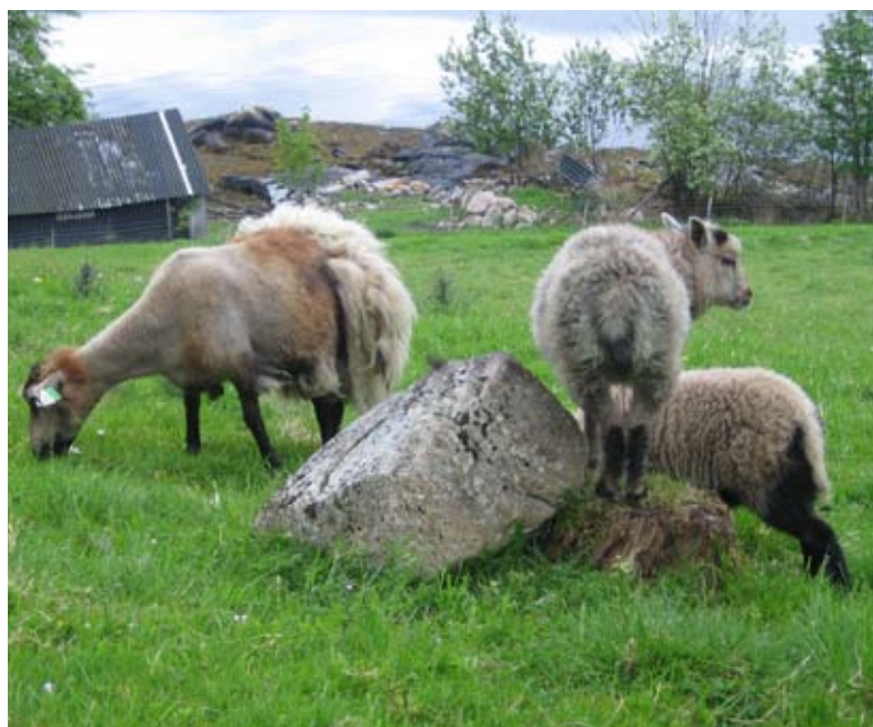
Gamalnorsk søye som slepp ulla.