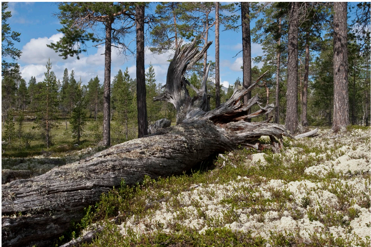
Målinger fra Landsskogstakseringen viser at det blir stadig mer død ved i Norge.