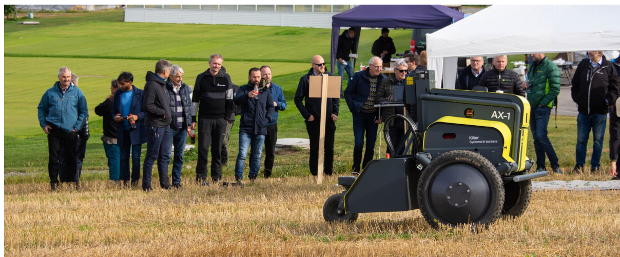
Demonstrasjon av ugrasrobot under teknologidagen på Apelsvoll.

Antall faglige årsverk per rene administrative årsverk utgjorde 6,2 for 2021. Dette er på samme nivå som i 2020.