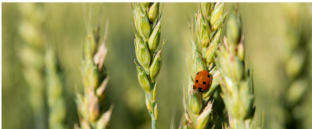
Kunnskapen om integrert plantevern har økt siden 2015.

Etableringen av NIBIO i 2015 ble ekstra krevende fordi man i de første årene måtte bruke mye ressurser og oppmerksomhet på interne forhold. Dette gikk i noen grad ut over samfunnsoppdraget og kapasiteten til å bygge og videreutvikle det nye instituttet. Dette til tross, NIBIO er i dag et betydelig sterkere og mer effektivt institutt enn hva vi var ved etableringen for seks år siden.