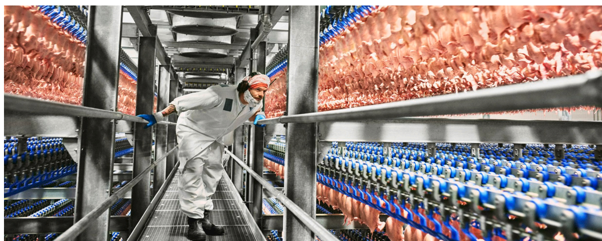
Norge eksporterer og importerer mer mat enn noen gang.