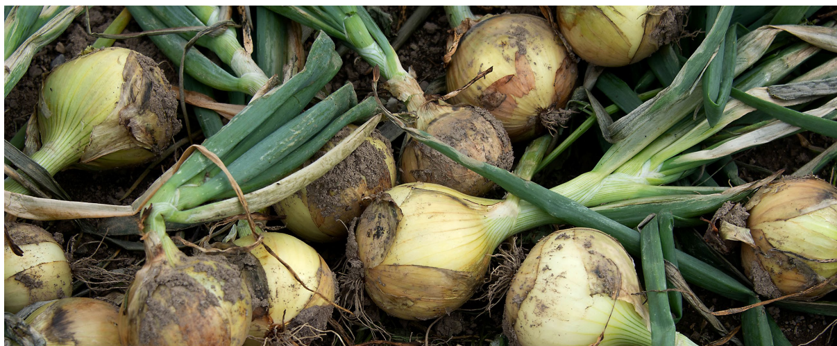
Løk er den tredje mest brukte grønnsaken i Norge.