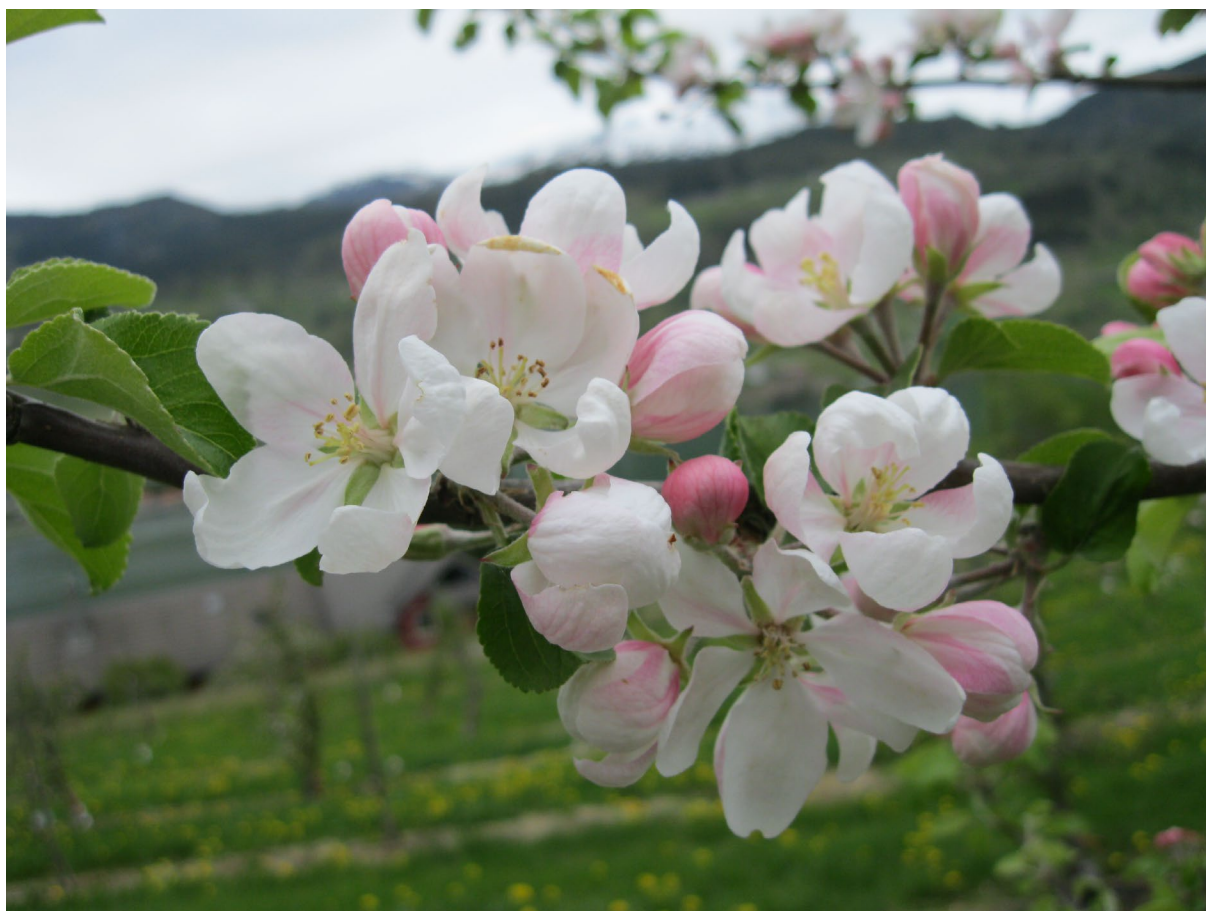
Fruktblomstring i Hardanger.