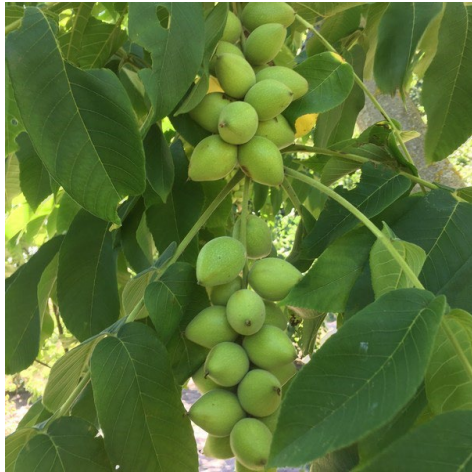
Figur 8 Kart av CW3.