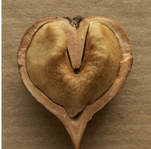
Figur 10 'Kalmar'. Trykt med løyve frå Westergaard Planteskole, Danmark