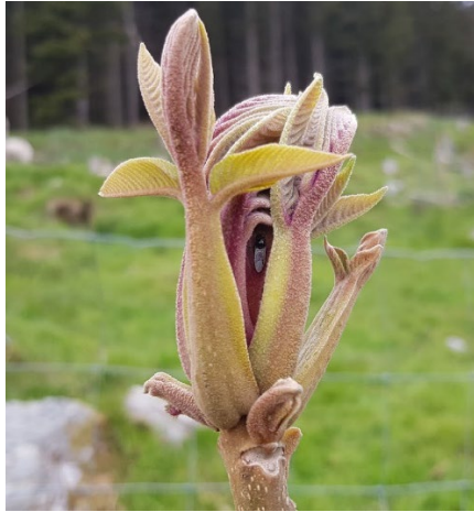
Figur 1 Ungt skot på hjartenøtt før danning av klorofyll.

Som med mest alle treslag, er det skilnad på blad som veks i skuggen og i sola. Blada i skuggen og nedre del av kruna vert breiare, flatare og tynnare, medan blad i øvre halvdel av kruna ofte er smalare og tjukkare med forsterka kutikula (vokslag). Desse skilnadane ser ein oftast i eldre tre.