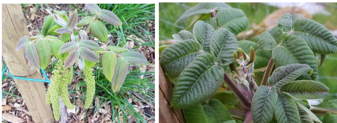
Figur 3 og 4 Hjartenøttbløming: Hannraklar t.v. og hobloamar t.h.

For å maksimere blømingsoverlappinga og nøttesettinga, må ein planta minst to sortar saman som har lik blømingstid for dei respektive mannlege og kvinnelege blømane.