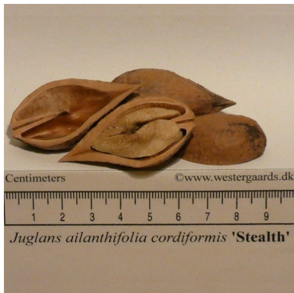
Figur 9 'Stealth'.