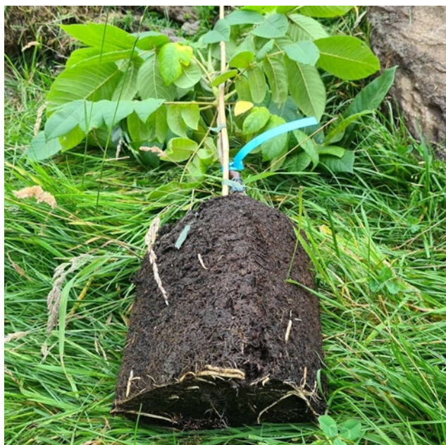
Figur 5 Utplantingsklar hjartenøttplante.

Det skal vera minimum 5 cm frå jordoverflata til podestaden – gjerne meir. Vekstreduksjonen i treet aukar i regelen med aukande avstand frå jordoverflata til podestaden. Difor er det viktig å få planter med høg nok podestad.