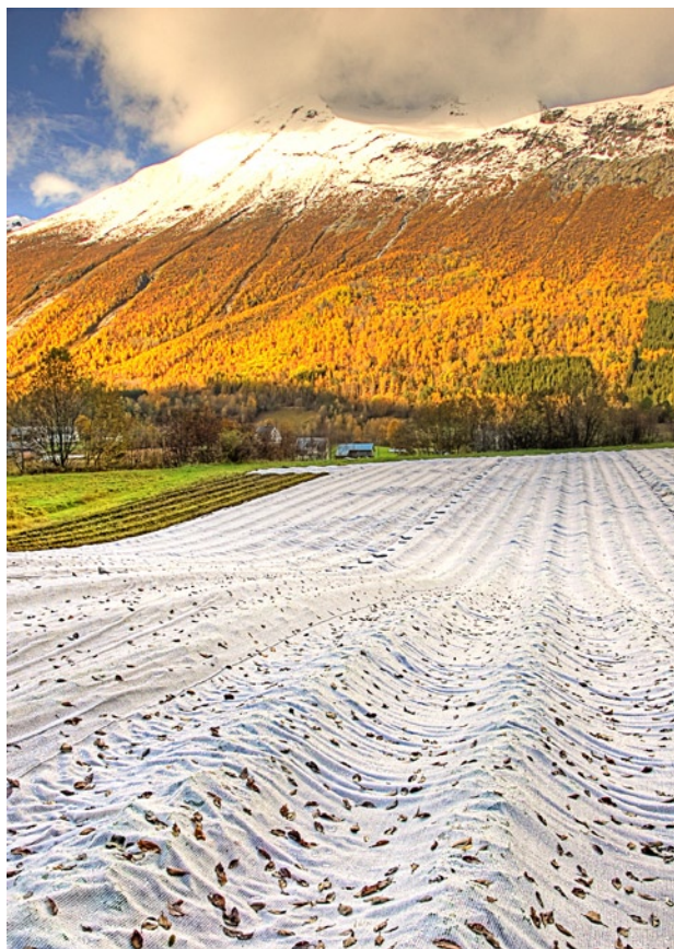
Figur 1. Jordbærfelt i Valldal dekket med Agrocover.

Mest vanlig er fiberduk av ulike kvaliteter fra 15 til 23 g/m 2 . Den tynneste er billig og lett å arbeide med, men tåler også mindre håndtering, tråkk og lignende. Til vinterdekking er det en fordel å bruke den kraftigste duken. Til dekking vår og sommer er den tynne bedre fordi den slipper gjennom mer lys. Den vevd duken er om lag tre ganger så dyr som den billigste fiberduken, men vevd duk er mye sterkere, den tåler tråkk av elg, hjort og rådyr og den er mye mer holdbar. Vevd duk ligger ganske rolig i vind, men er derimot tyngre å arbeide med. Insektnett er også dyr og tyngre å arbeide med sammenlignet med fiberduk. Insektnett ligner fluenetting og formålet er å holde ute insekter, men vil også gi et litt lunere mikroklima.