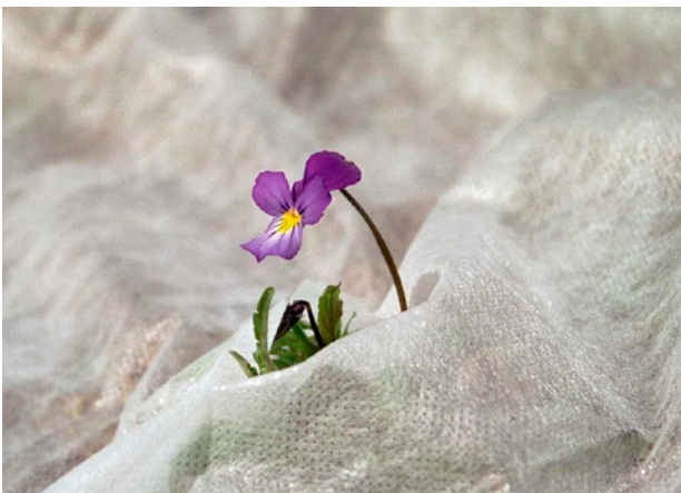
Figur 5. Stemoderlig behandla? Nei, ugraset trives godt under fiberduken.

BIOFORSK TEMA vol 5 nr 5 ISBN: 978-82-17-00642-8 ISSN 0809-8654 Fagredaktør: Rolf Nestby Ansvarlig redaktør: Forskningsdirektør Nils Vagstad