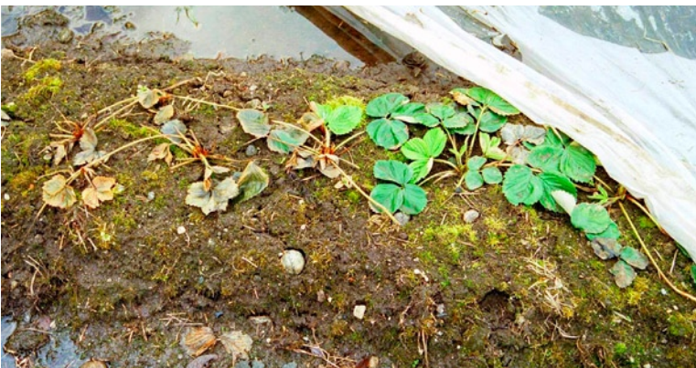
Figur 3. Planter som har vært dekket over vinteren er grønne, mens udekkede planter er brune p g a vinterskade. Også udekkede planter overlevde, men hadde sterkt redusert vekst i forhold til dekkede planter.

Knopper og blomster hos jordbær tåler svært lite frost, og kan få skade ved lufttemperatur under -2\text{ }^{\circ}\text{C} . I enkelte område og enkelte år kan frost i blomsten gjøre stor skade i jordbær. Det er særlig ved klarvær og stor utstråling at det er fare for nattefrost som kan gjøre skade på jordbærblomsten, verst er det i områder som ligger lavt i terrenget. Også mot blomsterfrost er dekking med duk effektivt. Ett lag fiberduk hever minimumstemperaturen med 0,5\text{-}5,5\text{ }^{\circ}\text{C} i klare netter. Dekking av større arealer er arbeidskrevende og må skje i god tid dersom det er fare for frost.