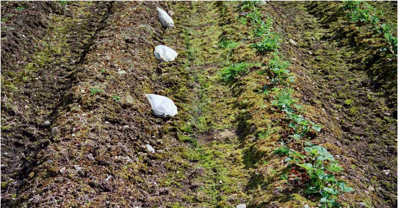
Figur 5. Plantene til høyre har vært dekket med fiberduk over vinteren og er grønne og frådige, mens udekkede planter til venstre er brune og nesten vekke etter vinteren.