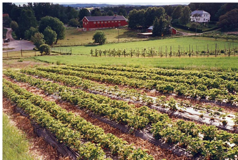
Figur 2. Bilde fra sortsfelt på Ås. Dobbeltrad nummer 3 er Elsanta. Den delen av rada som er lengst til venstre i bildet har vært dekket med fiberduk over vinteren. I høyre del av bildet kan vi se at udekket Elsanta har fått sterke vinterskader, mens det ikke er synlig skade på de andre sortene.