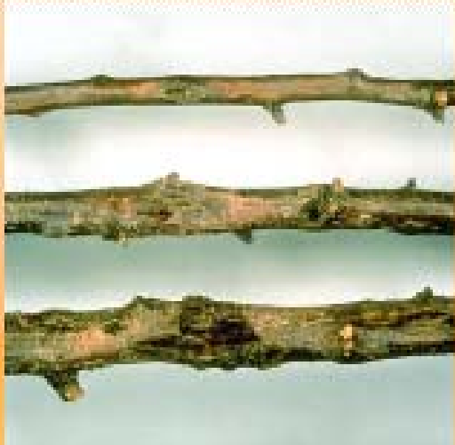
Cankers on three plum branches ( P. domestica cv. Calita). U. Mazzucchi, Università degli Studi, Bologna (IT).