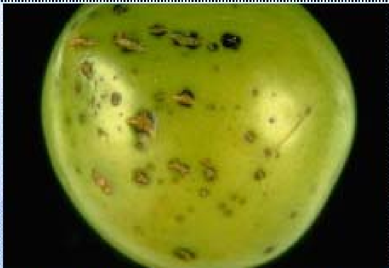
Spots on a plum fruit ( Prunus domestica cv. Shiro). U. Mazzucchi, Università degli Studi, Bologna (IT).