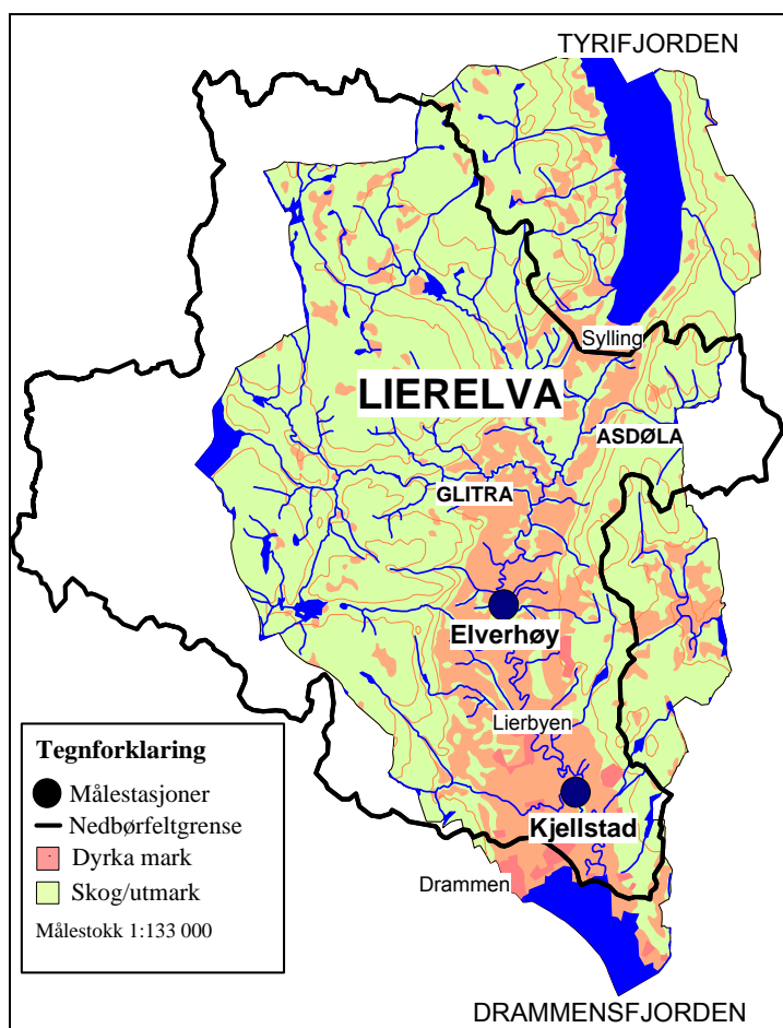
Figur 1. Lierelvas nedbørfelt med målestasjoner. Utarbeidet fra Statens kartverks digitale kart for Lier kommune. Nedbørfeltgrensene er hentet fra NVEs REGINE-områder.

Nedbørfeltet til Lierelva er 302 km 2 . Det ligger hovedsakelig i Lier kommune, men omfatter også arealer i Drammen, Nedre Eiker, Modum og Asker kommuner. Landbruksaktiviteten i nedbørfeltet er preget av intensivt jord- og hagebruk. Om lag 80 % av jordbruksarealet i Lier kommune drenerer mot Lierelva (Figur 1).