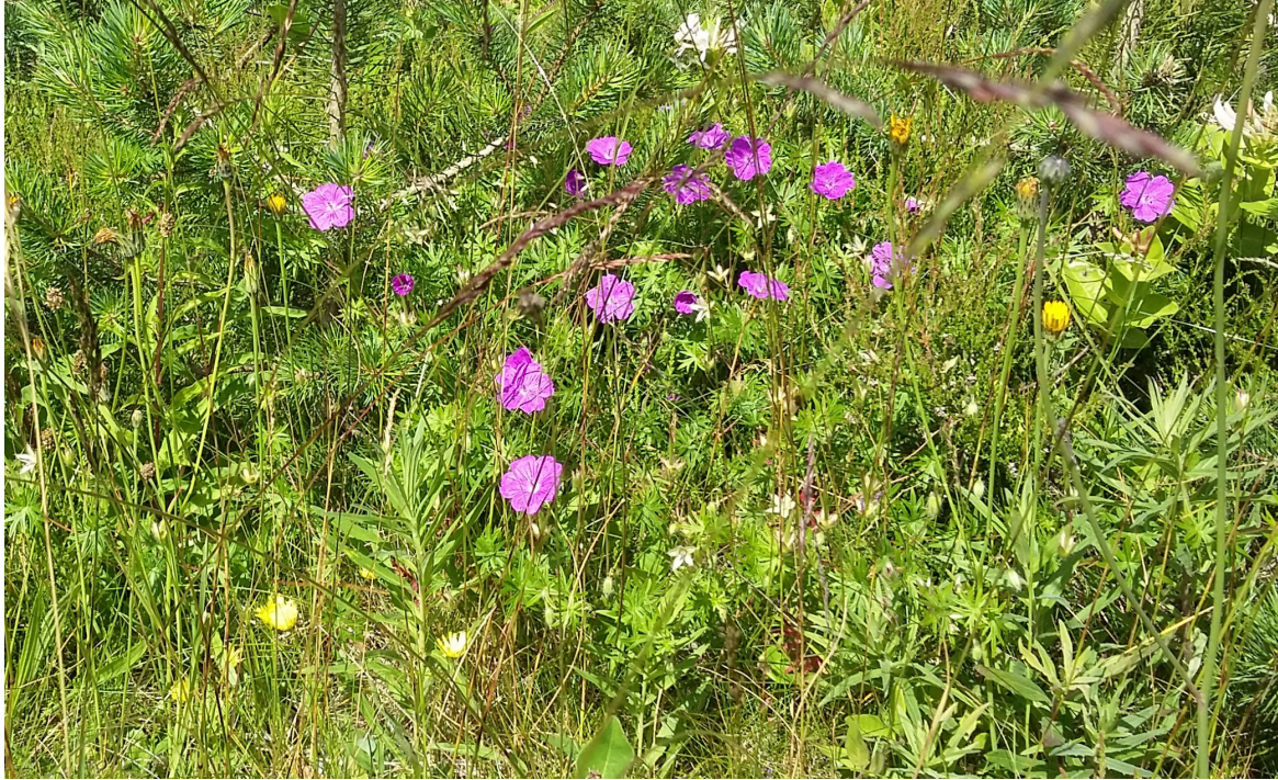
Figur 10. På Spornes i tørrenga rett ved bunkers, innimellom småfuruer og kratt, vokser det bl.a. blodstorknebb, smalkjempe, skjermesveve, prestekrage, legeveronika og føllblom.