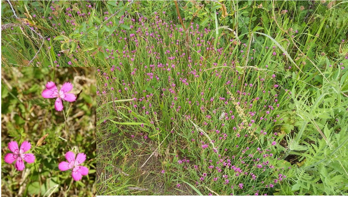
Figur 8. Engnellik er ei plante i tilbakegang mange steder på Agder. Her er ei stor tue med engnellik midt oppe på ei stor maurtue med engskogmaur 1 i enga nær parkeringsplassen på Spornes. Det vokser engnellik mange steder innen skjøtselsplanområdet på Spornes.