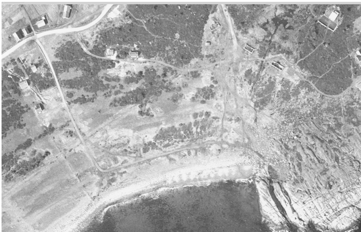
Figur 4. Flybilde fra 1968 over deler av Spornes. Områdene med mørk grå farge er busker og kratt, noe lysere grå viser vegetasjonsdekke, mens lysere felter domineres av rullestein.