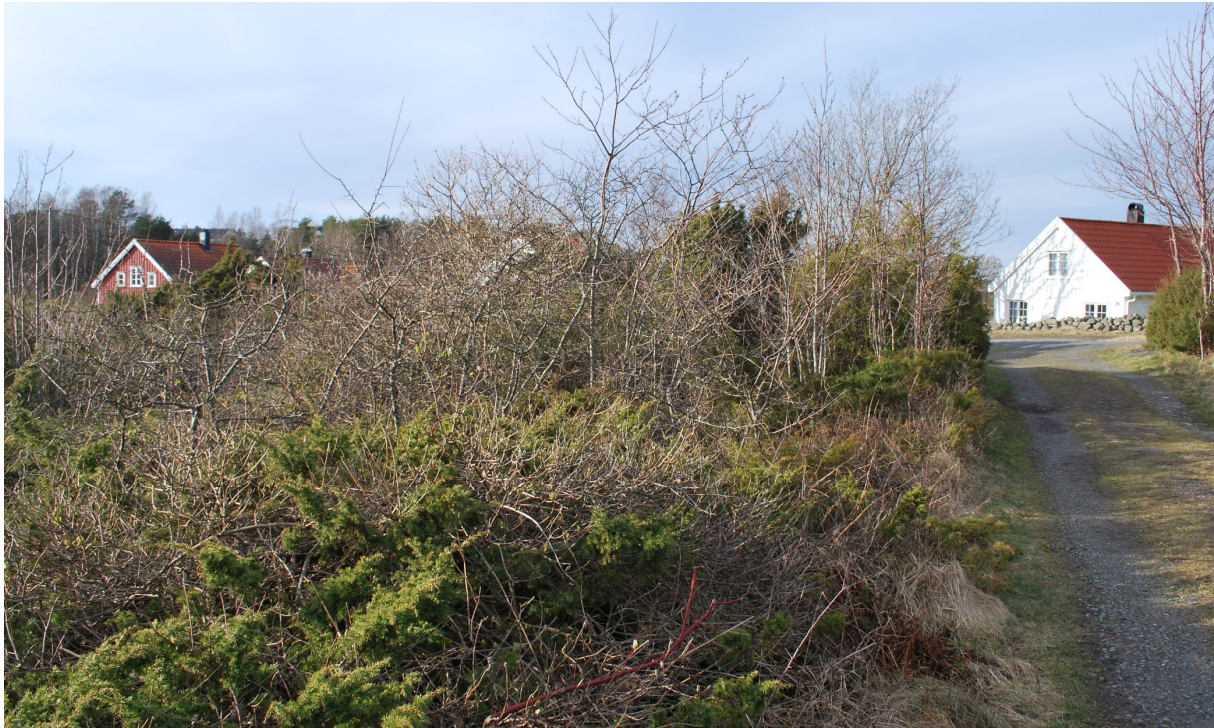
Figur 30. Fra felt 2 som skal gjenåpnes. Her dominerer bl.a. mye einer.