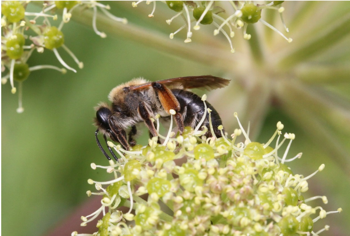
Figur 14. Tresandbie Andrena tibialis på strandkvann på Spornes, Arendal kommune.