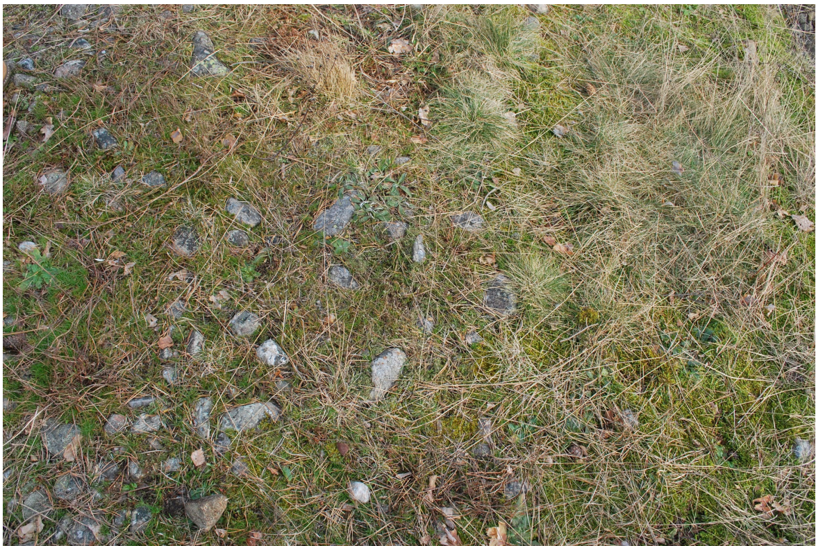
Figur 25. Vegetasjonsdekket oppå rullesteinene er mange steder veldig tynt. Det bør ikke brennes kvisthauger i områder med så tynt jordsmonn.