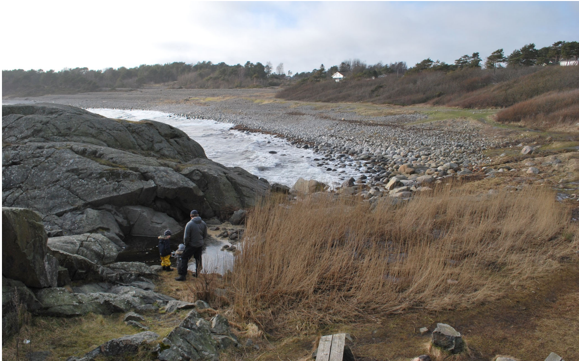
Figur 5. Spornesstranda i mars 2020, sett fra Spornesodden og omlag fra samme sted som bildet fra 1900, se Figur 3. I forgrunnen var det tidligere et steinbrudd som ble laga av tyskerne under 2.verdenskrig. Her er det i nyere tid fylt på masse som har hatt en naturlig revegetering etterpå.