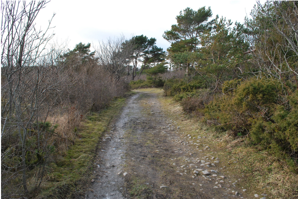
Figur 24. Endel semi-naturlig vegetasjon vokser langst veier og stier innen skjøtselsplanområdet. Her er veien som går rett vestover fra parkering i de øvre deler. Merk slåpetornkrattet som vokser på venstre side av veien og som kan spares om en setter gjerdet til felt 1 på innsiden av dette.