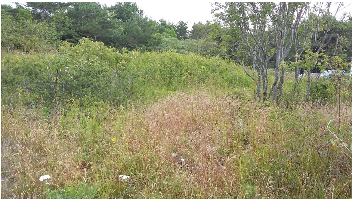
Figur 19. Eng med slåpetornkratt nær parkering. Denne vil være aktuell å restaurere med tanke på slåttemark. Det ble registrert naturengarter som tilsier at slått vil være rett skjøtelsesform. Det bør spares slåpetornkratt fortrinnsvis inn mot kantene og rundt gjenstående trær i enga, se også Figur 17.