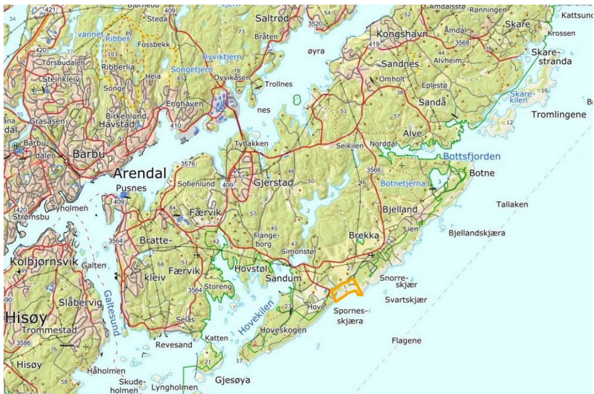
Figur 1. Skjøtselsplanområdet på Spornes er markert med gul avgrensning. Spornes ligger på yttersida av Tromøya ved Arendal. Kart: www.gardskart.no

Rullessteinsstranda på Spornes er en del av raet og har store geologiske verdier med godt synlige terskler fra landhevingen etter siste istid. Men gjengroingen dekker nå over store deler av de geologiske fenomenene og forringer ved det mye av det karakteristiske uttrykket. Ved en gjenåpning vil de kvartærgeologiske formasjonene igjen kunne bli mer framtrede og tydlige.