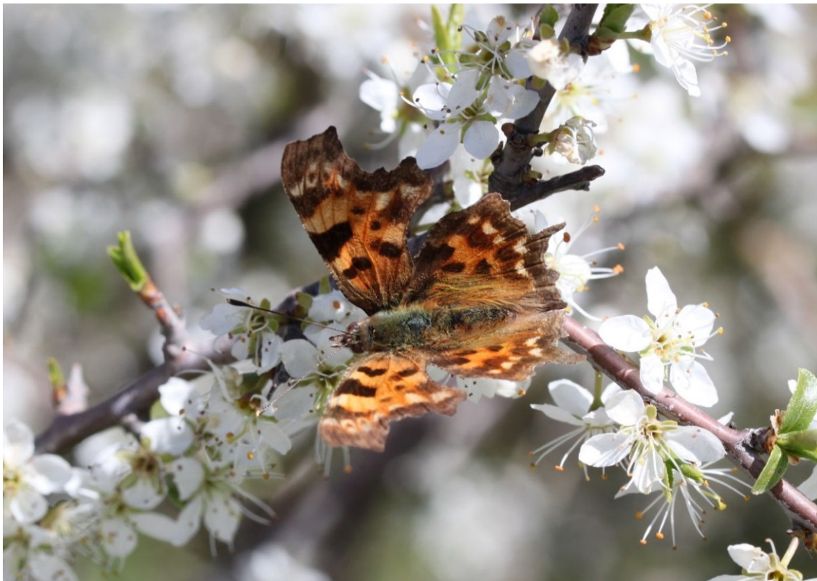
Figur 15. Sommerfuglen Hvit c Polygonia c-album på slåpetorn på Spornes, Arendal kommune.