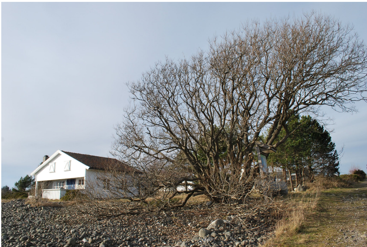
Figur 29. Stor selje inntil Tangveien. Denne står utenom beiteområdene og bør få stå uberørt. Ei av de fem private hyttene ses i bakgrunnen.