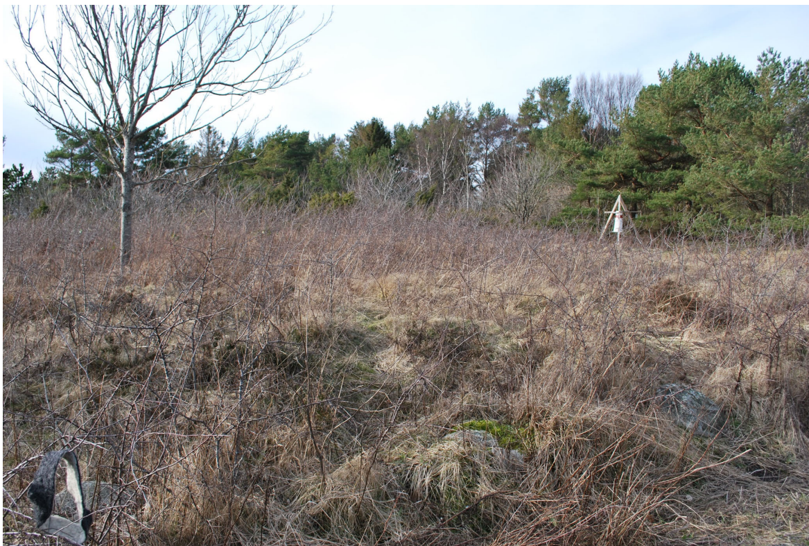
Figur 20. Eng ved parkeringsplass er relativt tua med bl.a. mange maurtuer. Videre er det mye slåpetornkratt jevnt utover. Slåpetornkratt kan sette igjen mot kantene, og en kan forsøke å flytte enkelte av maurtuene inn mot kanten, eller spare maurtuene inne i gjenstående slåpetornkratt. Resten må jevnes ut slik at en får slått enga.