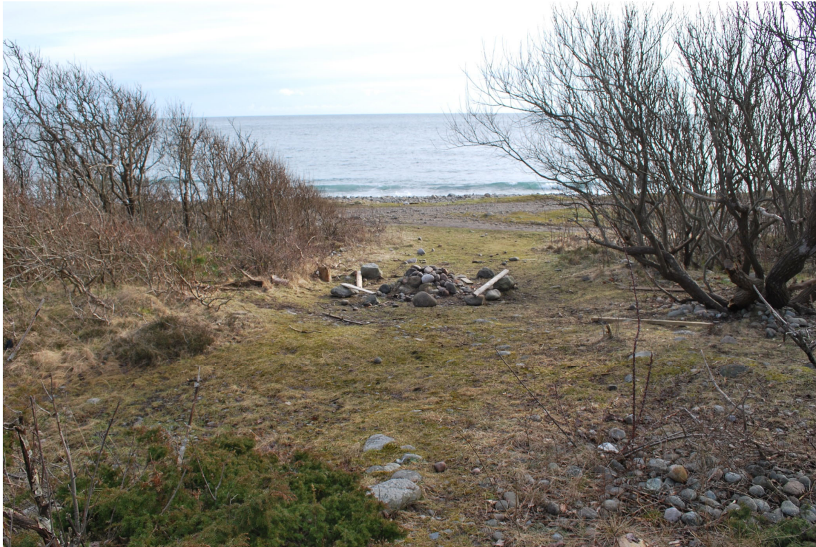
Figur 28. Opparbeida rasteplass inne i selje-beltet på oppsiden av Tangveien.