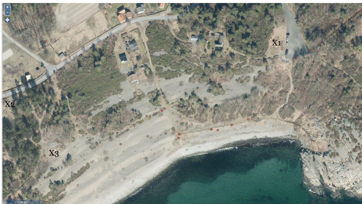
Figur 13. Prikkene viser rødlistede karplanter og sopp innenfor skjøtelsesplanområdet på Spornes. X1, X2 og X3 markerer områder med engevegetasjon befart 3. juli 2019. I tillegg ble det også registrert naturengflora langs stier og i åpne vegetasjonsområder.

Spredt i området fant vi også fremmedarter som platanlønn, edelgran, klistersvineblom og rødhyll. Se Vedlegg 1, tabell 4. for flere fremmedarter i området.