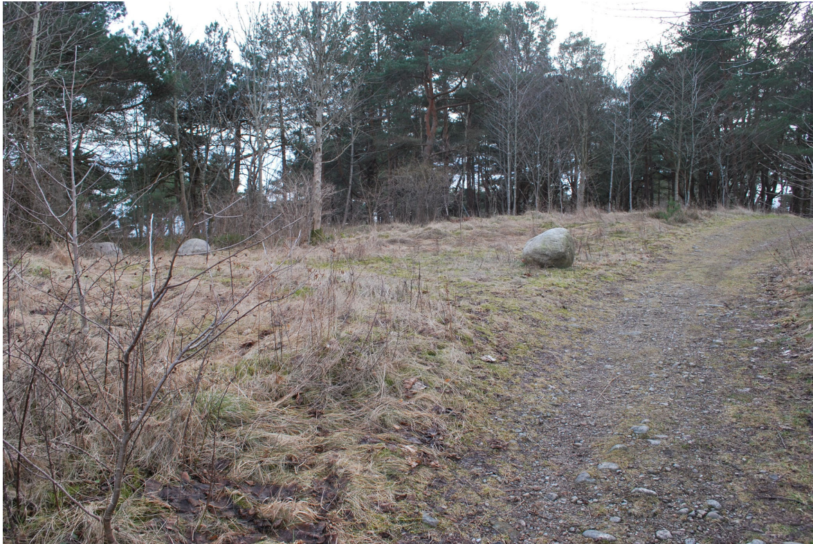
Figur 22. Eng nærmere Hoveleiren, se X2 Figur 13 og 17. Tilgrensende skog i bakgrunnen kan tynnes til en mer lysåpen skog der de rettete furuene tas ut, og de med karakteristiske, krokete spares.