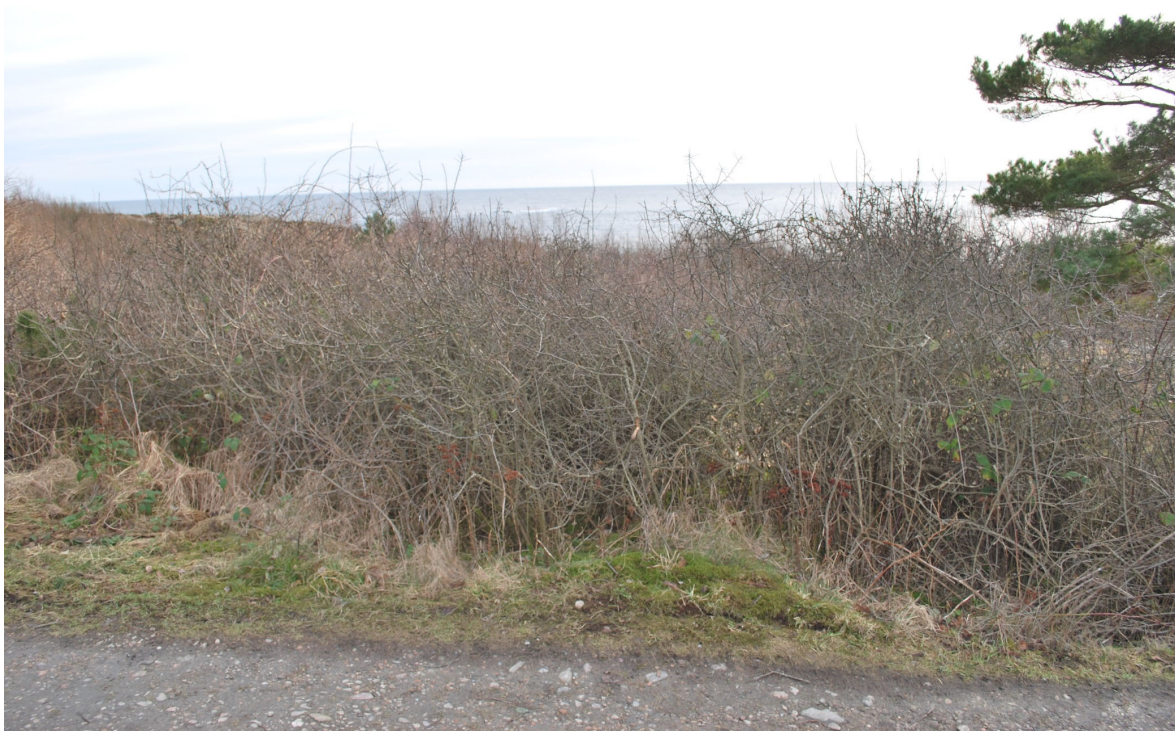
Figur 23. Slåpetornkratt på nedsiden av veien vestover nær rasteplass/parkeringsplass. Mye av dette kan spares ved at gjerdet til Felt 1 settes på baksiden av krattet.