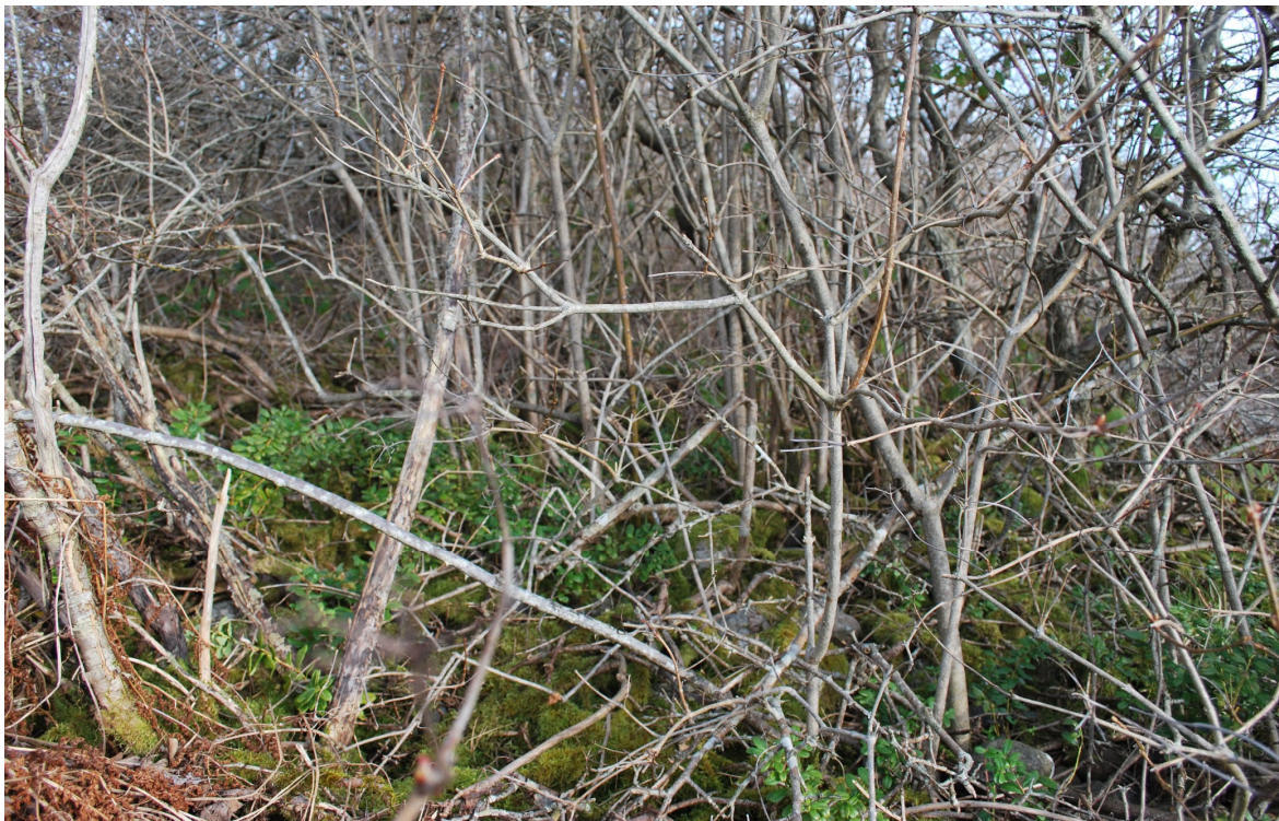
Figur 27. Inne i den tette krattvegetasjonen er det mange steder i bunnen et godt utvikla mosedekke, mye siden det er skyggefullt og fuktig. Her også med en del tyttebær i feltsjiktet. En må regne med at mosedominansen endrer seg med økt lystilgang og endra mikroklima. Hvor tykt humuslaget og vegetasjonsdekket er varierer en god del i området. Det er derfor vanskelig å si hvor mye natureng det reelt blir etter gjenåpning.