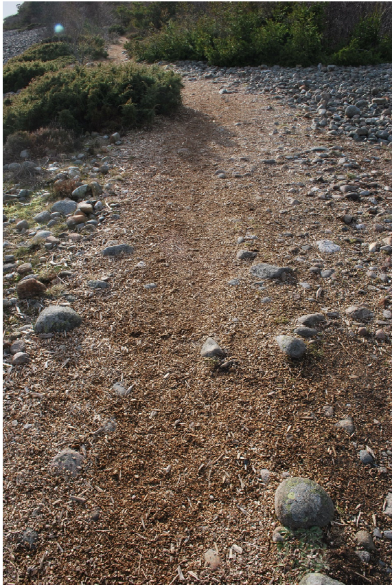
Figur 32. Det er fylt på med noe flis på stiene der de går over rullesteinene. Dette gjør det lettere å gå på dem. Flis må ikke legges på Tangveien, eller andre områder med en rik tørrbakke-/naturengflora.