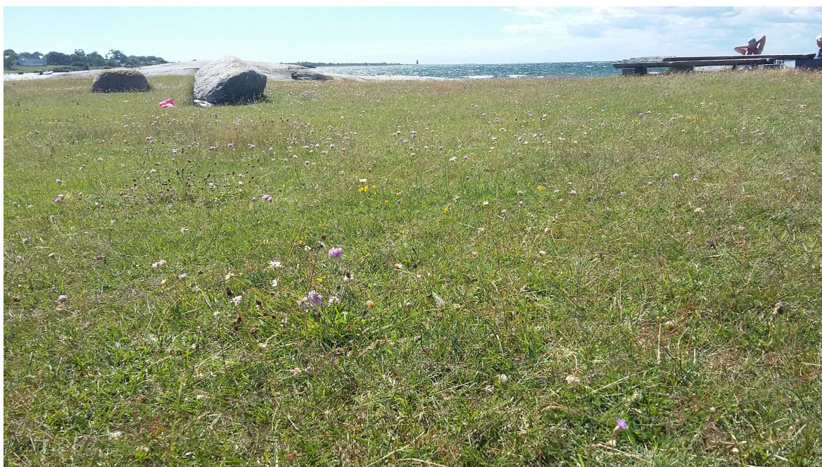
Figur 7. Strandnært og artsrikt naturbeite i Kuhavna på Jomfruland. Jomfruland er lik Spornes en del av det store raet.

Beste måten å skjøtte ei gammel artsrik naturbeitemark på, er å følge opp den tradisjonelle driftsformen, uten tilført gjødsel og med fortsatt beite. Det tradisjonelle utnyttelsen har variert fra sted til sted avhengig av driftsform og tilgang på dyreslag. Derfor er det viktig å finne ut hva som har vært vanlig på den aktuelle lokaliteten eller i nærområdet fra gammelt av. Helst bør en bruke samme dyreslag som har beitet området før.