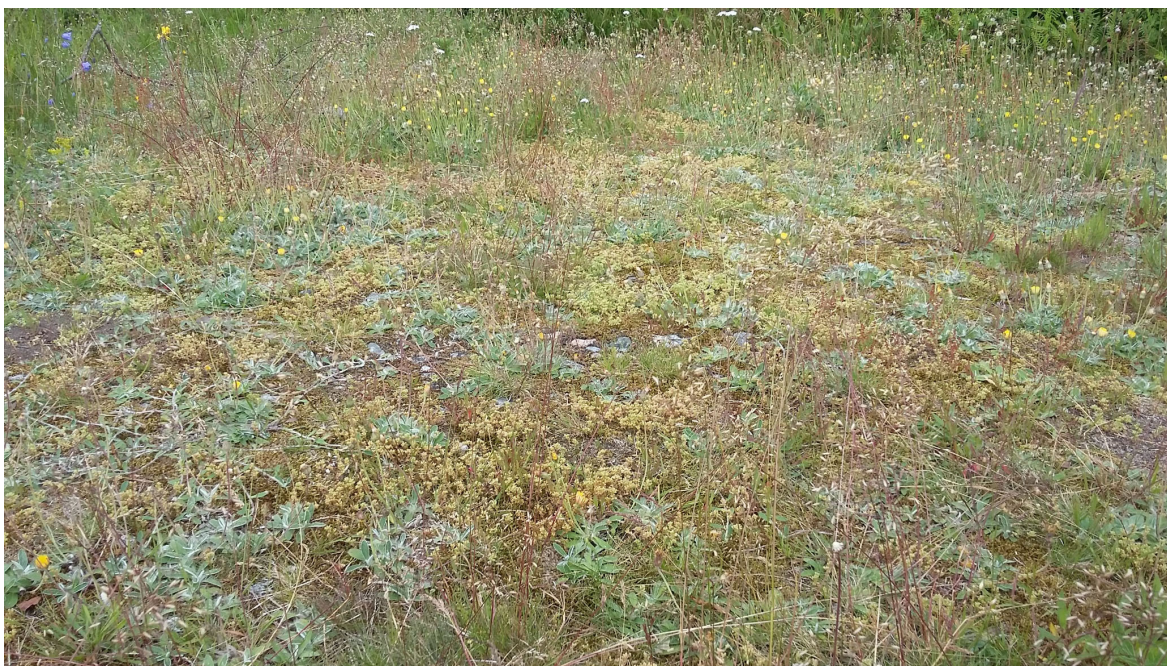
Figur 21. Tørrengvegetasjon i eng nær parkeringsplass/sti vestover. Her vokser mye hårsveve som er ei viktig matplante for mange insekter. 03.07.2019.