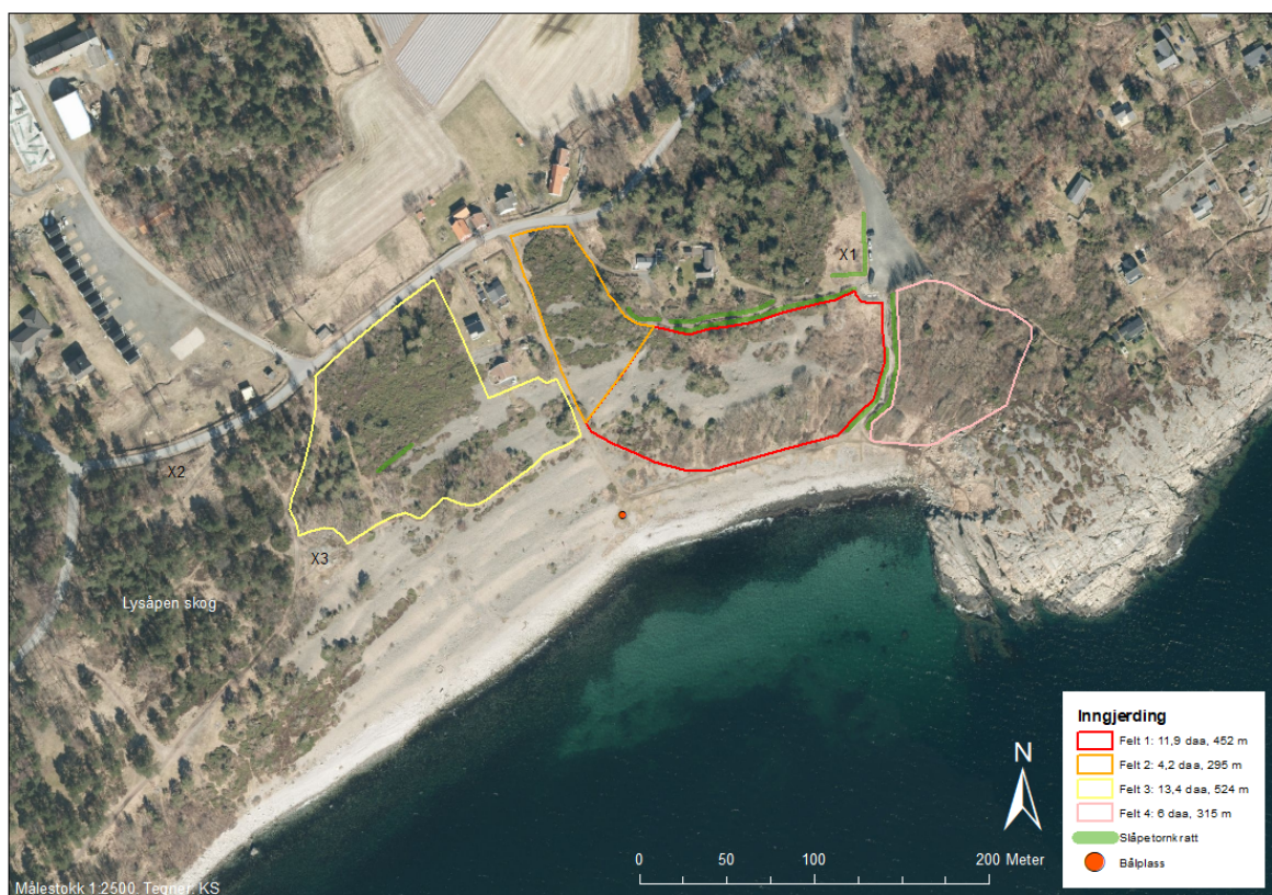
Figur 17. Inndeling i aktuelle arealer som prioriteres for gjenåpning. Felt 1, rød markering, har førsteprioritet over felt 2, 3 og 4. Farva streker antyder gjerdeplassering. Gjerdene kan om mulig settes opp i rette strekk, slik at rike kantkratt kan spares utenfor gjerdene, se grønne markeringer.