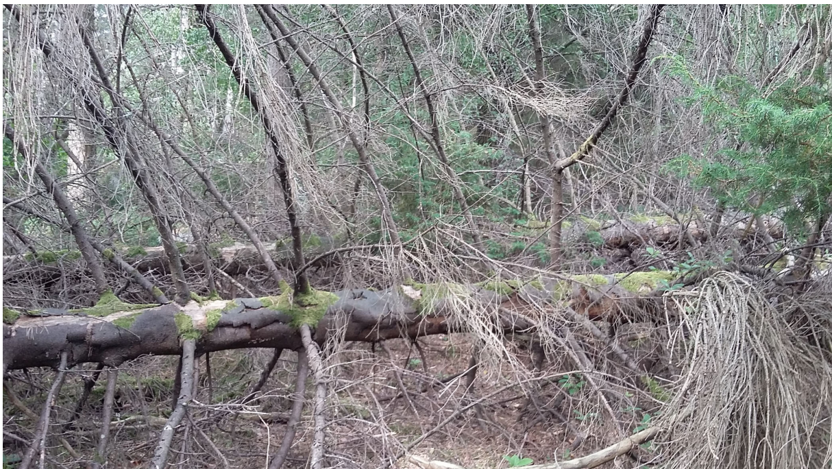
Figur 31. Vindfall av gran inne i nærliggende skog ved parkering. Død ved er viktig for bl.a. mange insekter.