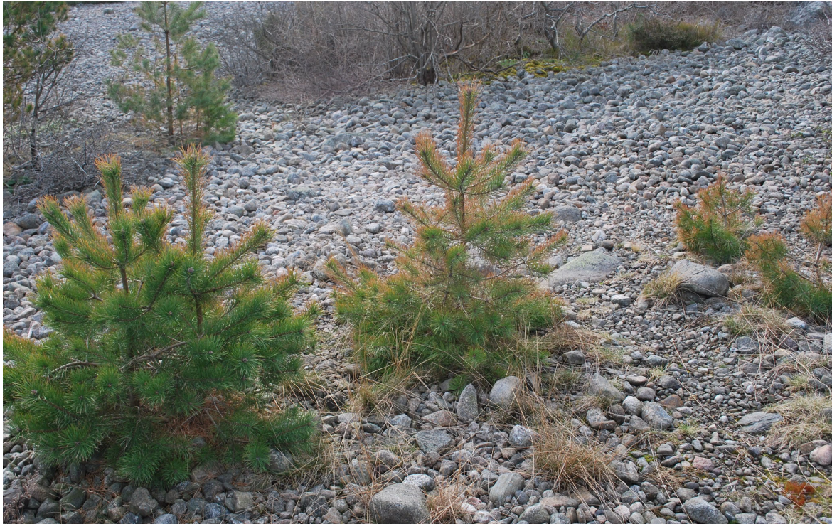
Figur 26. Enkeltstående trær på vei opp utenom inngjerdingene bør rykkes opp/fjernes.