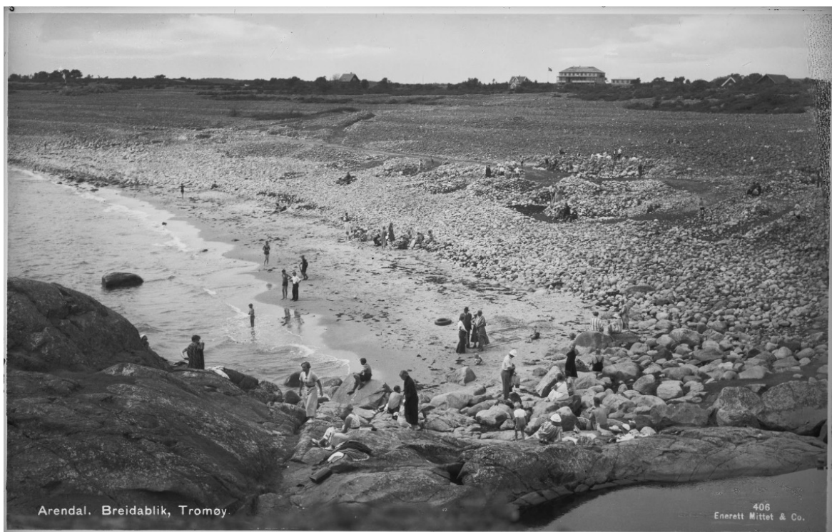
Figur 3. Spornesstranda på Tromøya ved Arendal, år 1900. Området er prega av åpen rullesteinsstrand over store areal. Vegetasjonsdekke kan skimtes mellom steinene i forgrunnen, langs Tangveien og på tangplassene der tang til de ulike gårdene ble samla og tørka. Spredt i de øvre delene forekommer det noen områder med busker.