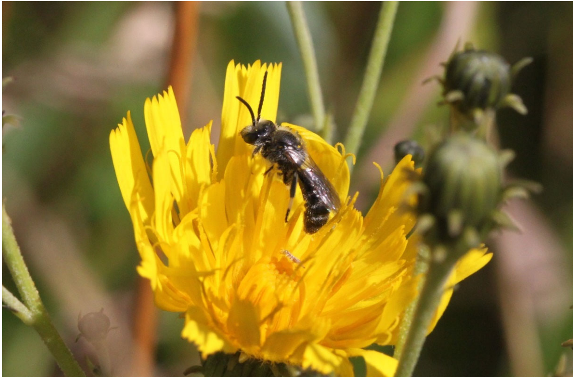
Figur 16. Markjordbie Lasioglossum leucozonium hann på skjernsveve på Spornes, Arendal kommune.