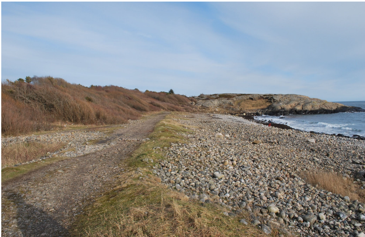
Figur 6. I 2020 er det gjengroing med tette kratt av selje, vier og diverse busker som preger arealene på oppsiden av Tangveien. Gras- og vegetasjonsdekke forekommer langs veien og inn mot kratt.