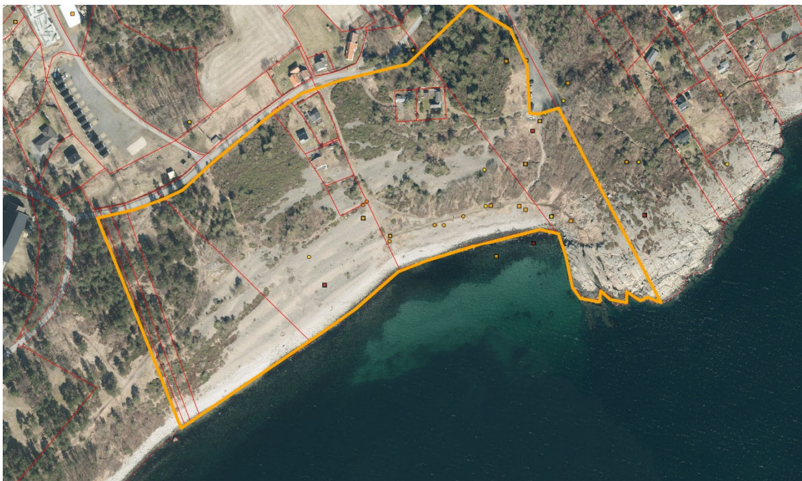
Figur 2. Skjøtselsplanområdet på Spornes er avgrensa med gul markering og utgjør 100 daa. I nord grenser skjøtselsplanområdet av grusvei, i sør mot sjøen, i vest mot eiendom gnr 211 bnr 47, og i øst mot gnr 215 bnr 114 Det finnes i dag fem hytter innen området.