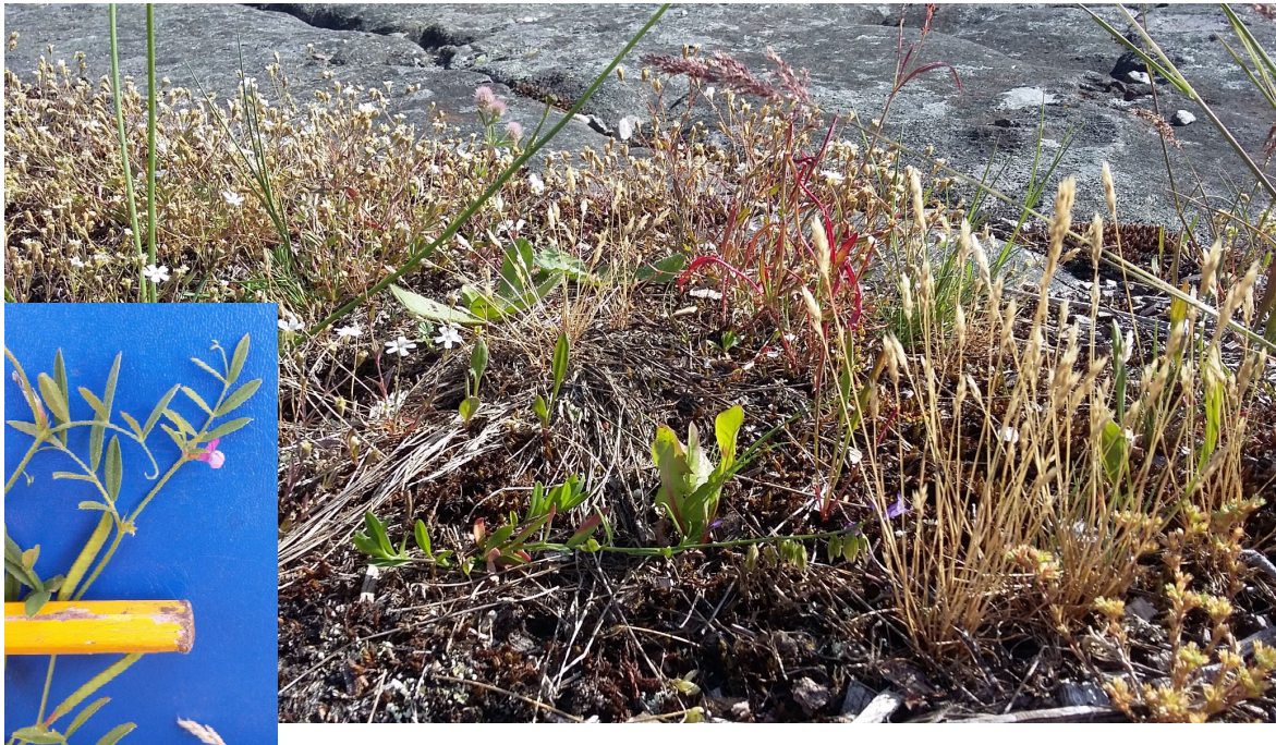
Figur 11. Utsnitt av tørrberg/tørrengvegetasjon innen skjøtselsplanområdet med bl.a. småsmelle, blåfjær, harekløver, dvergsmyle, flerårsknavel, kystgriseøre, småsyre. I dette området vokste også vårvikke, EN (innfelt). Varme tørrenger er gode insekthabitater.