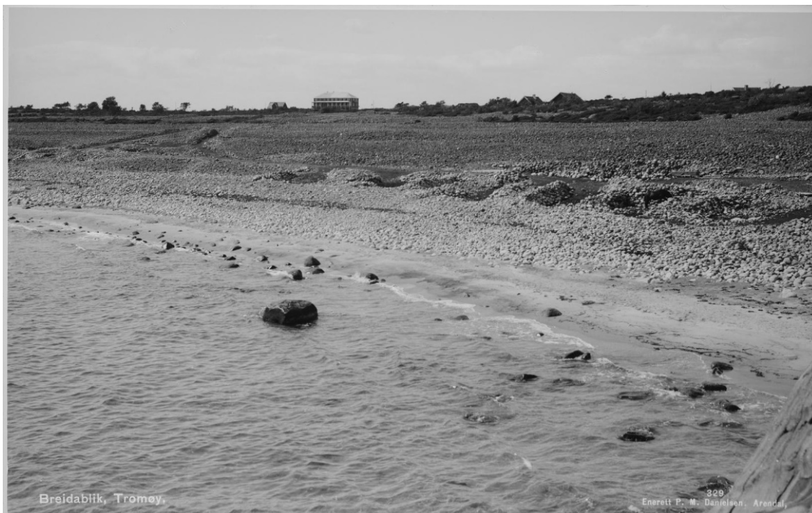
Figur 12. Spornesstranda for over hundre år tilbake, med hotellet (nå Arendal Herregård) i bakgrunnen. Ned mot sjøkanten sees tydelig tangvollene der hver gård hadde sin faste plass for å mellomlagre tang før henting. Denne tangretten er fortsatt i bruk. Foto: Mittet & Co 1.1.1900 Bredablik. Kilde: Nasjonalbiblioteket.

Skjøtsel i nyere tid 6 : Fylkesmannen og nasjonalparkforvalter har stått for begrensning av busksjiktet på enkelte prioriterte områder ved at det har vært rydda noe i nyetableringer og oppslag. Kratt og trær har blitt ryddet gjentatte ganger i siktsonen fra parkeringsplassen ned mot havet, videre har nåværende forvaltningsplan et uttalt mål om at busksjiktet ikke skal spre seg nedenfor Tangveien som ligger på 2. terskel på rullesteinsstranda. Så seint som høsten 2018 ble en del nyetableringer av busk/småtrær nede i rullesteinene fjernet.