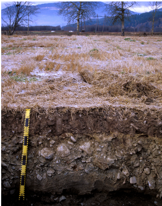
Leptosol med høyt innhold av grovt materiale egner seg dårlig til gulrotproduksjon, men kan gi grunnlag for andre vekster.

Valgmuligheter for vekster, samt størrelse og kvalitet på avlinger, påvirkes av jord- og terrengegenskaper. Hva jorda er laget av har betydning for vanningsbehov, bæreevne, muligheter for jordarbeiding