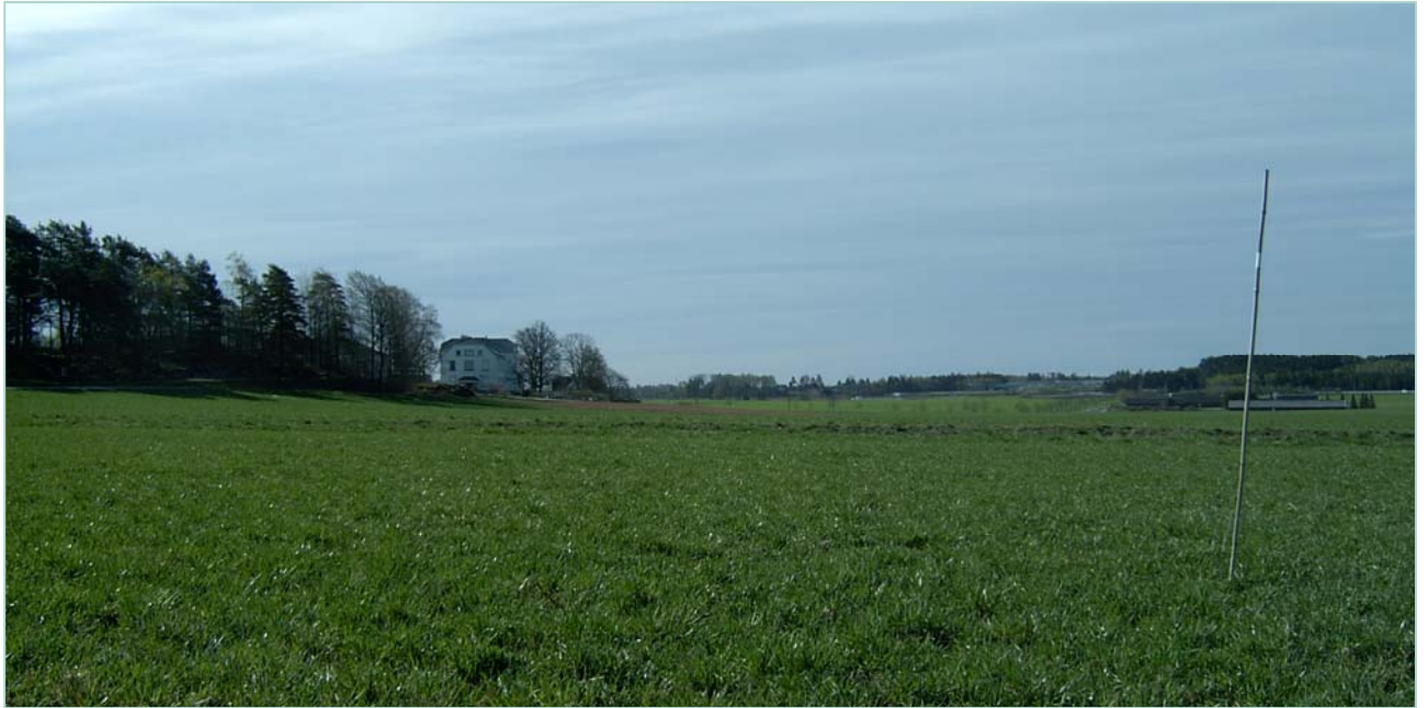
Forsøksfeltet på Kalnes blir dreve økologisk.

På Gjermundnes vart delar av feltet slått tidleg i juni for å forsinke frøsettinga av raudkløver og timotei (sjå bilde s.14). Det vart ingen suksess, då ingen av artane kom lenger enn til blomstring etter gjenveksten. Dette kan vere fordi engane vart slått for seint kombinert med ein dårleg sommar. Den delen av feltet som ikkje var slått var dominert av raudkløver. Dette var uventa fordi engane hadde fått rikeleg med nitrogengjødsel i engåra, og vanlegvis konkurrerer gras og timotei ut kløveren. Elles er det spesielt at det var svært lite timotei i dette feltet. Våren 2016 vart dette feltet sprøytet for å fjerne raudkløveren og fremme grasveksten. Det viste seg da at det likevel var timotei på feltet og det vart produsert nesten ein halv kilo ferdig rensa frø.