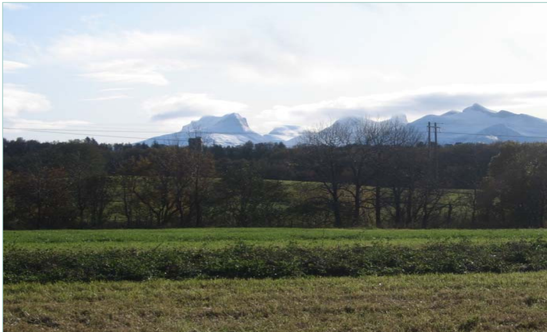
Feltet på Vågønes i Nordland er snart klart for hausting av raudkløverfrø.

I 2007 sådde me ut ei blanding av timotei, engsvingel og raudkløver på fem stader. Blandinga besto av 65 % timotei, 25% engsvingel og 10% raudkløver. Felta var om lag 600 m 2 , med nokre lokale tilpassingar. Fire av felta vart lagt til einingar i Bioforsk: Fureneset, Løken, Vågønes og Flaten (avd. Holt i Alta). I Østfold tok Norsk Landbruksrådgiving Sør Øst på seg feltarbeidet (Øsaker). I 2008 vart det etablert to felt til, eit på Snåsa i regi av Norsk Landbruksrådgiving Nord-Trøndelag og eit i Alstahaug i regi av Norsk Landbruksrådgiving Helgeland. Som tabell 1 viser vart det totalt sju felt med ei rimeleg bra fordeling geografisk.