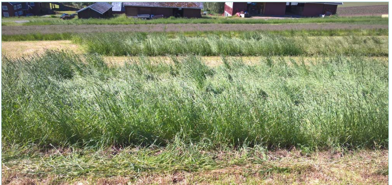
Feltet sådd NIBIO Løken 2015 klart for 1. slått.

Landbruksdirektoratet har bede om at det må leggest ein plan for framtidig gjennomføring av prosjektet og at dette skal gjerast i samarbeid med Norsk genressurscenter.