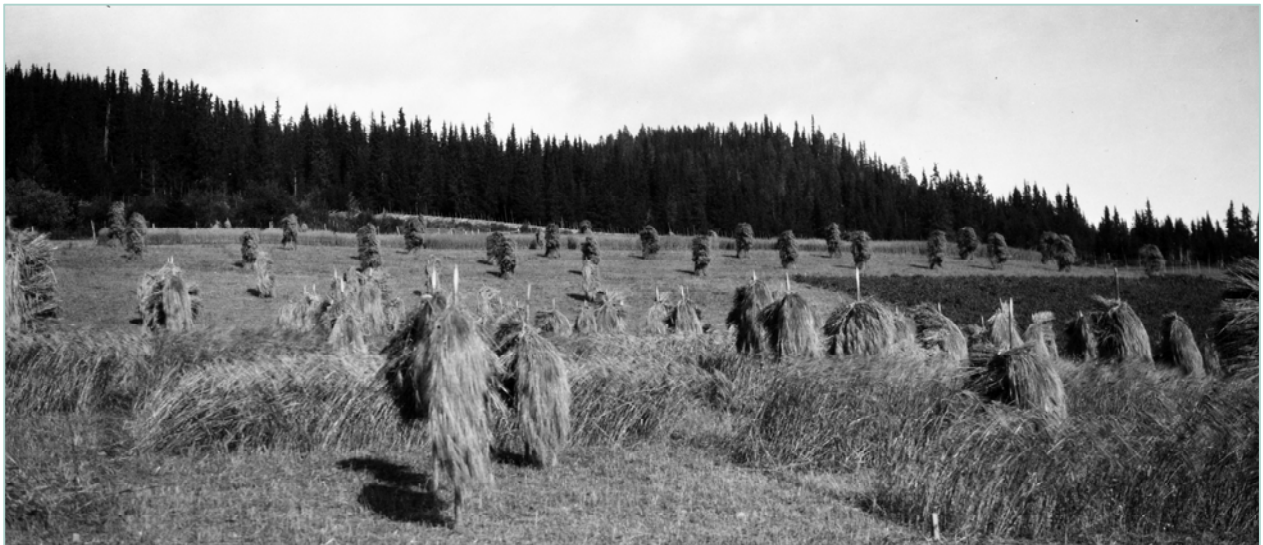
Fram til 1900 brukte ein helst den dyrka marka til kornproduksjon. Løken forskingstasjon.

Opprinneleg var det skogen som dominerte i vårt land. Bortsett frå grasheiene i fjellet fans det naturlege grasenger berre som små areal langs strandkantar, myrer og elver. Det at grasartane utgjer ein så stor del av vegetasjonen i våre dagar skuldast menneskelege inngrep. Dette gjeld dyrka eng og beite, men også udyrka område og utmarksareal der slått, beite og ferdsel har fremma grasartane i konkurranse med andre plantesamfunn.