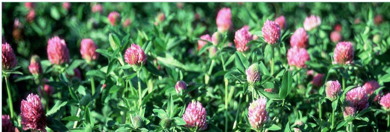
Molstad raudkløver.

1800 planter vart etablert av frø frå ei samankryssing utført både på Løken og i Danmark i 1998. Der var det med totalt 283 populasjonar: 73 norske, 84 svenske, 45 finske, 23 danske, 46 frå tidl. Sovjet, 5 frå USA, 2 tyske, 4 canadiske og 1 frå Sveits. I tillegg 180 planter frå 9 sortar: Nordi, Liv og Lea frå Norge, Rajah frå Danmark og Pallas, Ares, Bjørn, Bjursele og Jesper frå Sverige.