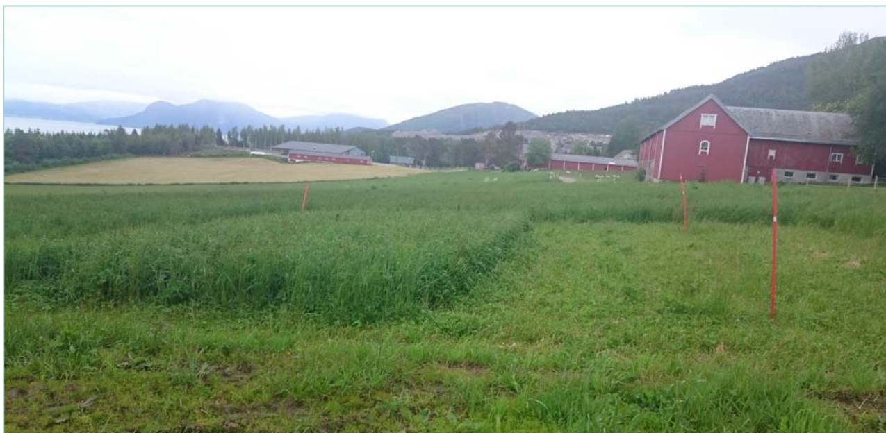
Delar av feltet er hausta for å utsette veksten og tidpunkt for frøhausting, Gjermundnes.

Felta som vart etablert i 2. runde var 100 m 2 store, både fordi det burde gje nok frø og ikkje minst fordi det gjer manuell frøhausting muleg. Sjølv om klimaet er egna for frøproduksjon har felt i lavareliggande strøk i Sør Norge også sine utfordringar. Den største er rett og slett at frøet modnar tidleg, kanskje allereie midt i juli. Dette er før elevane er tilbake etter sommarferien og då det elles er ferieavvikling blant dei tilsette. For å forsinke frømodninga kan ein i område der vekstsesongen er lang nok ta ein tidleg førsteslått (sist i mai) med høg stubbehøgde. Timotei og raudkløver vil komme med generative skudd i gjenveksten slik at det kan bli frøhausting av desse i september-oktober. Engsvingel tåler ikkje ei slik avpussing då den sett frø på skudd som er danna og indusert til blomstring hausten før. Dersom ein vil prøve denne metoden må ein derfor ikkje slå heile feltet men sette av ein tredel til ein halvdel av feltet for å produsere engsvingelfrø.