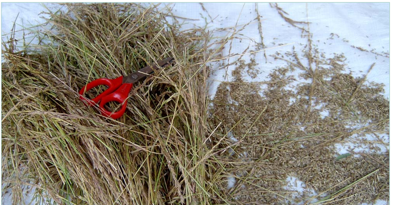
Frøhausting med saks er tidkrevande men sikrar reint frø. Her ser vi engsvingel.

Bevaring ved bruk-prosjektet skal ikkje halde seg til tradisjonelle frødyrkingsområde og eldre tiders dyrkingsmetodar. Det viktige er å legge forholda til rette for å få nye lokalsortar tilpassa dagens og framtidens klima og landbruksdrift. Det kan bli utfordringar med frøberginga, og ein må sjå på praktiske løysingar, gjerne forankra i tradisjonelle metodar for det enkelte distrikt. I regnfulle kystområde og område med svært kort vekstsesong kan det bli vanskeleg både med modning og hausting. Kaldt og vått vêr under blomstringa vil også kunne føre til lite frø, spesielt for raudkløver men også for grasa. For raudkløver er det viktig at det er nok pollinatorar til stades under blomstringa, som humler og andre insekt.