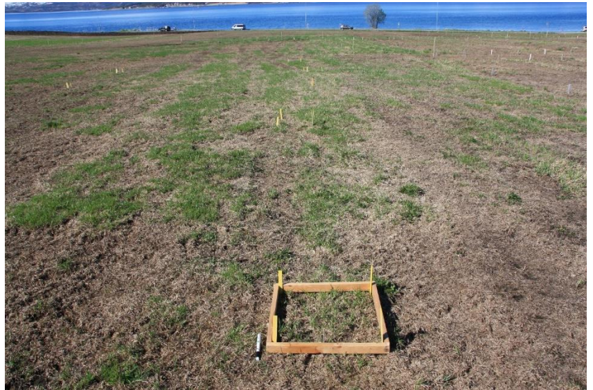
Bioforsk Holt, Tromsø, 10 cm isdekke 3. mars 2013. Registreringsruter på vinterskadet areal, 23. mai 2013.

Det var mye is på arealene, spesielt på Bioforsk Holt. Isdekkets tykkelse ble målt til 9-10 cm på engarealene i begynnelsen av mars. Heldigvis falt det snø etter mildværet som bidro til at isen ble noe mer porøs under snølaget. Våren kom hurtig med høyere temperaturer enn normalt både i april, mai og juni (Figur 2), og dette gjorde at isen smeltet hurtig. Holt var helt telefritt 21. mai. I Midt-Troms startet våronna allerede midt i mai de tidligste stedene.