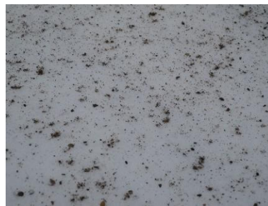
Finsand, 100 kg/daa

Da feltet ble anlagt 29. april på Vassmo var snødybden 65 cm. 11 dager senere, den 10. mai var snødybden nede i 40 cm. Rutene med sand var nesten helt tint, mens rutene med kalk fremdeles hadde ca. 30 cm snødekke. To dager senere, den 12. mai var rutene med sand helt bare, mens rutene med kalk hadde ca. 15 cm snø. Ubehandlete ruter hadde 30 cm snø. Snøen på rutene med kalk var borte 15. mai. 17. mai var også snøen på de ubehandlede rutene borte. Feltet ligger i svak helling, og smeltevannet rant bort fra rutene etter hvert som det tinte. Rutene med sand tinte altså 3 dager før kalkrutene og 5 dager før ubehandlede ruter.