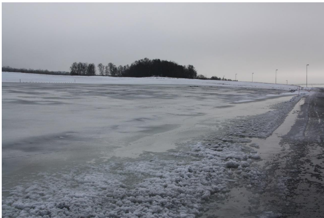
Bioforsk Holt, Tromsø februar 2013. Mildvær med regn og isdanning på engarealene.

Noen år er avlingsskaden nesten total, og store areal må repareres eller fornyes. Spesielt i 2010 var vinterskadene omfattende i Troms. Dette året ble det utbetalt vinterskadeerstatning på 7,8 mill. kr og 56 mill. kr i erstatning for avlingssvikt som kom delvis som følge av vinterskadene, men også pga. stor flom i vekstsesongen samme året (Landbruksdirektoratet statistikk 2014). Hele landet under ett, var det omfattende vinterskader i 2013 i alle kystfylkene fra Rogaland og nordover, og det ble utbetalt rekordstore erstatningsbeløp (Landbruksdirektoratet statistikk 2014).