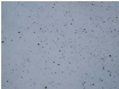
Miljøkalk, 30 kg/daa

Det ble brukt 30 kg/daa miljøkalk og 100 kg/daa sand. Kalken er av typen Agri Åte Ha (Franzefoss Miljøkalk). Dette er malt og granulert kalkstein fra Hamar, grålig på farge.