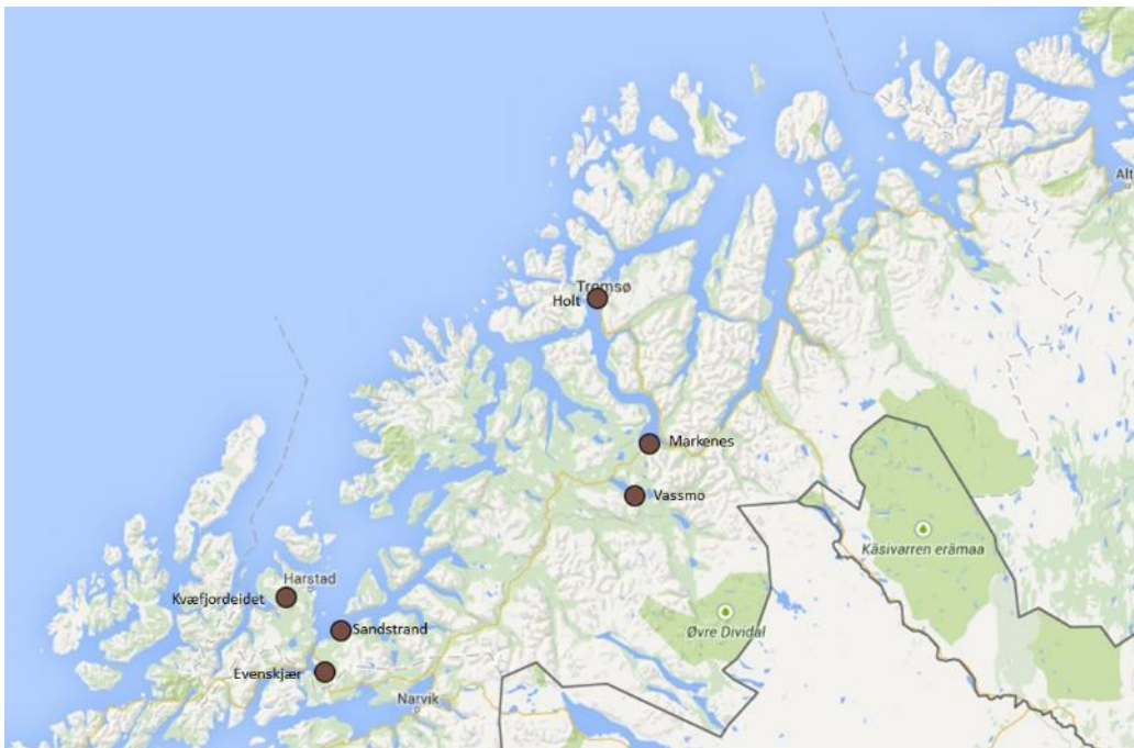
Figur 1. Kart over Troms med stedene der registreringer foregikk.

På tre areal i Sør-Troms (Trøssemark Evenskjer, Sandstrand Tovik, Kvæfjordeidet Kvæfjord), og to areal på Bioforsk Holt i Tromsø (Figur 1) ble det merket opp små registreringsruter ( 0,5 \times 0,5 \text{ m}^2 ) langs et transekt på skrå over arealet. I disse rutene ble dekning av sådde gras og totalt dekning av sådde og andre arter registrert tidlig på våren så snart veksten hadde startet. Rutene ble høstet nært opp til bondens høstetid; på Sandstrand i Tovik var dette i begynnelsen av juli, på Holt 9. juli, og på Kvæfjordeidet og Evenskjer hhv. 15. og 16. juli. Avling per rute ble veid og tørket og resultatene som presenteres her er omregnet til kg tørrstoffavling per dekar. På grunn av begrensede ressurser i prosjektet ble det besluttet kun å registrere første slått. Vi har derfor fokusert på sammenheng mellom vårobservasjoner og effekt på avling rett etterpå.