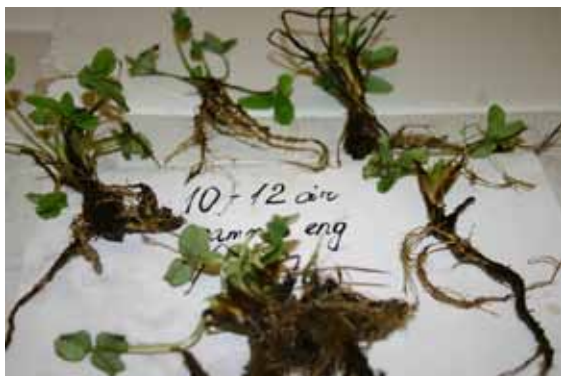
Foto 5. Raudkløver frå 10-12 år gammel eng, merk rotsystem.