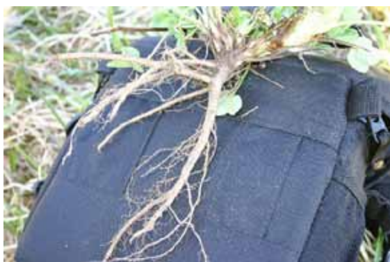
Foto 7. Ung raudkløverplante med kraftig pålerot og siderter.