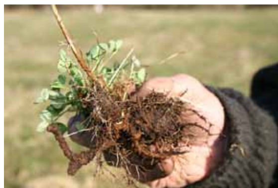
Foto 4. Gammal raudkløverplante med svært greina rotsystem, mykje brune røter.