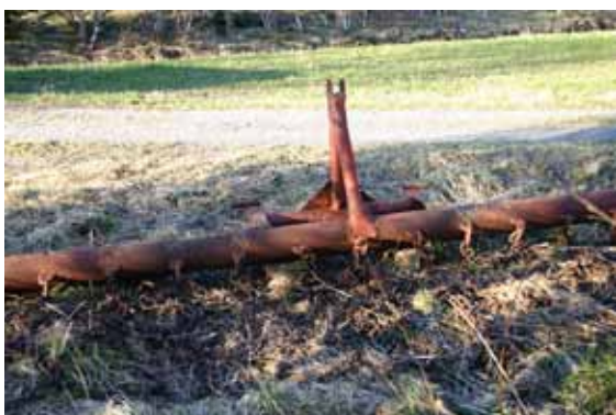
Foto 3. Kjettingslådd brukt til jamning av dautgras om våren.

Rotsystemet på plantar frå ung eng hadde heilt annleis rotsystem (foto 7-8). Her var pålerota intakt, sjølv om det også var mykje siderøter. Ved gjennomskjering hadde fleire røter her frisk, lys farge tvers gjennom, mens det var brune parti på plantar frå den eldste enga.