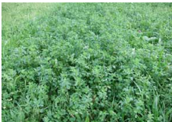
Foto 1. Rein luserne på Tjøtta

Feltet på Tjøtta hadde godt tilslag av luserne (tab. 2, foto 1, 2). Rein luserne konkurrerte godt i avling mot dei andre ledda, og spesielt var gjenvæksten etter første slått god. Grasblandingane gav større førsteslått enn rein luserne. Kløveren slo også godt til, slik at blandinga med både raudkløver og luserne gav størst totalavling. Lusernebestanden var best i toslåttssystemet, men det var bra med luserne også i treslåttssystemet med sein tredjeslått. Tidleg tredjeslått var klart uheldig for overvintringa av luserne, og dette systemet gav dårlegast avling. Raudkløver tolte tidleg tredjeslått betre enn luserne.