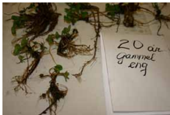
Foto 6. Raudkløver frå 20 år gammel eng