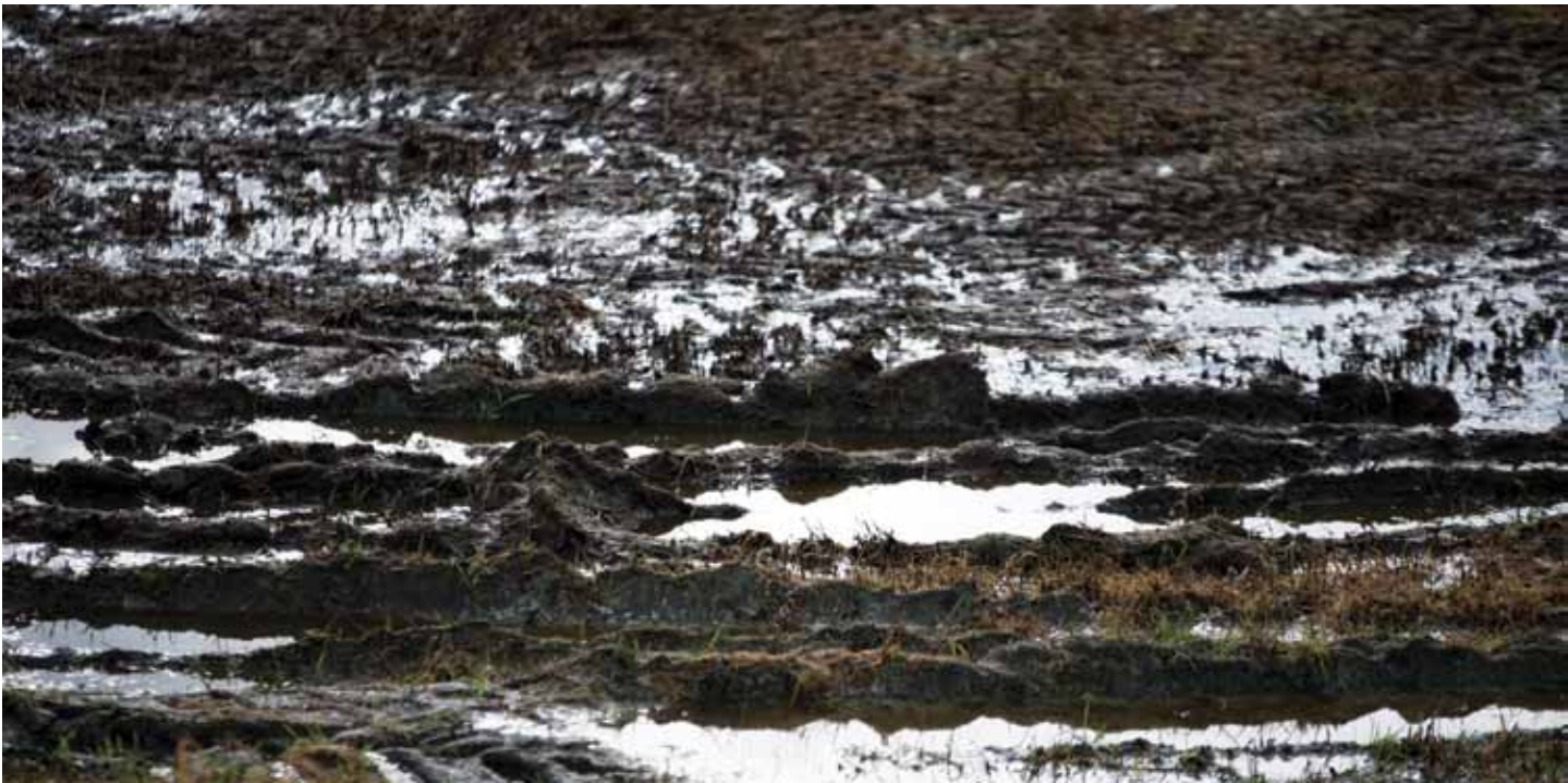
Husdyrgjødsel spredd seint på høsten på eng som først er sprøytet med glyfosat, er ikke bra hverken med tanke på utnytting av gjødselressursen, klima eller miljø.