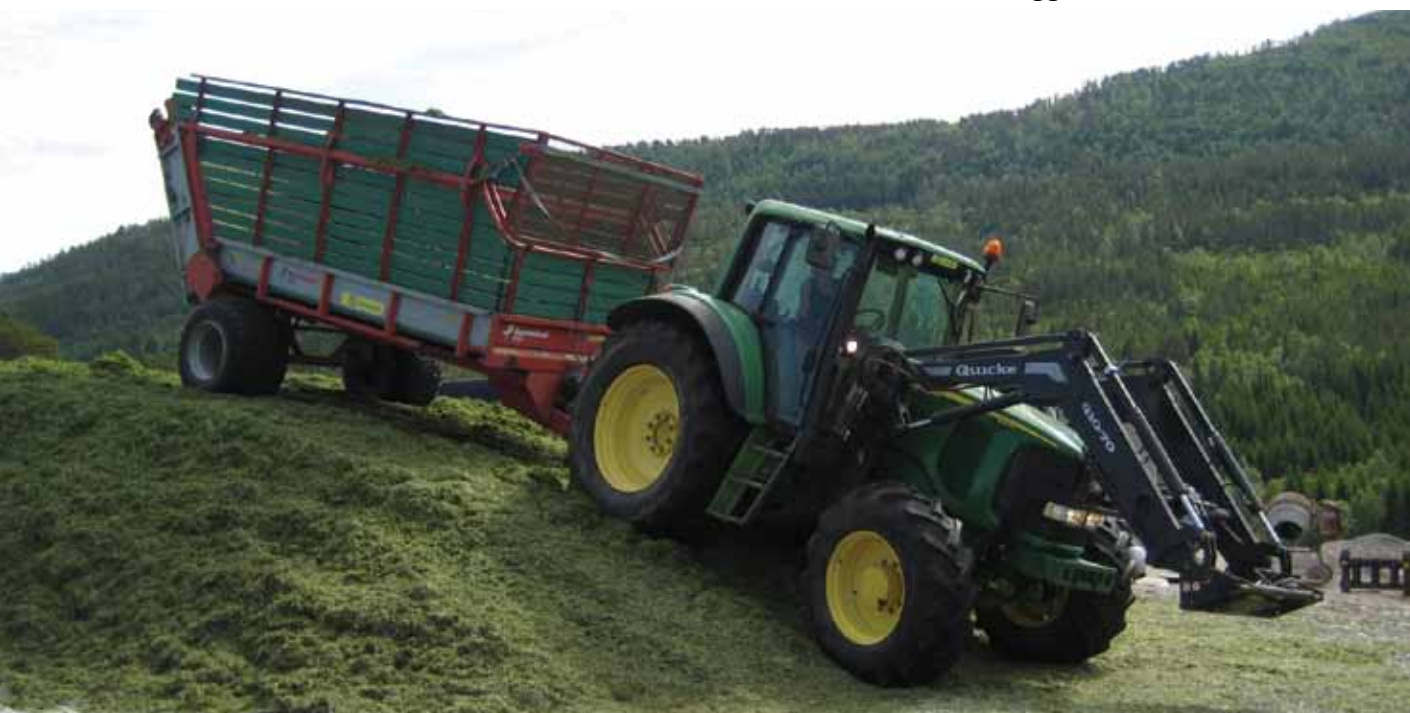
Husdyrgjødsel spredd på langt gras øker risiko for gjødselrester i fôret .