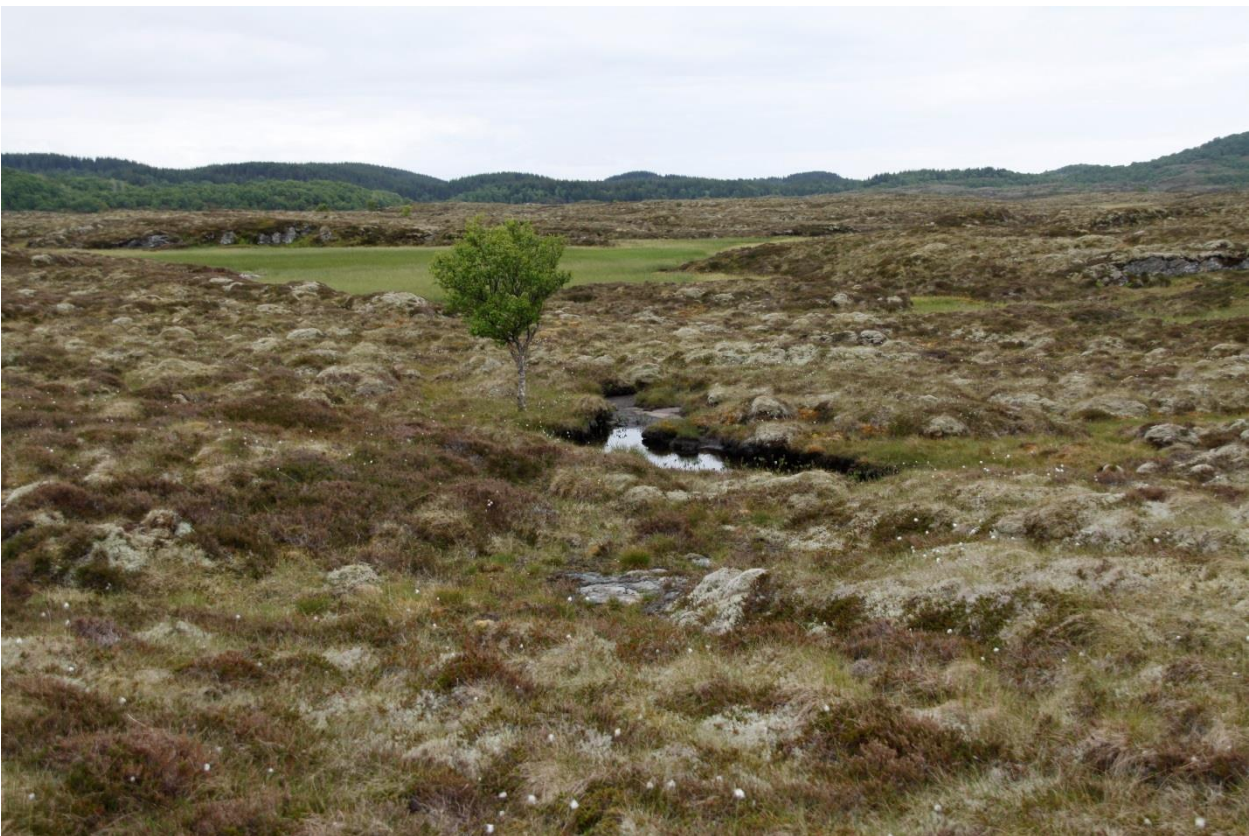
Bilde 4: Sentrale deler av Torsøya består av en mosaikk av tørr og fuktig lynghei, myrpartier og starrsumper.