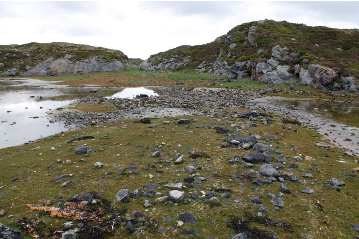
Bilde 6: Strandengkompleks som markerer overgangen til det vestligste området på Torsøya.