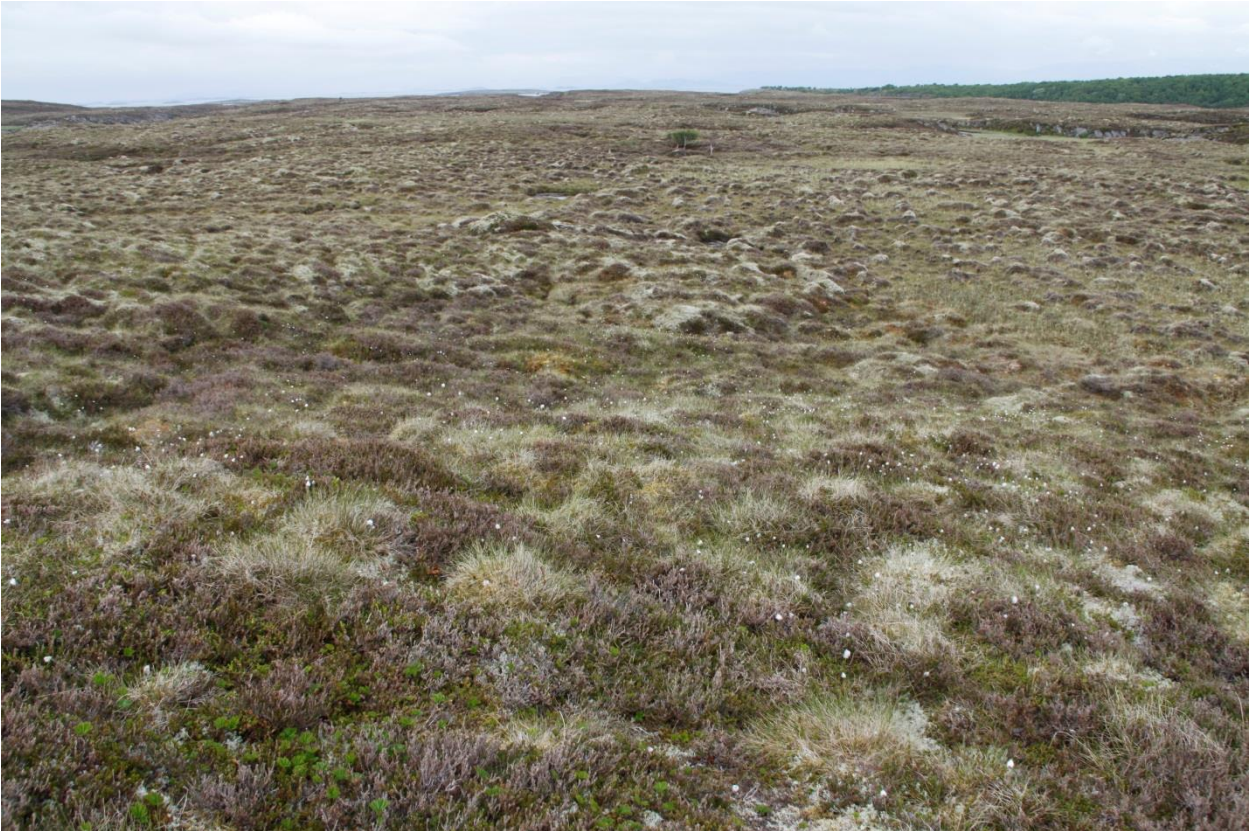
Bilde 7: Lyngheia på Torsøya er helt åpen, uten tegn til gjengroing av busker og kratt. En av de fineste lyngheiene i Vega, og på Helgeland forøvrig.