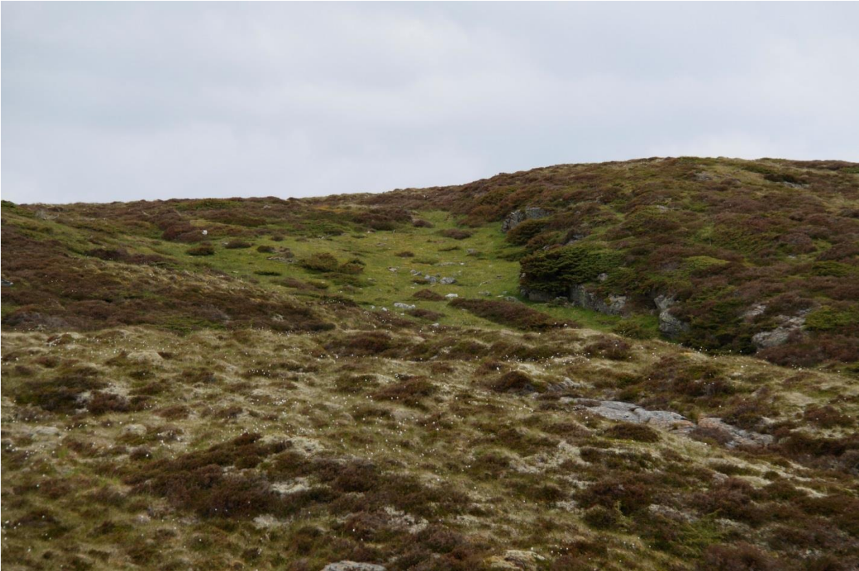
Bilde 3: Lynghei og flekker med naturbeitemark ved «Klubben» i den nordvestlige delen av Torsøya