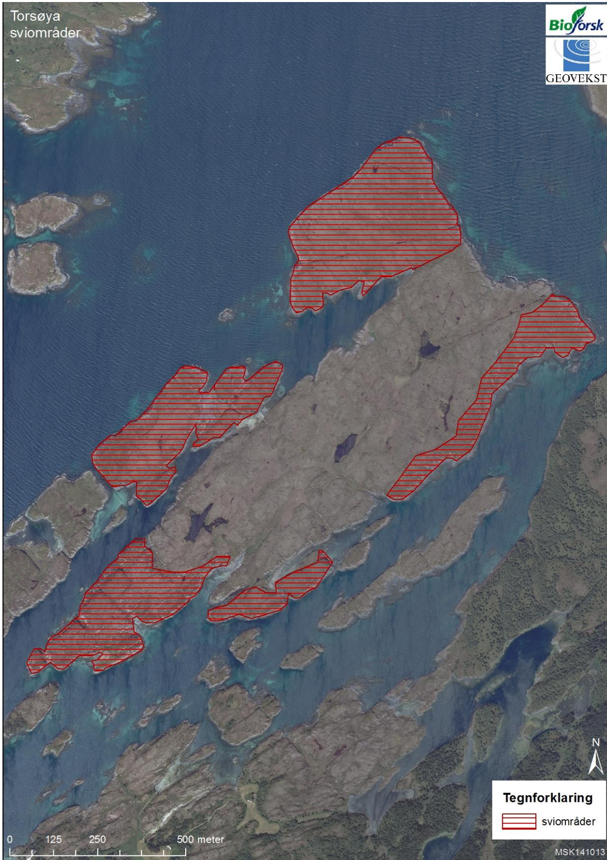
Figur 3. Ortofoto viser områder som anbefales å svis på Torsøya. I skraverte felt er røsslyngen gammel, sviing er velegnet på grunn av terrengformasjonene, og vegetasjonsdekket er tett. I disse områder vil det derfor være mulig at få fyr på vegetasjonen. Resultatet vil gi et bedre beitegrunnlag. Kartet må sees i sammenheng med retningslinjer for sviing (vedlegg 4).