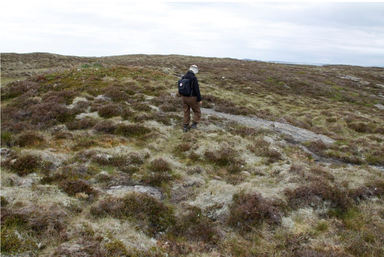
Bilde 2: Hele øya er dominert av røsslyng. I de tørreste partiene dominerer også heigråmose