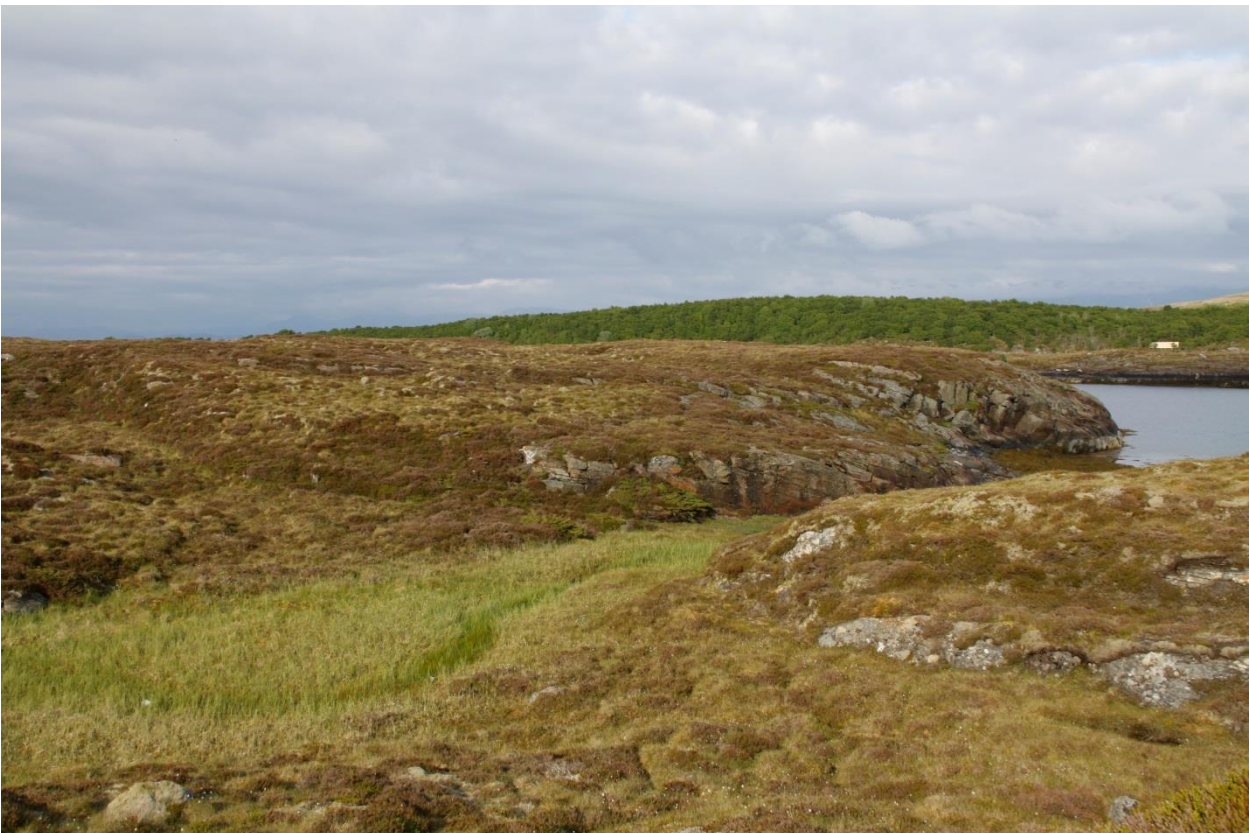
Bilde 8: Lite myrparti i spesielt røsslyngrikt område på østsiden av Torsøya. Legg merke til lauvskogen og gjengroinga på nabøya. Torsøya hadde også vært slik uten det kontinuerlige beiterregimet.