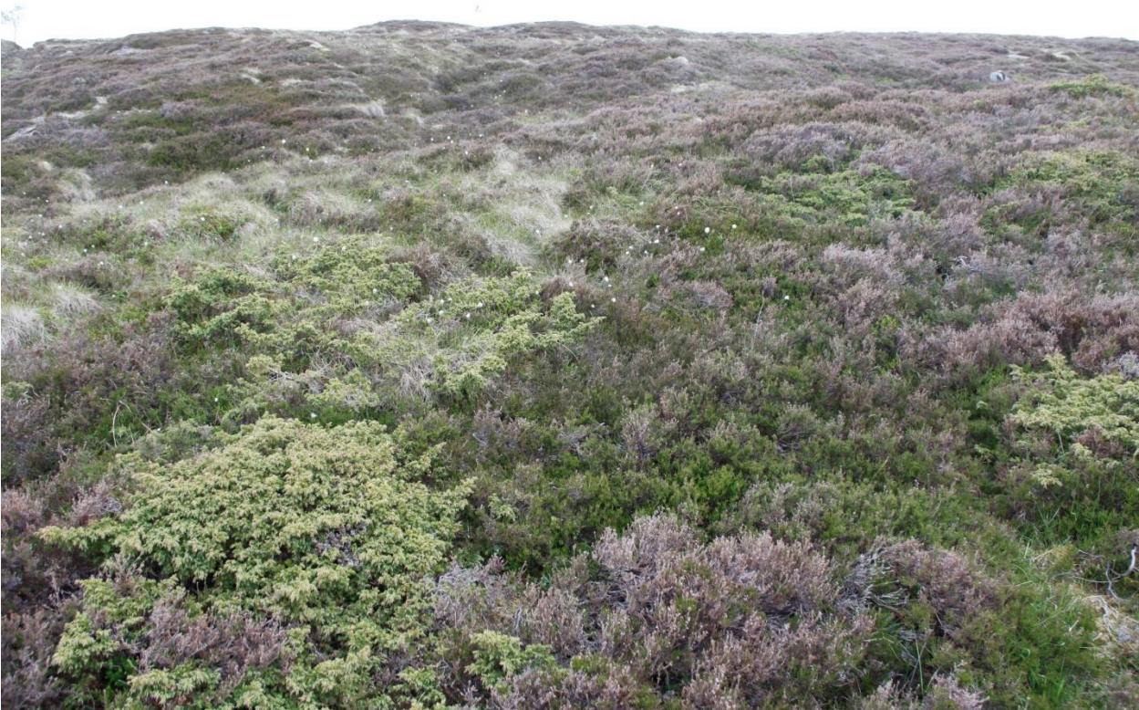
Bilde 1: Fin forekomst av røsslyng på den østlige delen av Torsøya. Her er det en god blanding av både ung og gammel røsslyng. Einer vises godt på dette bildet men er generelt så godt som fraværende på øya.