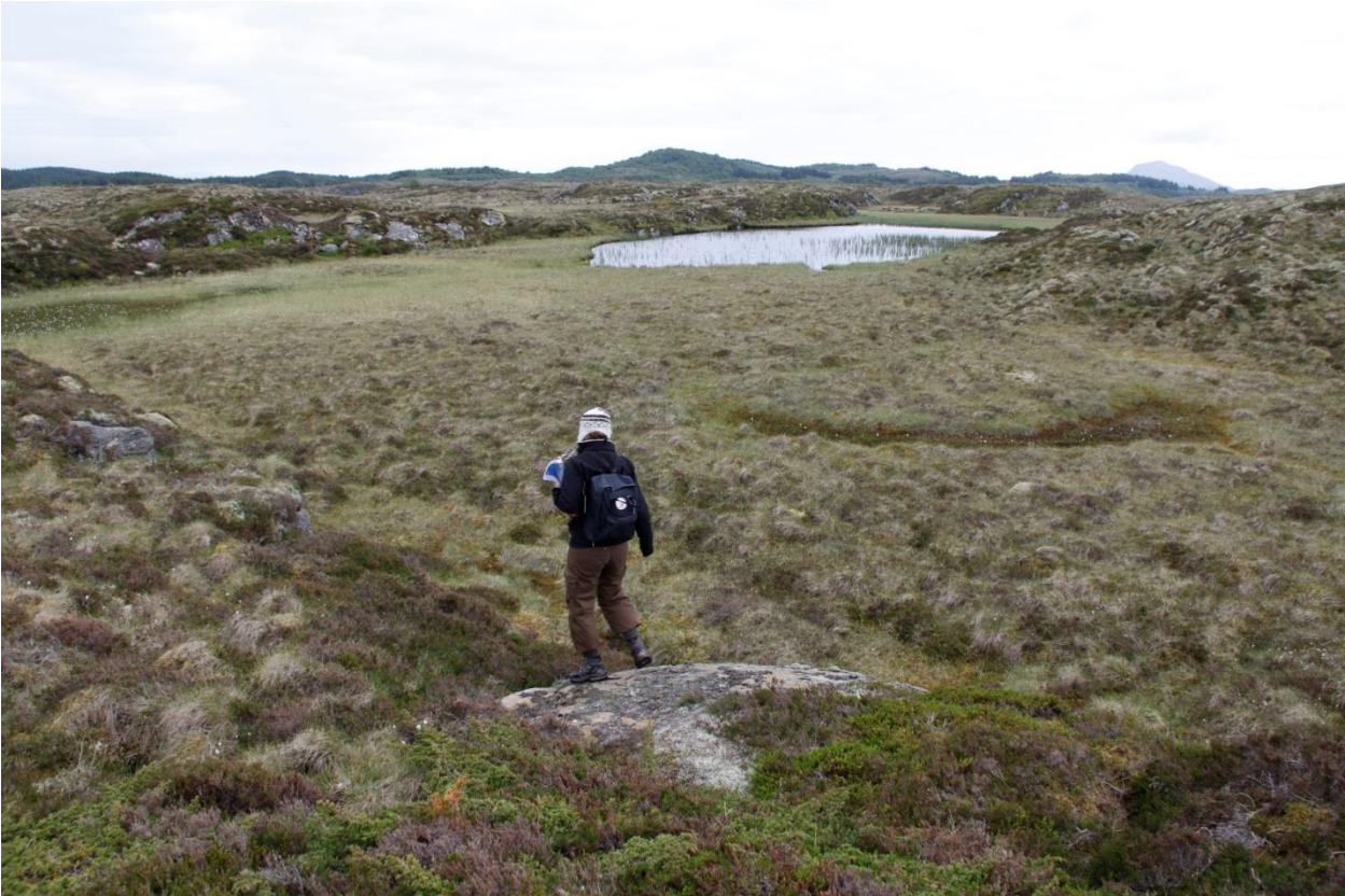
Bilde 5: Et relativt stort våtmarkskompleks med myr, starrsump og åpent vann med noe vannvegetasjon finnes på sørsiden av Torsøya. Dette er et viktig område for flere fuglearter som ulike gressender, lommer og vadere.