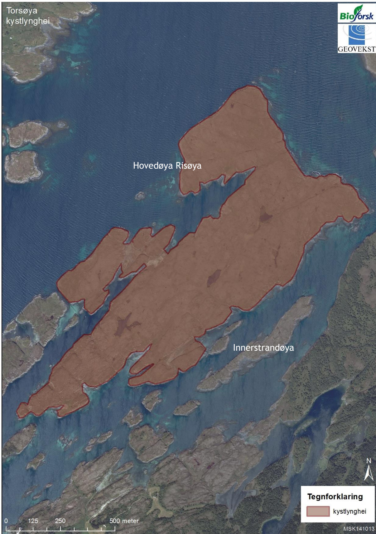
Figur 1. Oversikt over avgrensingen av naturtypen kystlynghei i naturbase for Torsøya.