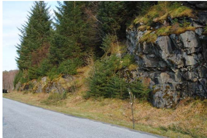
Figur 5.3. Sitkagran sprer seg også i lauvskog (til venstre) og på forsyrrer mark som f.eks langs en veikant til høyre.