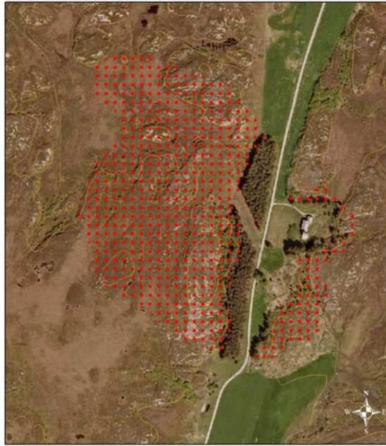
Figur 5.1. Flyfoto av en sitkabestand på Tarva plantet i 1964. Bestandet vest for vegen utgjør ca 10 daa. Den viktigste spredningssonen er markert med rødt og utgjør ca 80 daa. Tettheten av ungplanter av sitkagran i spredningsfeltet ble estimert til 1550 planter pr daa.