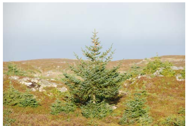
Figur 5.2. Spredning av sitkagran i kystlynghei på Tarva. I bilde til høyre ser en et individ som har spredt seg et stykke bort fra plantefeltet og allerede er i gang med å sette nye frø.