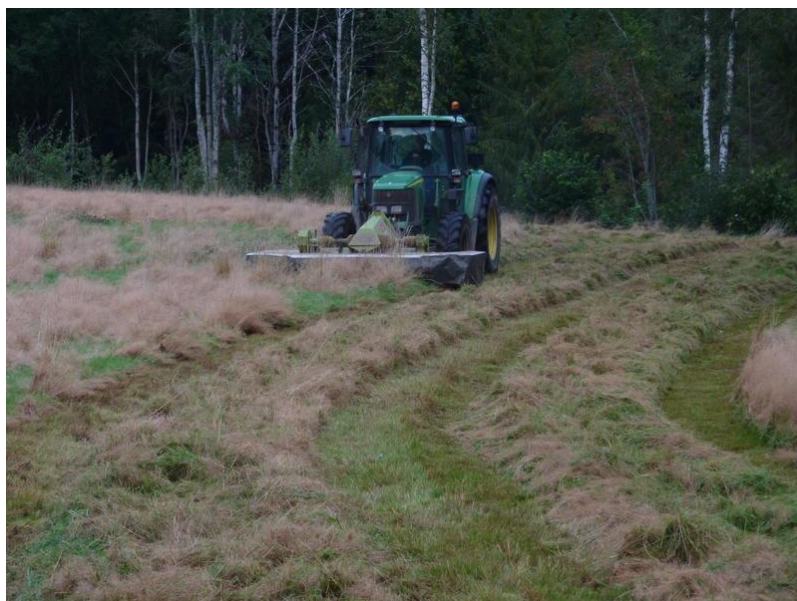
Bilde 1. Skårlegging av engkvein i Vestfold, 2009.

to gangers tresking er den beste høstemetoden i engkveinfrøeng, og at vi ikke bør vente for lenge utover høsten slik at frøenga blir kraftig gjennomgrodd og behovet for nødløsninger oppstår.