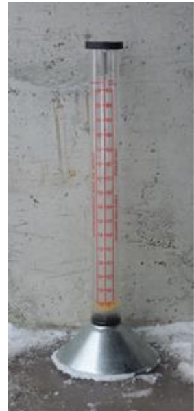
Bilde 2. Vestfold frøavlerlag disponerer dette flowmeteret.

Rask nedtørking av råvaren etter tresking er svært viktig. Vi bør unngå å treske fulle tilhengerlass og heller få frøet på tørka innen det er gått et par timer etter tresking. I starten er det viktig å følge godt med på tørka; ved antydning til varmgang må massen spas om / rulleres. Viftene kjøres døgnet rundt inntil vanninnholdet er kommet ned i ca 18%, deretter slås viftene av om natta og kjøres bare når luftfuktigheten er lav midt på dagen. Frøet skal tørkes til 12% vann tilsvarende en relativ luftfuktighet rundt 50%. Ved tresking i september kan dette by på problemer. Mot slutten av tørkeperioden kan vi gjerne bruke en vifteovn for å øke temperaturen og dermed redusere luftfuktigheten i tørkelufta. For hver grads temperaturstigning vil fuktigheten i tørkelufta gå ned med fire prosentenheter.