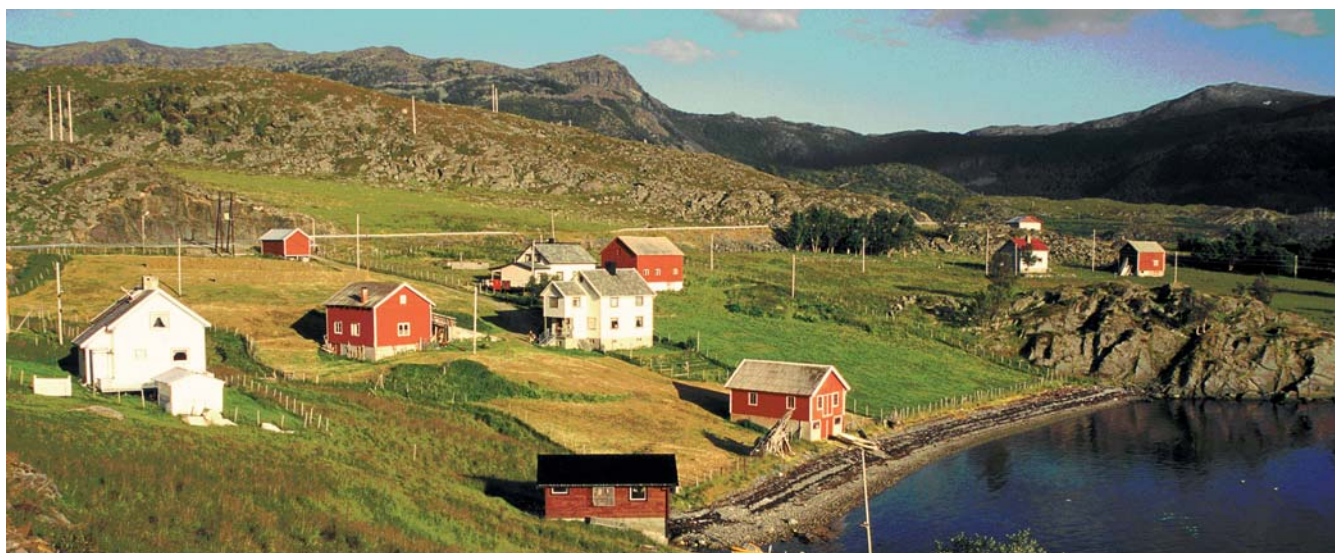
Når de aller siste brukerne i ei grend gir seg er det ofte ingen igjen til å overta. Foto: O. Puschmann, Skog og landskap.

Avstanden fram til nærmeste nabobruk øker automatisk for gjenværende bruk når naboene rundt legger ned. Når stadig flere gårder legges ned fortynnes også de aktive jordbruksmiljøene. Særlig sårbare er områder hvor det etter hvert ikke fins flere potensielle leietagere igjen innen en "rimelig" reiseavstand. Slike områder ses av enkeltbruk med rød farge på kart over Nordland på neste side. Når et slikt "rødt bruk" legger ned, legges ofte hele grenda ned. I Nord-Norge er det etter hvert blitt mange grende- og bygdelag som har gått ut av drift, og flere steder er tidligere velutbygde jordbruksnettverk i ferd med å rakne.