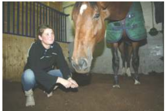
Hesteboks med torvstrø.

Torvstrø kan også ha uheldige egenskaper. Mye fine partikler i massen kan lett utløse mye støv. Her må det påpekes at når torva støver, så er den for tørr. Med et vanninnhold på 50 % skal ikke støv være et vesentlig problem. Dersom vanninnholdet blir mindre enn 40 % vil støvmengden øke betydelig. Det er derfor viktig å sjekke tørrstoffinnholdet i torva. Andre forholdsregler: