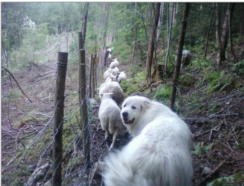
Figur 1. Essyl på patrulje rett utenfor havnehagen.

Bruk av vokterhund i utmarka hadde derimot ikke merkbar skadereduserende effekt beitesesongen 2008, og heller ikke i 2009, til tross for det intensiverte tilsynet. I 2008 mistet Haugan totalt ti lam til gaupe i utmarka (utenfor det inngjerdete beitet), mot 13 lam i 2007 (Hansen 2009).