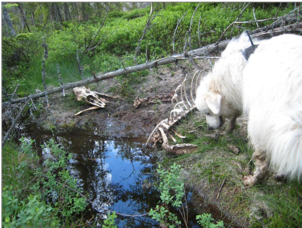
Figur 2. Vokterhundene kan også trenes opp til å finne kadaver (foto: B. Haugan).

Vokterhund brukt både på patrulje og til kadaversøk i utmarka er en interessant kombinasjon som benyttes aktivt bl.a. i Hattfjelldal, Rauma og Vestre Gausdal kommuner (Hansen og Hind 2009). Erfaringene som er innhentet av Hansen og Hind indikerer at pyreneerhundene er gode til å finne kadaver sett i forhold til treningsinnsatsen. Det finnes kurs i kadaversøk som kan anbefales (Hansen og Hind 2009, Smestad 2009). Bioforsk er av den oppfatning at det burde være fullt mulig å trene opp Essyl til effektivt kadaversøk (fig 2).