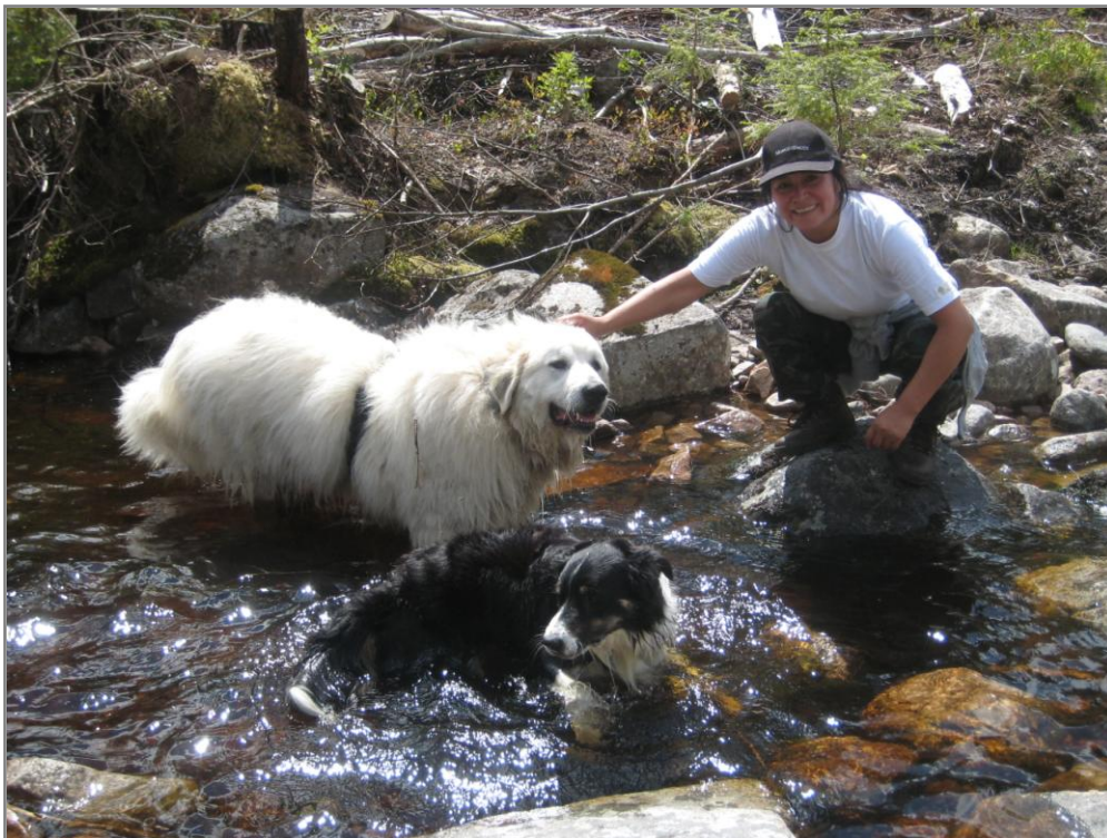
Figur 3. Det er godt med et avkjølende bad i varmen!.

Uke 26 og til dels 27 var svært varme. Essyl ble passiv på grunn av varmen, var veldig sliten og varm og la seg ned så fort hun kom i skyggen. Til slutt nektet hun å være med på tur (fig 3).