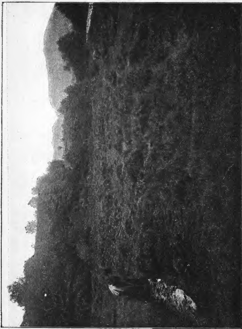
Grøftning av myr paa Skjold i Fane.