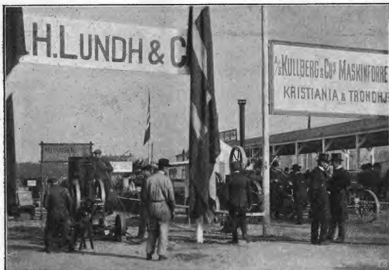
Torvbruksavdelingens maskinutstilling. *) Landbruksmøtets høstutstilling, Kristiania 1908.