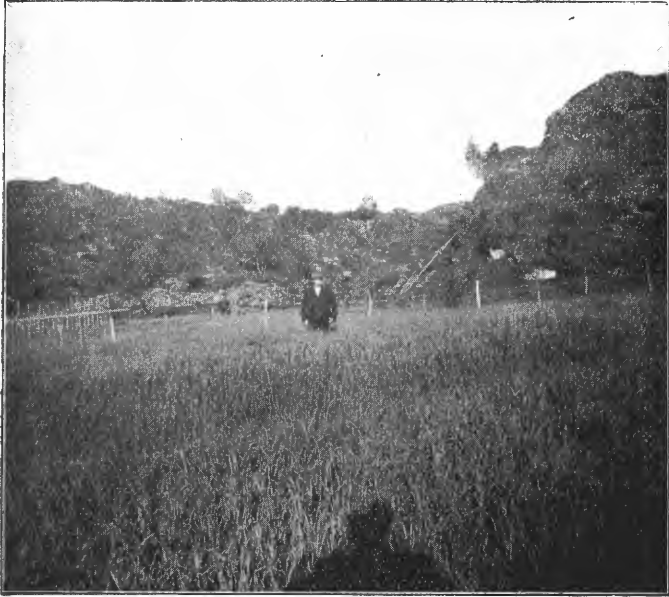
Bernæsmyren. 2det aars timotei 3 aar efter opdyrkingen.