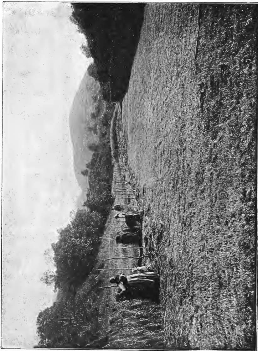
Den samme myr opdyrket, høsten 1909.