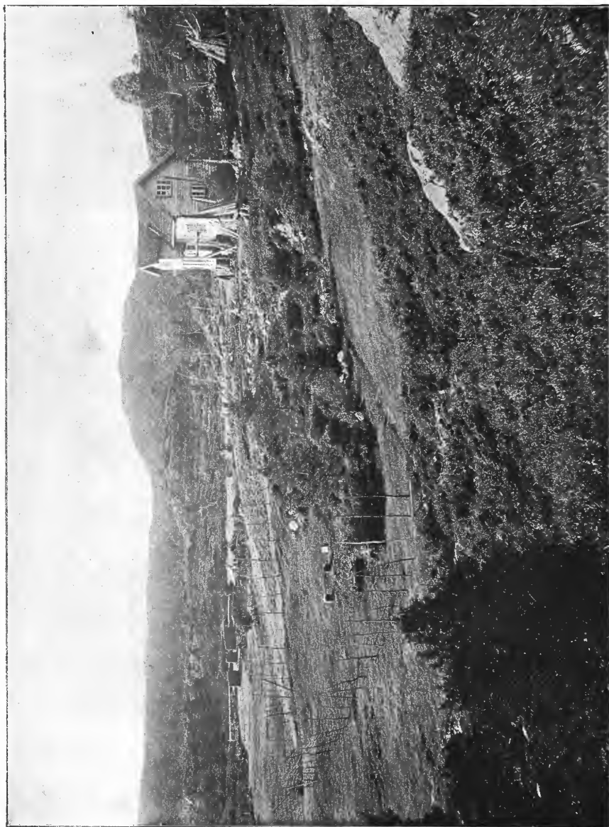
Nydyrking paa Raamyren i Fane.