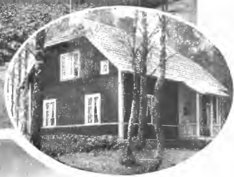
Flahult forsøkstation: Myren som den var, inspektørbolig og endel av den opdyrkede myr.