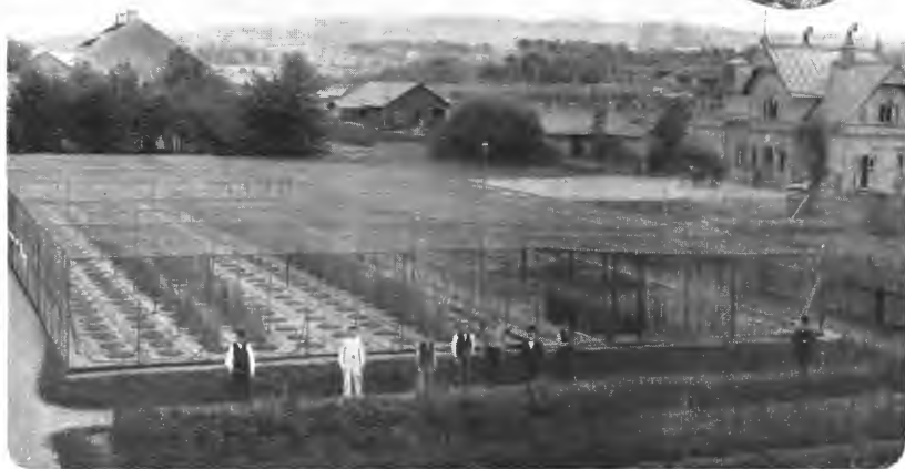
Administrationsbygningen i Jönköping. Buste av C. von Feilitzen. En del av vegetationsgården.