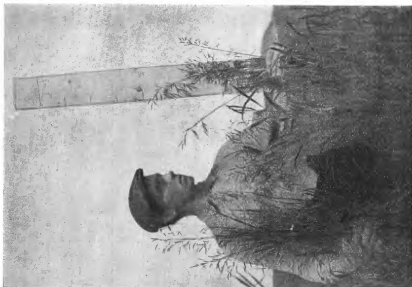
Fig. 10. Svingelfaks, Mæresmyren 1914.