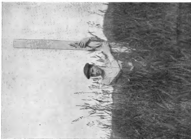
Fig. 11. Strandrør, Mæresmyren 1914.