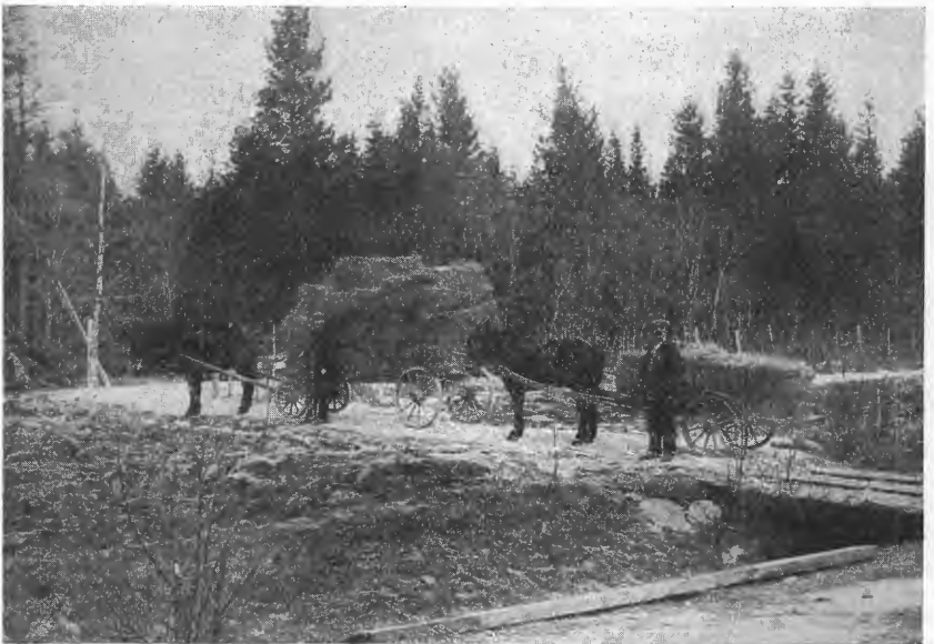
Fig. 16. Aarlig avling pr. maal 5. og 6. aar for II, III, IV og V. Første lass: Avlingen efter aarlig vedlikeholdsgjødsling med fosforsyre og kali. Andet lass: Avlingen efter samme grundgjødsling og kvælstofgjødsling, men uten kali- og fosforsyre-gjødsling siden anlægsaaret.