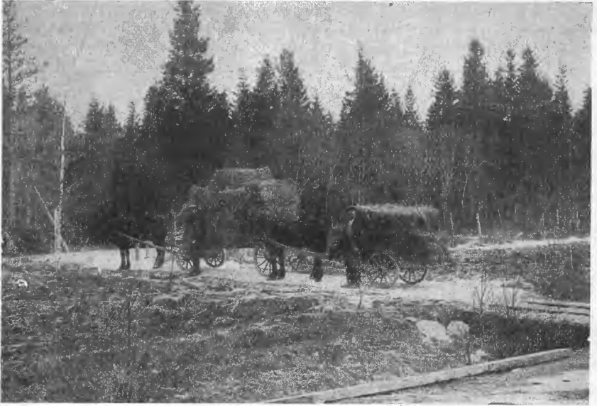
Fig. 15. Aarlig avling pr. maal 2—6 aar for II, III, IV og V. Første lass: Avlingen efter aarlig vedlikeholdsgjødsling med fosforsyre og kali. Andet lass: Avlingen efter samme grundgjødsling og kvælstofgjødsling, men uten kali- og fosforsyre-gjødsling siden anlægsaaret.