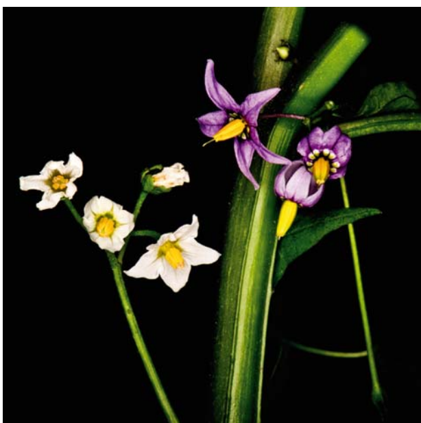
Både svartsøtvier (hvit) og slyngsøtvier (fiolett) er mottakelig Solanum -arter og oppformerer hvit PCN.

For hvit PCN er potet den viktigste vertsplanten under norske forhold. Det finnes i dag ikke helt resistente potet-sorter mot denne nematoden. Dessuten kan den også oppformerer på tomat og eggplante. Ugrasartene villrot, belladonnaurt, piggeple, slyngsøtvier og svartsøtvier er også vertsplanter.