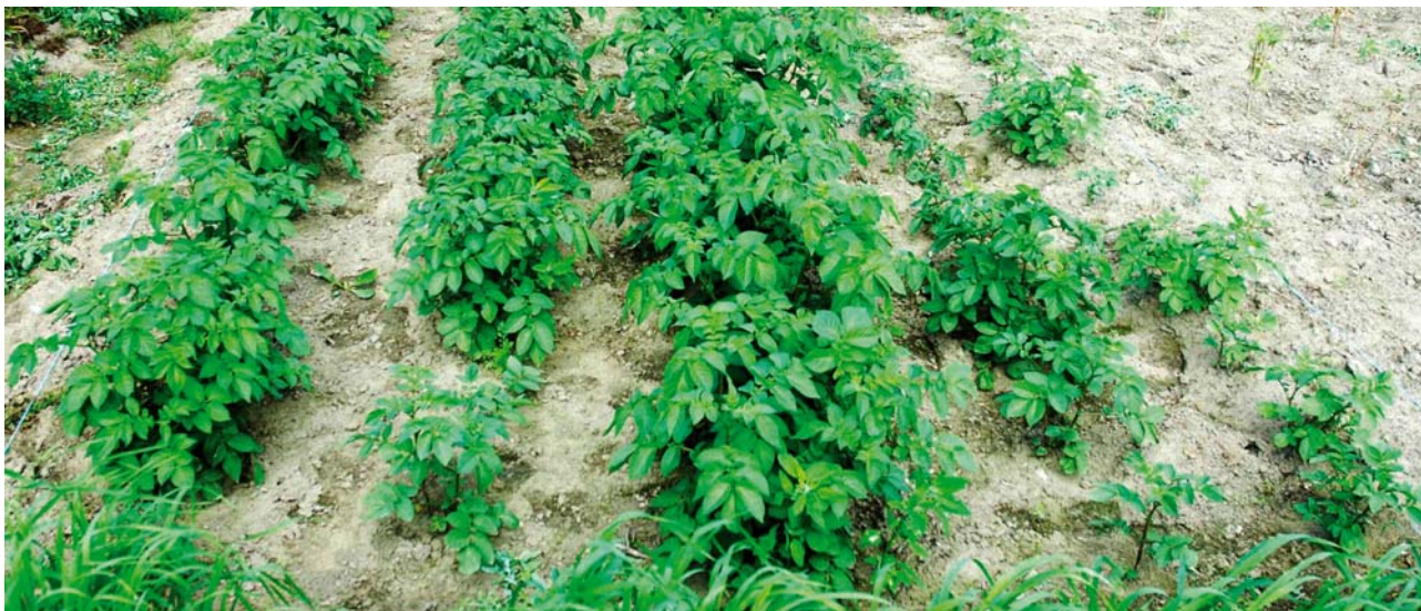
Potet (cv. Laila) med angrep av hvit PCN fra Stjørdal.