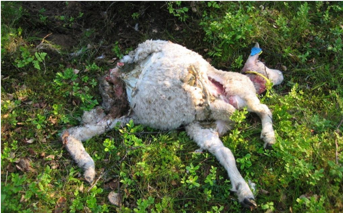
Lam dokumentert drept av rødrev.