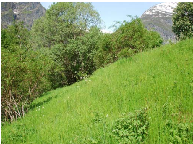
Figur 4.9 Framleis finnest ei god førekomst av gullhavre på delområdet

Delområdet (Fig. 4.8, 4.9, 4.10) skil seg noko frå dei andre ved at det er tørrare og noko meir sørvendt. Feltsjiktet er mindre høgvakse i dette delområdet og det har meir preg av urter (Fig 4.11a). I våraspektet vert dei øvre og tørraste delane av lokaliteten dominert av gullhavre. Her finnest dessutan tviskjeggveronika, blåklokke, ryllik, gulaks, nyresoleie ( Ranunculus auricomus ), gjerdevikke ( Vicia sepium ), skogstorkenebb ( Geranium sylvaticum ), skogstjerneblom ( Stellaria nemorum ), skoggråurt ( Omalotheca sylvatica ) og engrapp ( Poa pratensis spp. pratensis ). Ein kan og finne enkelte individ av vårmariland ( Orchis mascula ) (Fig. 4.11b), men fleire av individa er undertrykte på grunn av det stadvis tjukke strøsjiktet.