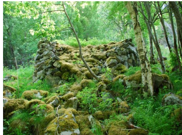
Figur 4.14. Rydningsrøysa på biletet har vore spesielt forseggjort og bør restaurerast

Delområdet strekkjer seg vidare nordover gjennom eit lite søkk der fuktvegetasjon i dag dominerer (Fig. 4.17), og vidare gjennom eit lite ospeholt og ned lia mot hamrane på Inste Skagenobba. På heile dette området finn ein eit stort tal rydningsrøyser og bakkemurar. Både ospeholtet og bjørkeskogen ned gjennom lia er relativt lysopen slik at finn fleire engarter i feltsjiktet. Her finn ein òg liljekonvall ( Convallaria majalis ). I det fuktige søkket dominerer hegg, rogn og selje saman med bjørk. I feltsjiktet dominerer mjødukt, engsnelle, storklokke, tyrihjelme og hundegras. Ein kan og finne meir varmekjære artar som hassel på tørrare stadar.