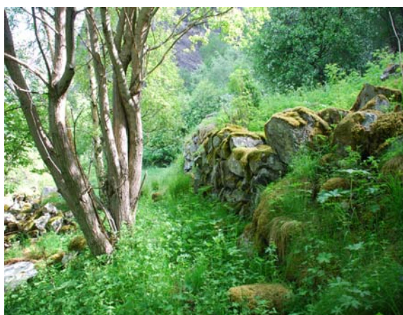
Figur 4.13 Dei fremste delane av muren er skada av utrasa stein, truleg frå rydningsrøysa ovafor

I dag er det vanskeleg å få eit heilskapleg inntrykk av korleis frukthagen ein gong har framstått. Vegetasjonen er prega av eit høgvakse feltsjikt og området er over store delar overgrodd av kratt og lauvskog. Når ein beveger seg inn i området så vert ein først møtt av nokre steinkonstruksjonar som er imponerande når ein ber i minnet den reiskapen dei tidlegare brukarane rådde over til rydding og dyrking i det tidlegare jordbruket. Konstruksjonen er samansett av ein bakkemur og ei oppmura rydningsrøys. Bakkemuren har ei lengd på om lag 25 m og største høgd på 3,5 m (Fig. 4.12; 4.13), og endar i eit ugjennomtrengelig kratt av humle, hegg og rogn. Muren er i ganske bra stand, men mindre delar er raste ut i sør. Rydningsrøysa (Fig. 4.14) er oppmura sylindrisk med større steinar i ytterkant, inni er det fylt på med mindre stein. Dessverre er