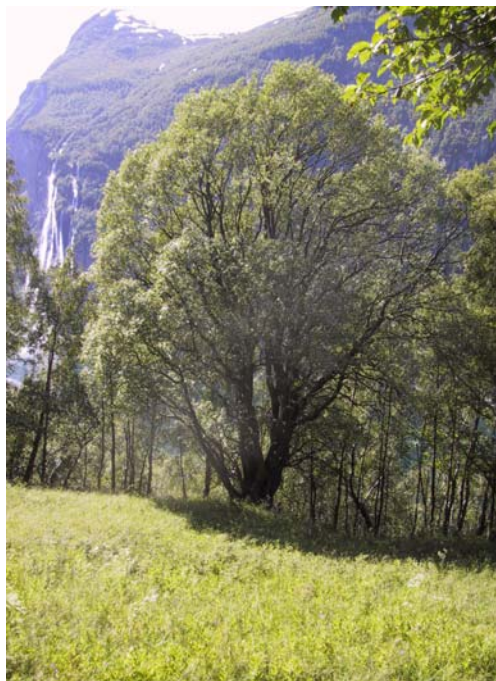
Figur 4.1. Gamle seljer som denne i nerkant av Svøra kan vere vanskeleg å omdanne til styvingstre, men den kan vere verdt eit forsøk. Viss ikkje må heile treet vekk for å betre innsyn frå fjorden.

Randområda er viktige ut i frå eit biologisk synspunkt, da ein her kan finne restar av den engvegetasjonen som har hatt lengst kontinuitet på Skageflå. Størparten av randområda er i dag dekt av glissen lauvskog. Randområda har mindre næringsinnhald i jorda, og dei skil ein lett ut i felt på lågare og mindre tett feltsjikt, og fråvær av artar som stornesle, bringebær, hundegras, hundekjeks og strandrør. Det er særst viktig at ein ikkje tilfører desse områda organisk avfall t.d. gjennom gras eller kvist frå anna areal, slik at dei ikkje vert gjødsla og dermed øydelagt over tid.