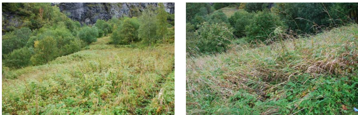
Figur 4.4. Delområde 1, Langåkern er det største av delområda. Dei sentrale delane er framleis opne, men frå begge kantane er skog og kratt i ferd med å invadere området. Både felt og strøsjiktet er svært tett.

av tak på øvre deler av delområdet. Dette burde ha vore sådd til t.d. med oppsop av gammalt frø frå låvegolv dersom dette let seg finne, eller ei eigna urterik frøblanding. Også bakkane opp mot delområde 2 og 3 er inkludert i D1. Det er vanskeleg å komme til med motorslåmaskin i den brattaste delen av bakken nær sti og driftsveg på grunn av mykje stein. Desse delane bør likevel ryddast for tre og slåast med ljà. Lengre nedover er bakken betre rydda slik at det er mogeleg å komme til med motorslåmaskin og få til ei fin samanheng mellom delområda.