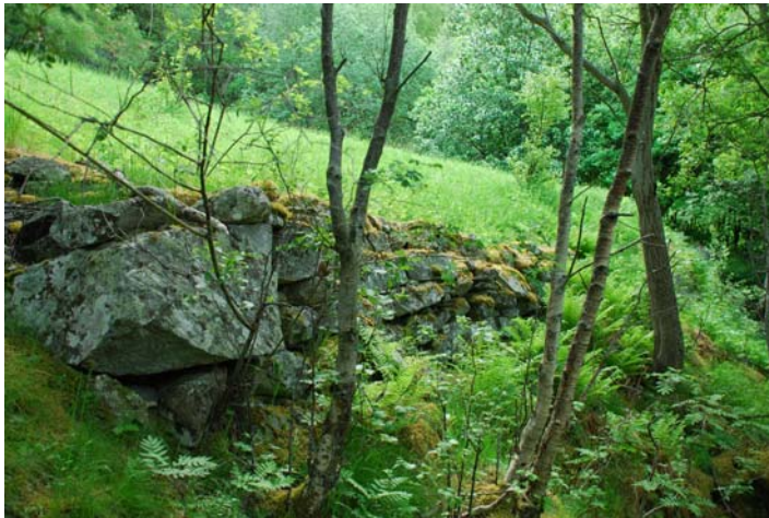
Figur 4.10 Bakkemur i nedre kant av delområdet markerer ytre grense for slåttearealet, men tre som veks inntil bakkemurar slik som på bildet bør ryddast bort.

Næringsinnholdet er noko mindre enn det som vart målt i Langåkeren, og skil seg først og fremst ut ved at fosforinnholdet er lågare. Det ligg på høvesvis 3,1 og 3,2 mg/ 100g jord i sjikt 1 og 2. Også innhaldet av plantetilgjengeleg nitrogen er noko lågare enn på Langåkeren, mens innhaldet av totalnitrogen er om lag på same nivå, noko som indikerar at ein større del av nitrogenet er bunden i organisk materiale og først vert tilgjengeleg for plantene gjennom nedbryting og mineralisering.