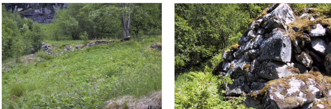
Figur 4.5. Bakkemurane i delområdet har til dels store dimensjonar