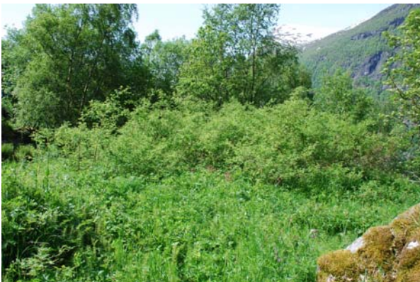
Figur 4.15 Den vesle sletta på biletet bør ryddast slik at den vert inkludert i slåttearealet