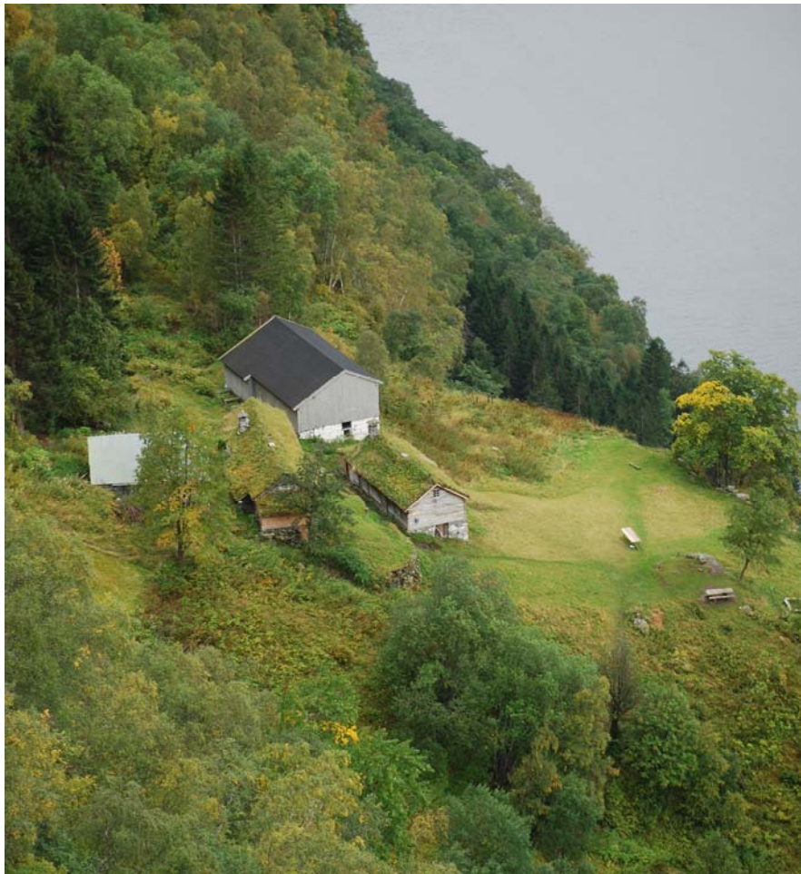
Figur 4.7. Husa på Skageflå med delområde 3 og 4

Langs bergkanten lengre ned er ein del bjørk i ferd med å etablere seg. Desse bør ryddast før dei vert for store og uhandterlege. Etter hogst bør stubbane behandlast. Det må i tilfelle nyttast sikring og utvisast stor aktsemd ved eit slikt arbeid.