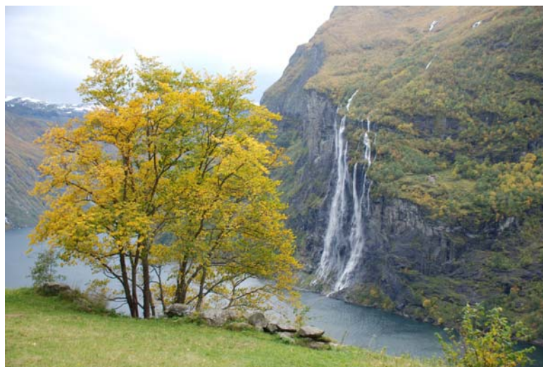
Figur 4.6. Utsyn frå delområde 2 mot Knivsflå og dei sju søstrane

Delområdet (Fig 4.7) har vore regelmessig slått og raka årleg i lengre tid av grunneigarane, med unntak av ein snipp fram mot bekk i dei søndre delane av stykket. I våraspektet dominerer gullhavre dette stykket, men innhaldet av urter er lite. Delområdet vil vere utsett for mykje trakk av vitjande, og skjøtsel av området kan stort sett halde fram som tidlegare. Det vert likevel føreslått ein kort restaureringsfase for å bringe utviklinga på dei delane av stykke som er sett tilside under kontroll. Det store almetreet heilt på kanten av stupet har gjeve grunn til bekymring (Fig. 4.6). Krona er i ferd med å vekse seg stor, og det er grunn til å frykte at treet ein gang i framtida vil styrte utfor kanten og ta med seg delar av jorda frå stykket innafør. Ein bør følgje utviklinga på dette treet nøye.