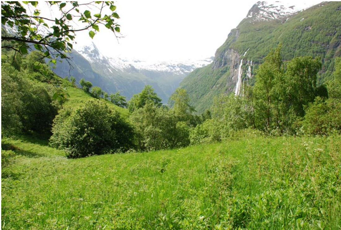
Figur 4.8. Begynnende invasjon av bringebær og hundekjeks i nedre del av delområdet.