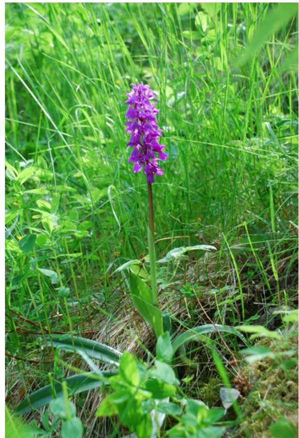
Figur 4.11b. Her kan ein og finne enkelte individ av vårmarihand