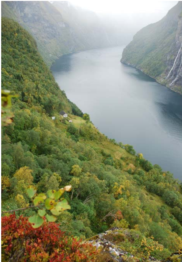
Figur 1.1: Store deler av fjellhylla der Skageflå ligg er no grodd igjen, men delar av den opphavlege innmarka er framleis relativt ope.

Hyllegardane langs Storfjorden i Møre og Romsdal og andre fjordar på Vestlandet med det tilhøyrande brukslandskapet er noe av det mest særleine og spektakulære den norske kulturlandskapsarven har gitt oss. Mange reisande, helt sidan Hans Strøm (1766) besøkte Geiranger i 1750-åra, vert imponert over at folk busette og livberga seg på desse gardane gjennom generasjonar (Nissen 2004). Skageflå i Geiranger er den største blant hyllegardane i Storfjorden, og den ligg på ei fjellhylla ca 250 m.o.h. med utsyn over fjorden og Dei sju søstre, midt i Geiranger – Herdalen landskapsvernområde og det nyoppretta Verdsarvområdet Vestnorsk Fjordlandskap. Busettingshistoria strekkjer seg så langt det er kjend tilbake til 1613 då garden for første gang er nemnd i skriftlege kjelder, men garden er truleg eldre. Skageflå vart fråflytta i 1918, men deler av jordbruksarealet vart hausta fram til 1969 (Olav Kjell Homlung, pers med.).