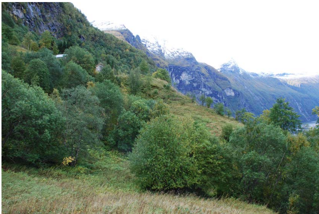
Figur 4.18. Høla og dei øvrige delane av delområde 6 er dei mest attgrodde på Skageflå. Her vert det føreslege å konsentrere tilaka om dei engareala som framleis er opne samt å omdanne eigna treslag til styvingstre.

Dette er eit samansett delområde (Fig. 4.18). Den delen av området som vert kalla Høla er ei forseinking i terrenget der det ligg mykje laus stein og fleire store rydningsrøyser. Midt gjennom delområdet går det ein liten bekk. Heile delområdet er kraftig prega av gjengroing med eit høgt og tett feltsjikt og skog og kratt har invadert store deler av arealet. På deler av arealet har humle spreidd seg inn frå kantane og dannar eit flettverk i feltsjiktet. Det er fuktig jord på stykket og artssamansetjinga er lik den ein finn på delområde 1. Det er ikkje knytt store biologiske verdiar til arealet som i dag er gjenvakse av skog og kratt og det påverkar i liten grad innsynet frå fjorden. Det vert derfor føreslege å avgrense skjøtsel og restaurering til det som i dag er open grasmark og la krattet og skogarealet stå på resten av delområdet og i staden nytte desse delane til avfallsplassar for å unngå eutrofiering av meir verdifulle område andre stadar. Ein bør likevel rydde ein del kratt og skog langs kantane av dagens engareal, og omforme det som er av selje til styvingstre, men dette er ei vurdering ein må ta ut i frå økonomiske og arbeidsmessige omsyn. Driftsvegen som går gjennom stykket vert omtala for seg.