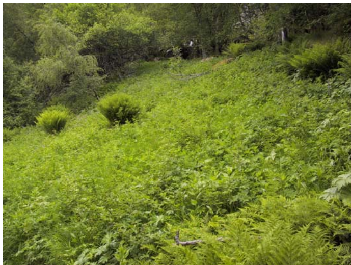
Figur 4.19. Invaderande skogsartar i øvre del av Flatåkeren. Framtidig slåtteareal bør avgrensast til det som i dag framleis er ope.