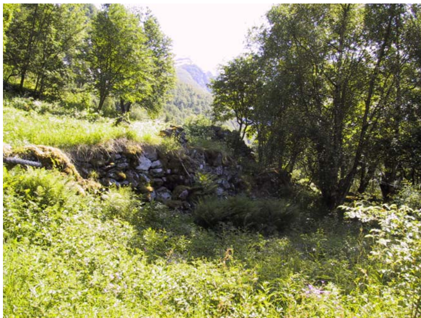
Figur 4.12. Del av bakkemur ved inngangen til delområdet. Skjøtselen av delområdet bør avgrensast til engareala som omgir denne. Trea nedanfor bakkemur må ryddast vekk.

Dei sentrale delane av dette området har tidlegare vore nytta som frukt- og nytteveksthage. Blant nyttevokstrane som framleis finst her er det først og fremst humle ( Humulus lupulus ) som ser ut til å trivast og har spreidd seg over store områder. Elles finn ein her ein busk av krossved ( Viburnum opulus ). Det er ikkje kjent omfattande bruksutnytting knytt til krossved ut over at veden er velegna til å lage tenner i vevskeier av (Jonsson 1983). Derimot har humle ei lang historie som nytteplante både til brygging av øl og som medisiplante. I middelalderen vart gardeigarane endatil pålagd å dyrka humle, ei plikt som vart gjentatt så seint som på midten av 1700-talet (Jonsson 1983). Kanskje stammar den rike førekomsten av humle på Skageflå tilbake til denne pliktdyrkinga?