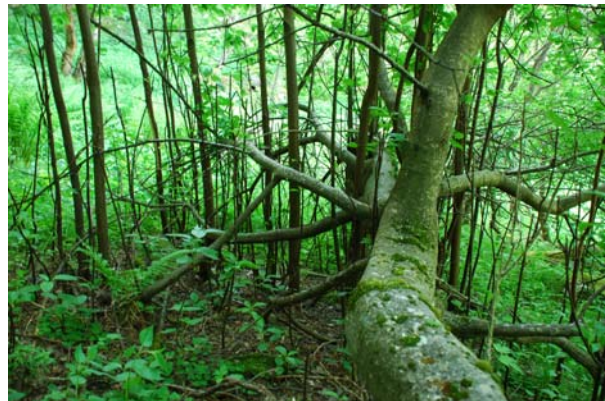
Figur 4.16 Ein velta hegg syner god evne til å sette nye skot frå greinar som kjem i kontakt med jord. Rotvelt av alle lauvtre, og spesielt hegg, må derfor ryddast vekk dersom dei ligg i eit delområde. Dersom dei fell utafør eit areal som vert skjøtta gjennom slått må snittflata behandlast kjemisk.