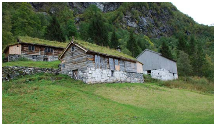
Figur 2.1: Dei nyrestaurerte husa på garden

korndyrkinga opphøyrd vart dei tidlegare åkrane nytta til grasproduksjon slik at behovet for hausting av t.d. myrslåttar og andre slåttemarkar i utmark vart redusert. Skageflå vart delt i to bruk i 1874, men i løpet av dei siste åra før bruket vart fråflytta i 1918 (Ansok 1985, 1992) vart desse bruka slått saman slik at det igjen var berre ein brukar på Skageflå. Gjennom revolusjonen av jordbruket og industrialiseringa av landet på slutten av 1800-tallet fekk ein også ei omlegging av drifta på Skageflå. Den siste brukaren gjekk over til å satse på geit og hadde kring 1910 118 geit, 70-80 sau og lam, 4