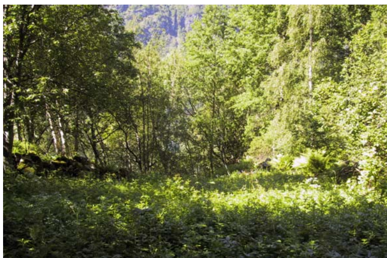
Figur 4.17 Restaurering av engareal i dette fuktsøkket og områda nedanfor er ikkje føremålsteneleg ut i frå ressursomsyn. Ein bør likevel følgje utviklinga i området og rydde stormfelte tre.