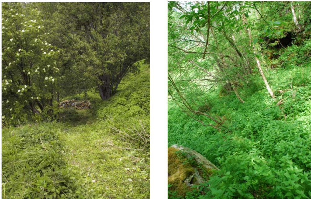
Figur 4.21. Til høgre utsnitt av driftsveg frå Langåkeren opp til husa. Vegen vert i dag lite nytta også av fotturistane, men kan med litt rydding og regelmessig slått igjen verte teken i bruk. Den store selja ovafor vegen bør omformast til styvingstre, elles bør trea ryddast vekk. Til venstre nedre del av driftsveg inn til Svøra, med litt rydding vert også denne farbar.

Driftsvegane på Skageflå er korte og relativt lite opparbeidde (Fig. 4.21). Alle desse vegane bør restaurerast og seinare slåast for å lette det framtidige skjøtselsarbeidet og betre tilgjengelegheita mellom delområda. Dette gjeld og vegen mot delområde 7. Store deler av desse vegane er relativt intakt og vert farbar med litt bortrydding av utoverhengjande tre og nokre nedraste lause steinar. I dårlegast forfatning er vegen mot Svøra der den kryssar bekk. Her ligg det en del utglidd masse som bør fjernast og ein del stein. Det er usikkert om det tidlegare har vore bru over bekken, men dette bør vurderast for å betre framkommelegheit med t.d. motorslåmaskin. Etter restaurering vil spesielt denne vegen kunne få stor betydning i det framtidige skjøtselsarbeidet. Dei øvrige driftsvegane er i betre stand, men det er synd at stien no går utanom driftsveg både opp til garden og frå garden og opp Bjønnstien.