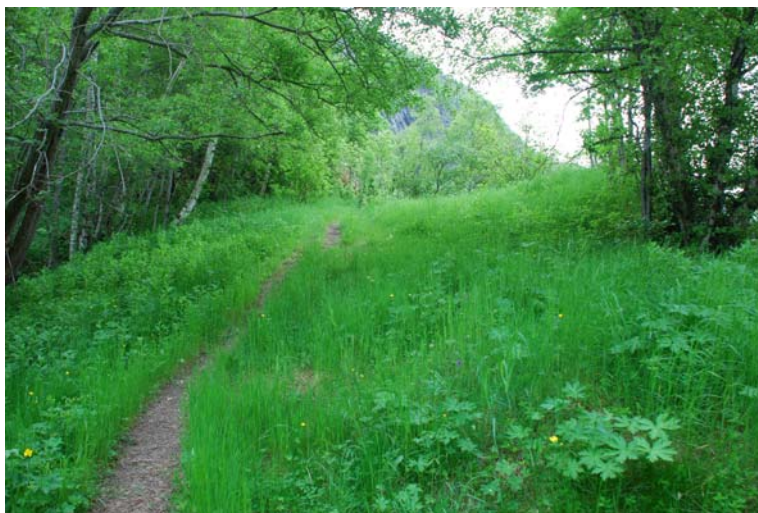
Figur 4.20. Frå øvre del av delområdet ved overgangen til delområde 1. For å betre innstråling til engplantane bør tre sørvest for sti ryddast vekk der ein seinare kjem til med slått. Alm kan få stå. Slåttearealet bør utvidast slik at også dei nedre delane vert inkludert.