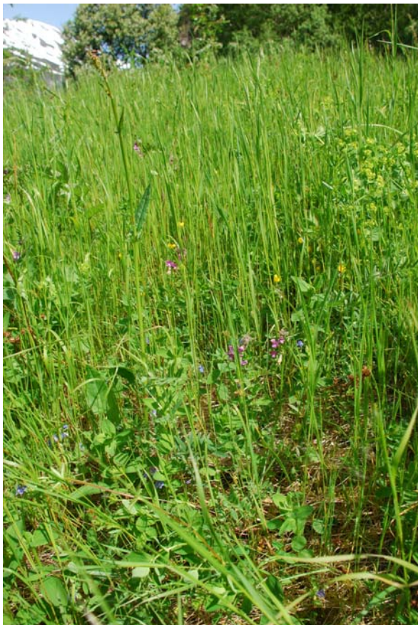
Figur 4.11a. I våraspektet er artsmangfaldet stadvis ganske rikt

låg til å ha kunne fungert som eit reelt stengsel for dyr. Truleg har konstruksjonen eit opphav i ein bakkemur, men har seinare vorte påmura ut i frå eit behov i å kvitte seg med nedrast stein. I nedre kant av området ligg ein større bakkemur som er omlag intakt. Det ligg og nokre tømmerrestar her av ukjent opphav, desse bør få liggje urørt.