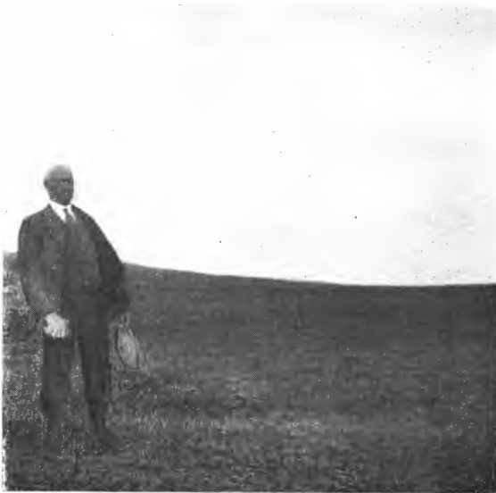
Fylkesagronom Bu på Bjoreidfeltet.

Det bør nevnes at de igangsatte kultiveringsarbeider har vært støttet økonomisk av Hordaland landbruksselskap, Bergens Myrdrkningsforening og A/S Eik & Hauskens Maskinforretning.