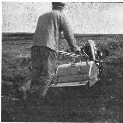
Jordfreser i arbeide.

Også i Bjoreiddalen er opdyrkingen påbegynt. Riktig nok ligger dette felt ganske høit over havet og ca. 1½ times marsj fra bilvei, men her er til gjengjeld store vidder å ta av, sannsynligvis flere tusen mål. Eiendomsforholdene i Bjoreiddalen skal være nok så uklare, men der arbeides nu for å få ordnet op i disse, så man kan gå i gang med et større felt til