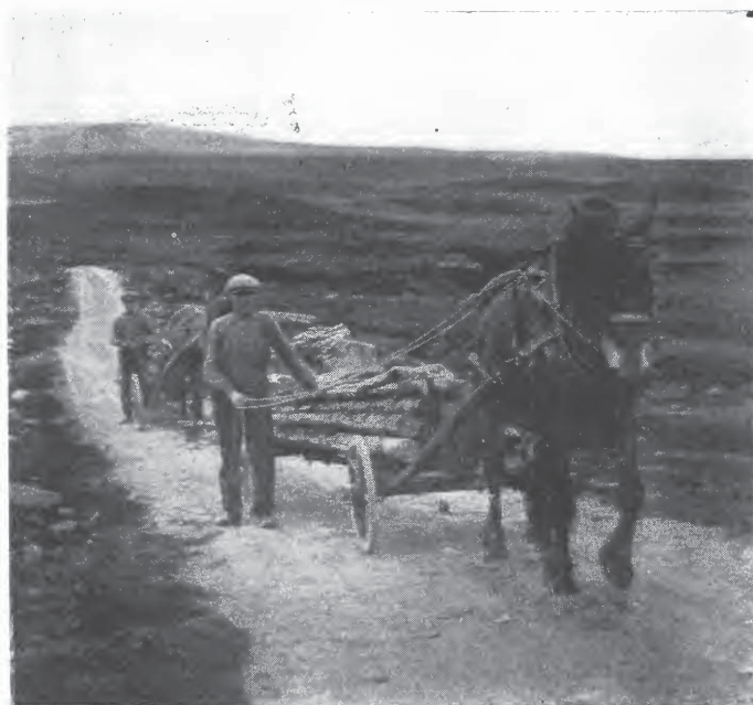
Vernskogen kjøres til brensel.

Efter forstmenns mening kan der mot all denne ødeleggelse finnes botemidler undtagen der hvor de klimatiske forhold nu umuliggjør gjenveksten. For gjenveksten vil alltid beitespørsmålet være den store bøigen som vanskeliggjør all skogskjøtsel i fjellet.