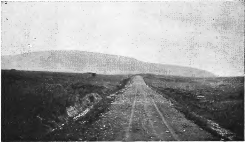
Fig. 2. Veianlegg på Smøla.

Dyrkingsverdet av dette myrparti er satt til 3, det er hvad vi har kalt noenlunde god dyrkingsjord (jfr. Medd. fra Det norske myrselskap, nr. 2, side 76, 1935). Den forholdsvis gode karakter som er tillagt den overveiende del av feltet, på tross av at overflatelaget gjennemgående er svakt formuldet, grunner sig på at halvgressartene her synes å ha hatt bra livsbetingelser, og de inntar derfor en dominerende plass i planteselskapet. Foruten Scirpus cæspitosus og Eriophorum vaginatum finnes også en ikke ubetydelig innblanding av småvoksne Carex arter og dessuten en del Eriophorum angustifolium . I kvitmosedekket finnes dessuten en betydelig innblanding av brunmose og bjørnemose ( Hypnum og Polytricum ).