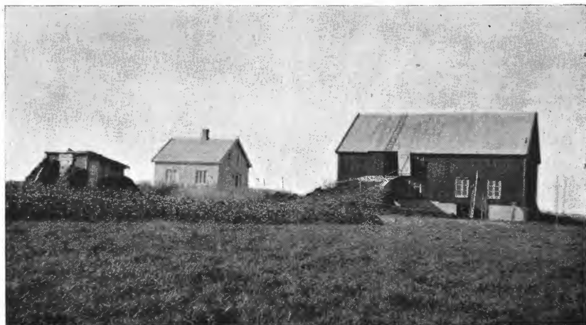
Fig. 5. Nytt bruk mellom Rom og Kvilarhaug.

Myrene omkring Ramberget eies av opsittere på strekningen Sætran til og med Gjevik. Adkomsten er lett, nær bygdevei, hvorfra der på flere steder er oparbeidet torvlandveier langt op i myrene. Dertil kommer den av Arbeidsfylkingen i 1935 anlagte vei fra Gjevik til Kvilarhaugen (2 km fra Rom). Myrenes størrelse er ca. 4.400 dekar og myrtypen vesentlig lyngrik mosemyr; høiden over havet varierer mellom 10 og 30 m, helling mot nord og øst. Dybden er ikke særlig stor, oftest 2—3 m, undtagelsesvis 4 m, trerester av større treslag mangler. Under myrlaget finnes næsten overalt fjell, bunnen er ujevn med mange opstikkende bergskjær. Bruken er nu beite og torvland. Det er imidlertid ingen tvil om at man vilde kunne bringe langt mer ut av disse store myrstrekninger ved en mer planmessig utnyttelse, hvor dyrkingsfelter, kulturbeiter og torvteiger fikk anvist hver sine områder, og hvor man så foretok de nødvendige kulturarbeider og påkostninger som måtte til for å bringe noe ut av jorden. Et stort fremskritt vilde det for øvrig være om man vilde gjennomføre drenering og planering av torvgravene. Ved gjødsling og isåing av gressfrø vilde her både kunne bli bra beiter og godt slåtteland. Dette praktiseres visstnok allerede av enkelte gårdbrukere, men det store antall er ikke kommet med ennå når det gjelder slike kulturtiltak.