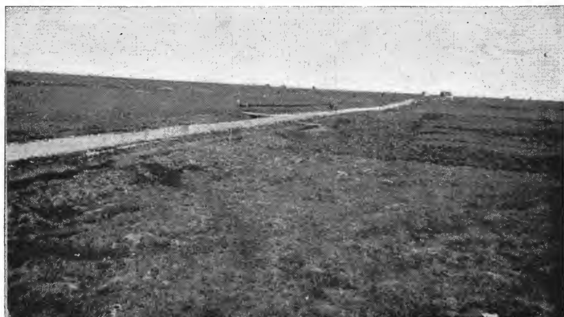
Fig. 1. Dyrkingsvidder på Smøla.

m 3 rå torv. Det projekteerte anlegg var beregnet på en årlig produksjon av ca. 35,000 tonn briketter i en driftsperiode av ca. 100 år. Når myrene på Smøla i sin tid kom sterkt i forgrunnen under diskusjonen om å avhjelpe brenselskrisen, skyldtes dette at man her hadde en av landets største torvmyrer; kvaliteten var dessuten utmerket og beliggenheten var gunstig, idet myren lå nær isfri havn og en sterkt beferdet dampskibsled. Man regnet dessuten med at driften kunde foregå omtrent uhindret av frosten også i vinterhalvåret. Det lykkedes ikke da å gjennomføre de omfattende planer om storindustriell torvbrikettfabrikasjon, og nu er vedkommende myrparti under oppdyrking.