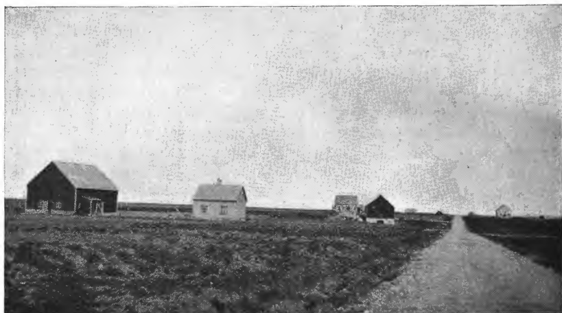
Fig. 4. Nye bruk ved Rom.

beitesmark og delvis også som torvland har de og vil også i fremtiden komme til å ha ganske stor betydning, forutsatt at berget ikke blir blottlagt.