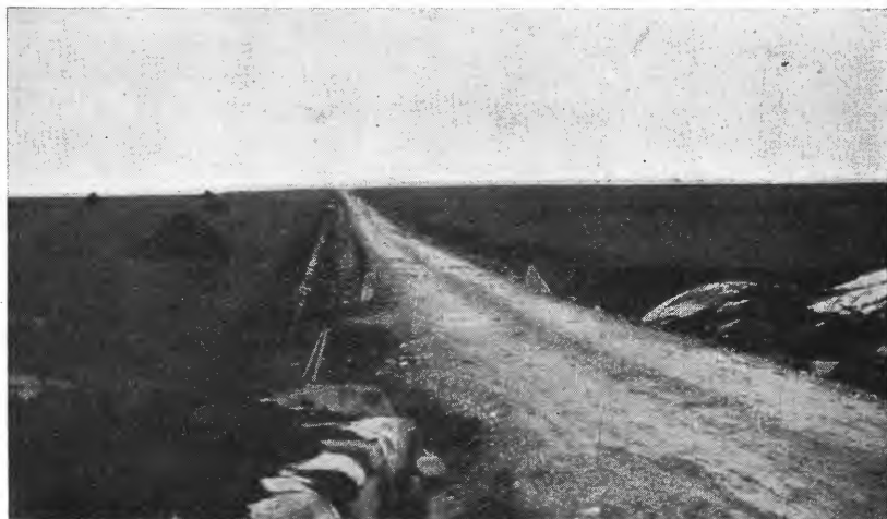
Fig. 3. Fra veianlegget Sætran—Rom.

på Kuløy, særlig osp, men også en del plantet ask og gran (rundt bebyggelsen på gården Kuli).