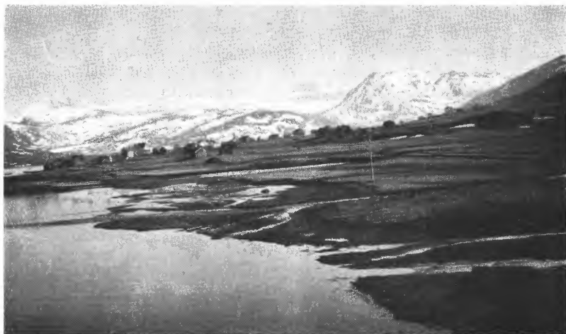
Fig. 3. Dyrket myr, Alstad i Borge.

Mellem Torvdalsvannene og Ramberg, vest for hovedveien, ligger ca. 500 dekar gressmyr i en høide av 15—20 m o. h. Feltet er noe kupert, idet her er flere bergknauser. Hellingen er liten og mot nord eller vest. Næsten overalt vokser litt bjørkekratt. Formuldingen er langt fremskredet, og dybden er oftest bare 20—50 cm. Dog finnes også partier med dybder på 2—3 m, og her er da meget god brenntorv (H 7 ). Undergrunnen består av grus. Her er til dels noe vanskelige dreneringsforhold, så dyrkingsverdet kan ikke settes bedre enn 3.