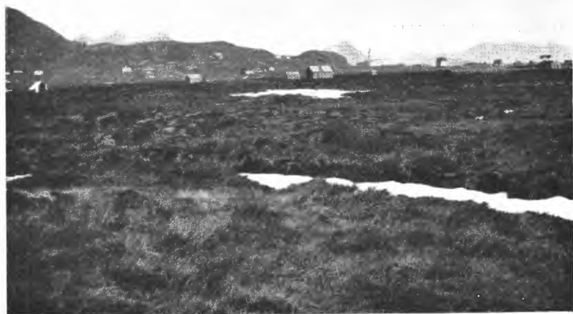
Fig. 4. Myrparti i Hol, like nord for Stamsund.

finnes god brenntorv ( H^0 ) helt ned til grus- eller gjellundergrunn. Ganske store deler av myren er avtorvet, og etterhvert planeres og dyrkes. Resultatet er bra.