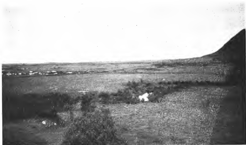
Fig. 2. Fra Gimsøya, partiet fra Jendalselven nordover mot Vinje.

tvers over midtpartiet av øya fra Årvågen i Sundklakkstrømmen til den dyrkede jord mellom Gimsøysand og Saupstad. Av denne ca. 13,200 dekar store myrstrekning er hele 42 % gressmyr, og 52 % er gressrik mosemyr, mens bare 6 % er lyngrik mosemyr. Gressmyrene er vesentlig å finne sydligst og nordligst. Den lyngrike mosemyr inngår som småpartier i den gressrike mosemyr og lar sig ikke utskille særskilt på oversiktskartet. Da de forskjellige partier av denne store myrflate er noe ulike, skal de her behandles hver for sig.