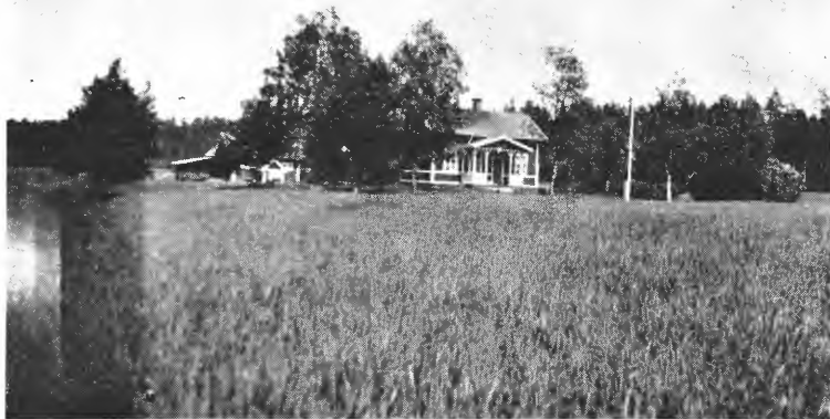
Fig. 1. Frå Flahult.

Poteten har vist seg gagnleg i vekstskiftet og er ein sikker vekst, då her er lite nattefrost. Bygg er betre dekkvekst enn haustrug, reinare og tettare eng, meire timotei og større avling fyrste år.