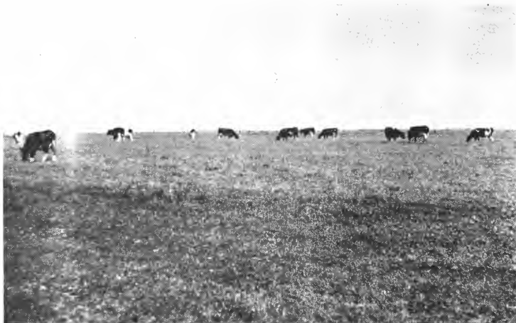
Fig. 2. Frå Store Vildmose, fint kulturbeite på mosemyr.

mineraljord saman med kalken. Ved dyrking av åkervekster, havre, rug, potet og nepe har mindre mengder kalk vist seg best, 250—500 kg CaO pr. da. Til varig eng (med kløver) har 1000—1200 kg CaO pr. da vist seg best. Sandkøyring har vist stor og sikker verknad, mengder på 20—25 m 3 pr. da har lønt seg best.