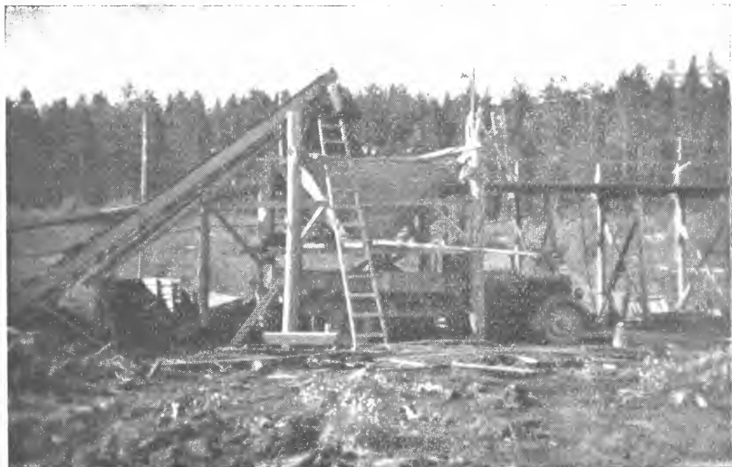
Fig. 3. Torvkvernen er montert på en oppbygning. Torva føres opp i torvkvernen med elevator. Fra torvkvernen går den grøtaktige massen ned i lessesiloen for lastebilene. (Fra Pukerudmyra brenntorvanlegg, Sokna.).