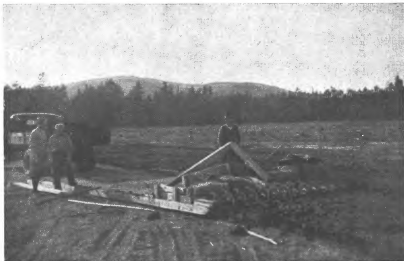
Fig. 4. Torvmassen formes med en såkalt «feltpress» som trekkes frem av bilen etter at massen er tømt ut. Torva deles opp i lengderetningen med kniver påmontert feltpressen og i tverretningen med et håndredskap. (Fra Pukerudmyra brenntorvanlegg, Sokna.).

Det har i år vist seg store ulemper med å bruke dyrket mark til tørkeplass, idet at grasveksten har hindret tørkingen av torva og gjort høstingen mer besværlig, en erfaring som for øvrig ikke er av ny dato.