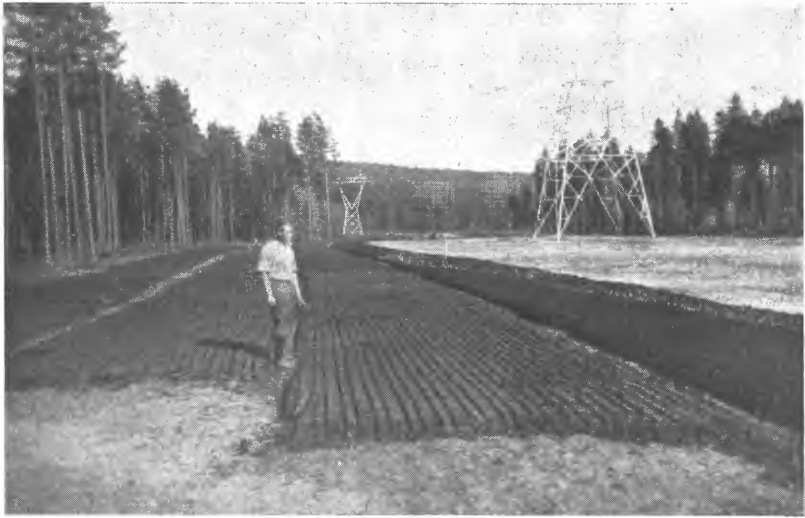
Fig. 5. Utlagt torv på tørkefeltet, som i dette tilfelle består av planert fastmark, fin sand. (Fra Pukerudmyra brenntorvanlegg, Sokna.).

bane. Ved et tredje anlegg ble det forsøkt transport av stykketorv til tørkefeltet med traller på gummihjul med svingbar forstilling.