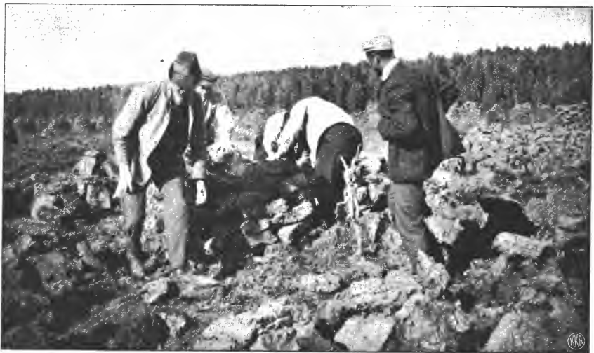
Deltagerne lærer at bygge kuver.