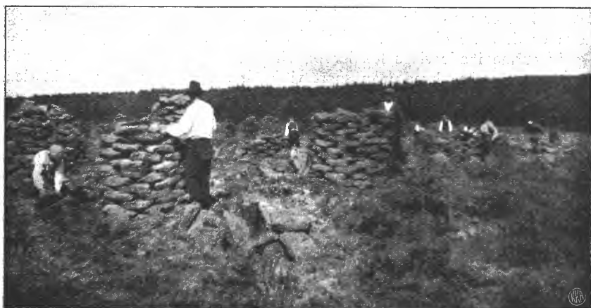
Deltagerne bygger kuver.

De praktiske øvelser foretokes de første 4 dager paa Rustad Brændtorvfabrik , hvor deltagerne fik anledning til at være med i alle arbeider vedrørende brændtorvens opgravning, bearbeidning, tørkning og indbjergning. De øvrige dager var deltagerne beskjøftiget paa Vinger Torvstrøfabrik og fik her være med i alle arbeider vedrørende torvstrøtilvirkningen, nemlig stikning og utlægning, tørkning, indbjergning, sønderrivning, emballering og de færdige ballers lastning paa jernbanevogner. Særlig blev der lagt megen vekt paa tørknings- og indbjergningsarbeider. Deltagerne blev saaledes opøvet i bygning av kuver og stakker, samt opbygning av hesjer, oplægning av strøtorv i