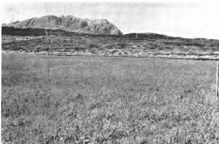
Fig. 1. Fosfatforsøk. 0 kg P, 2 kg P i superfosfat, 2 kg P i renofosfat, 4 kg P i superfosfat, 4 kg P i renofosfat. Dei mørke ruter er utan eller med for lite P.

Skort på fosfor hjå kulturplantane kan syna seg på ymse måtar alt etter graden av skorten, og etter kva slag kulturvokster skorten syner seg på. Det første symptom på fosforskort hjå mest alle kulturplantar er at dei får ein mørk, matt-grøn eller skit-grøn farge på bladverket. I engforsøk med fosfatgjødning vil denne skit-grøne fargen syna seg skarpt avgrensa til forsøksleidd utan eller med for lite fosfor i høve til gjødslinga elles. Men forsøka har ikkje gjeve sikker avlingsmink, eller avlingsauke for fosfatgjødsling, og kjem det ikkje andre og sterkare symptom på fosforskort fram seinare, vil så vel timotei som andre vokstrar å sjå til, utvikla seg om lag normalt.