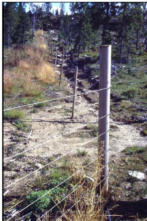
Figur 1: Bildet viser et 6-tråds elektrisk gjerde etter standarden som DN har satt (foto: R. Bjøru).

Generelt benyttes tre til fire strømbånd (ikke tråder). Benyttes fire tråder, er ofte den nest øverste ikke tilknyttet strøm, men i stedet koplet til strømapparatets jordtilkopling for å styrke jordingen og dermed virkningen av strømstøtet. Gjerdet er 105 cm høyt og spenningen varierer fra 4000-9000 V, avhengig av jordingsforholdene. Gjerdestolpene er av plast/glassfiber eller stål som presses 5-10 cm ned i bakken. For å slippe press på hjørnestolper er det anbefalt å montere gjerdet i en sirkel/oval form rundt bikubene framfor å ha skarpe hjørner. Materialene er kjøpt inn fra en og samme forhandler, men oppsett og materialvalg kan nok variere noe mellom birøktere, blant annet når det gjelder dimensjonen på hjørnestolpene og antall tråder. Denne gjerdetypen er langt enklere å flytte på enn DN sitt standard-gjerde, og er således bedre tilpasset vandrebirøktet.