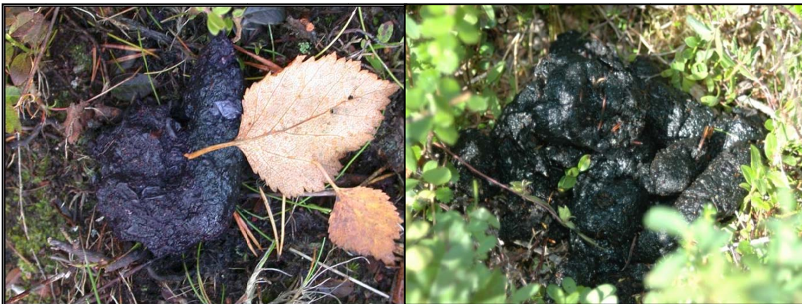
Figur 1. Rødrev ekskrement (venstre) og bjørne ekskrement (høyre) kan forveksles i innsamling til populasjonsovervåkning på brunbjørn.