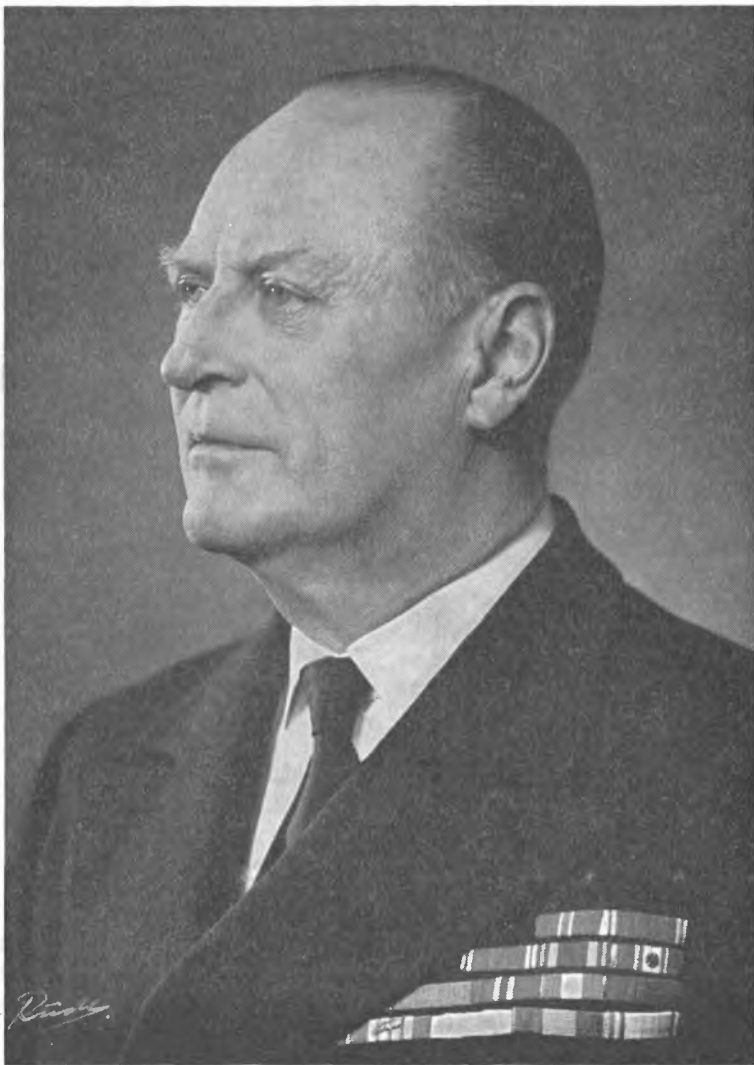
H. M. KONG OLAV V

Det norske jord- og myrselskaps høye beskytter.